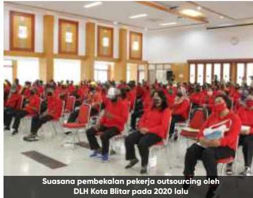
Suasana pembekalan pekerja outsourcing oleh DLH Kota Blitar pada 2020 lalu

Sebelumnya, salah satu pekerja yang dirumahkan sejak 31 Desember 2020 lalu me-