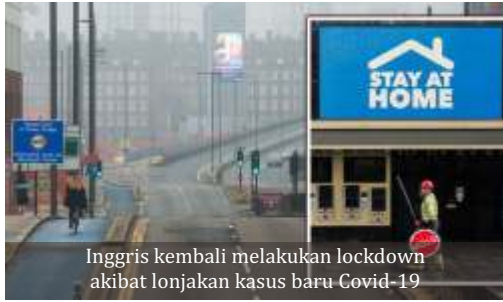
Inggris kembali melakukan lockdown akibat lonjakan kasus baru Covid-19