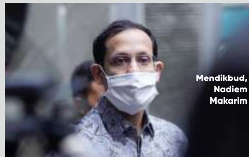
Mendikbud, Nadiem Makarim

"14 yang sudah siapkan diri untuk buka ada Jawa Barat, DIY, Riau, Sumatera Selatan, Lampung, Kalimantan Tengah, Sulawesi Utara, Sulawesi Tenggara, Bali, NTB, Maluku