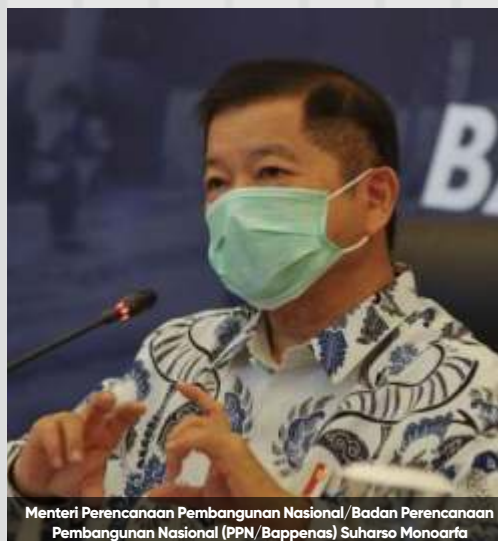
Menteri Perencanaan Pembangunan Nasional/Badan Perencanaan Pembangunan Nasional (PPN/Bappenas) Suharso Monoarfa

Nantinya program tersebut akan dievaluasi dan disusun kembali oleh Bappenas. Suharso bilang program bantuan sosial yang selama ini berada di berbagai kementerian dan lembaga akan disusun kembali agar menjadi efektif dan bisa disatupadukan.