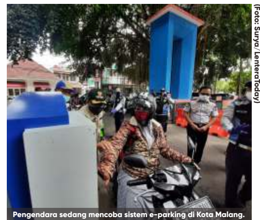
Pengendara sedang mencoba sistem e-parking di Kota Malang.

Sementara terkait inovasi pembayaran, sistem pembayaran e-parking saat ini memang masih menggunakan pembayaran manual. "Namun, dalam waktu sesingkat-singkatnya, kami akan berkoordinasi dengan Bank Jatim dan BPKAD untuk menerapkan e-