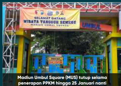
Madiun Umbul Square (MUS) tutup selama penerapan PPKM hingga 25 Januari nanti

Mengatasi masalah pakan satwa herbivora, Afri memanfaatkan tanah lapang milik Madiun Umbul Square untuk dijadikan lahan tanaman kangkung, sawi dan pepaya. Langkah ini sedikit membantu untuk kelangsungan hidup binatang pemakan tanaman. "Yang satwa karnivora, mau tidak