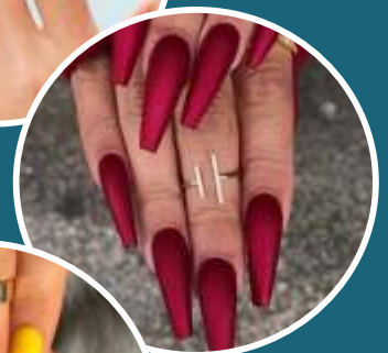
VELVETY NAIL ART