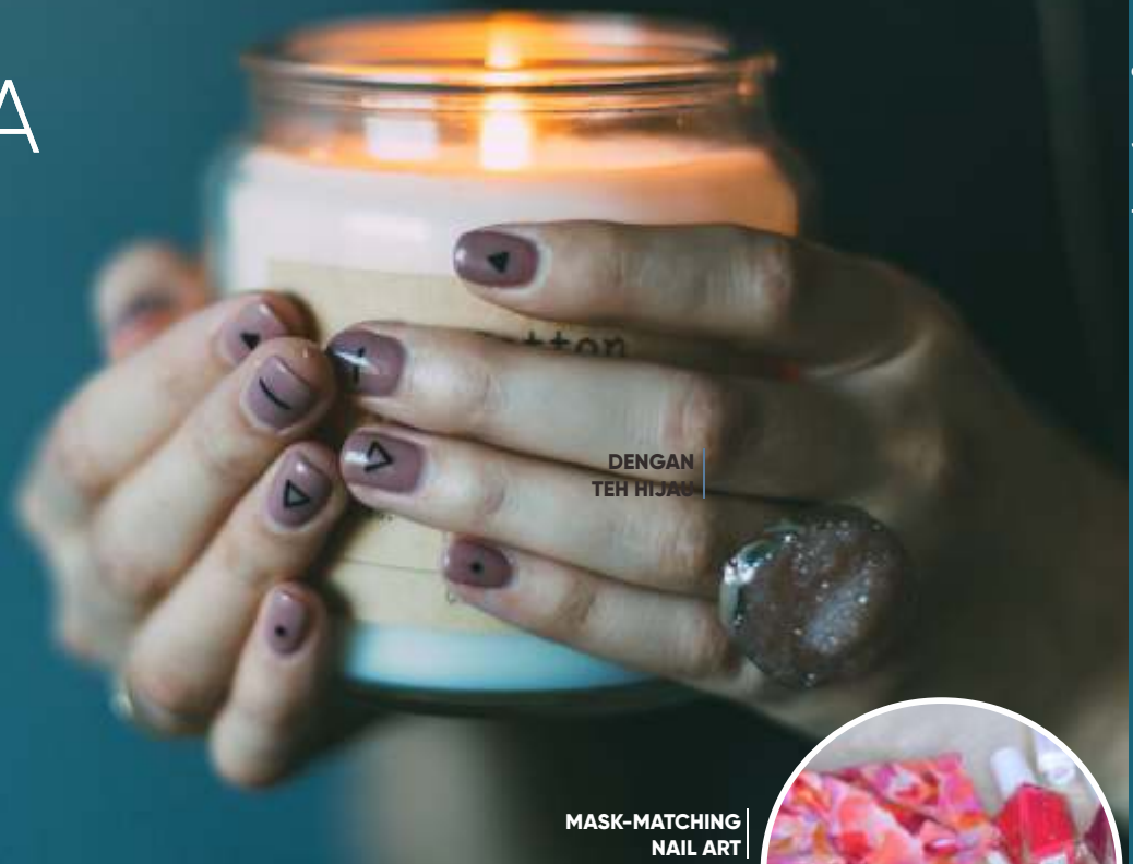
DENGAN TEH HIJAU