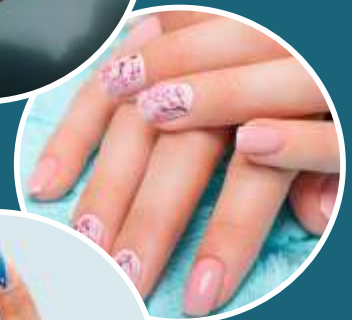
PLAYFUL PINK SPRING NAIL ART