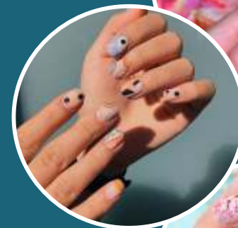
MINIMALIST NAIL ART

Desain nail art satu ini cukup mudah dilakukan di rumah. Kamu hanya memerlukan kuteks dengan beberapa warna dan sapukan kutek tersebut ke atas permukaan kuku. Jadilah kuku yang berwarna-warni! Mau pilih yang mana? (ist)