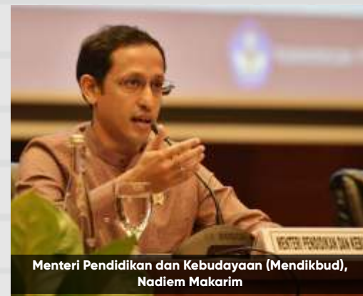
Menteri Pendidikan dan Kebudayaan (Mendikbud), Nadiem Makarim

Bagian kedua dari Asesmen Nasional adalah survei karakter yang dirancang untuk mengukur capaian peserta didik dari