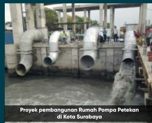
Proyek pembangunan Rumah Pompa Petekan di Kota Surabaya

"Pompa harus ditambah tidak hanya untuk mengalirkan air ke laut tapi juga harus ada rumah-rumah pompa yang berfungsi mengalirkan air ke bozem pada saat terjadi pasang laut," ujarnya.