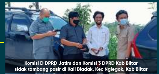
Komisi D DPRD Jatim dan Komisi 3 DPRD Kab Blitar sidak tambang pasir di Kali Bladak, Kec Nglegok, Kab Blitar

Guntur menegaskan sesuai harapan penambang pemerintah harus hadir, untuk membantu mempermudah proses perizinan tambang pasir. Sehingga penambang yang sudah semangat mengurus izin, pemerintah yang membantu. "Maka izin bisa segera dimiliki, sehingga penambang pasir bisa