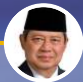
Simpatisan salah satu pendiri sekaligus Ketua Dewan Pembina Partai Demokrat Susilo Bambang Yudhoyono (SBY).