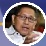
Simpatisan mantan Ketua Umum Partai Demokrat Anas Urbaningrum