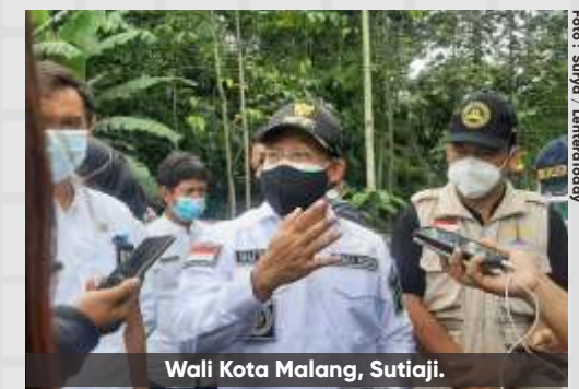
Wali Kota Malang, Sutiaji.

"Semoga rencana ini bisa segera direalisasikan, nanti juga rencananya akan ada pelebaran jalan di wilayah tunggul wulung, karena akses menuju wilayah Dinoyo ini cenderung lebih sempit jalannya," pungkaskan