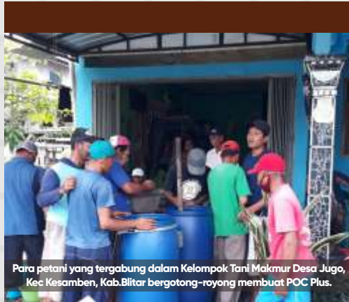
Para petani yang tergabung dalam Kelompok Tani Makmur Desa Jugo, Kec Kesamben, Kab.Blitar bergotong-royong membuat POC Plus.

B LITAR – Pupuk yang makin mahal dan langka, mendorong petani di Kabupaten Blitar melakukan inovasi dengan menciptakan Pupuk Organik Cair (POC) Plus. Para petani tersebut tergabung dalam Kelompok Tani Makmur di Dusun/Desa Jugo, Kecamatan Kesamben.