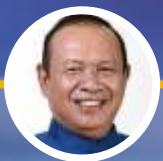
Simpatisan mantan ketua umum Partai Demokrat almarhum Hadi Utomo.