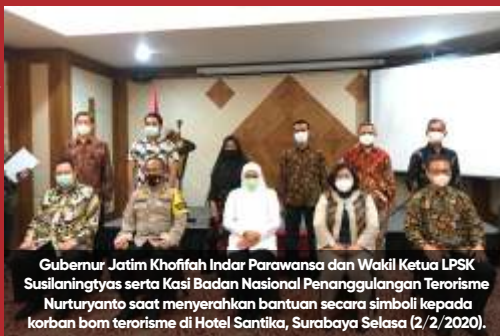
Gubernur Jatim Khofifah Indar Parawansa dan Wakil Ketua LPSK Susilaningtyas serta Kasi Badan Nasional Penanggulangan Terorisme Nurturyanto saat menyerahkan bantuan secara simbolis kepada korban bom terorisme di Hotel Santika, Surabaya Selasa (2/2/2020).

Surabaya-Sebanyak 19 orang warga Surabaya yang menjadi korban langsung dan korban tak langsung (ahli waris) tindak pidana terorisme, mendapatkan kompensasi dari negara melalui Lembaga Perlindungan Saksi dan Korban (LPSK). Adapun jumlah kompensasi yang akan dibayarkan oleh negara melalui LPSK di wilayah Surabaya adalah sebesar Rp 3,2 miliar