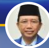
Simpatisan mantan sekjen Partai Demokrat Marzuki Alie.

5 NAMA YANG DIDUGA SEBAGAI AKTOR DIBALIK KUDETA DI TUBUH PARTAI DEMOKRAT