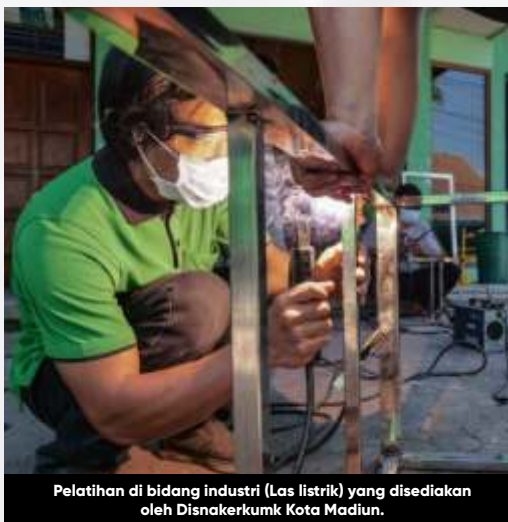
Pelatihan di bidang industri (Las listrik) yang disediakan oleh Disnakerkum Kota Madiun.

Mujib meminta masyarakat Bangil bersabar, karena upaya konkrit Pemkab Pasuruan membenahi tanggul yang jebol dengan bronjong ini memerlukan waktu dua bulan. "Pak Bupati sudah komitmen dengan penanganan darurat ini. Kami berharap ada good will dari pemerintah pusat karena sungai ini sungainya pemerintah pusat melalui BBWS dan ini masih banyak PR penguatan tanggul di utara tanggul jebol ini," tandasnya. (adv)