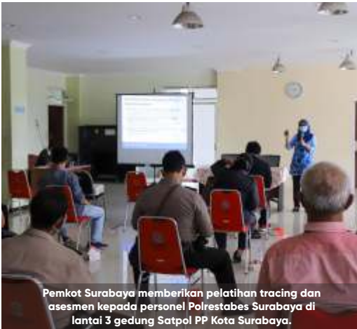
Pemkot Surabaya memberikan pelatihan tracing dan asesmen kepada personel Polrestabes Surabaya di lantai 3 gedung Satpol PP Kota Surabaya.