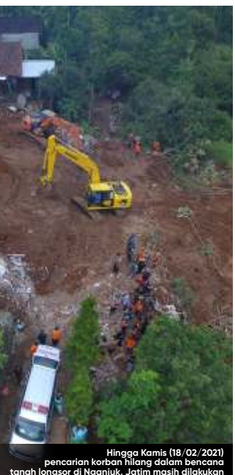
Hingga Kamis (18/02/2021) pencarian korban hilang dalam bencana tanah longsor di Nganjuk, Jatim masih dilakukan

TABEL BENCANA 1 JANUARI - 18 FEBRUARI 2021