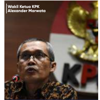
Wakil Ketua KPK Alexander Marwata

Dia mengatakan KPK akan menangani kasus suapnya. Sementara, Kementerian Keuangan akan memeriksa ulang pembayaran pajak yang diduga dipengaruhi oleh suap