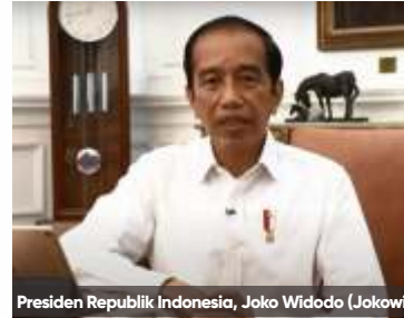
Presiden Republik Indonesia, Joko Widodo (Jokowi)

Bahlil pun meminta pengusaha di bidang ini mau berbesar hati menerima keputusan pemerintah. "Perizinan ini sudah terjadi sejak pemerintahan pertama, namun tidak untuk menyalahkan satu dengan lain. Kepada teman-teman dunia usaha yang ingin ini tetap dilanjut-