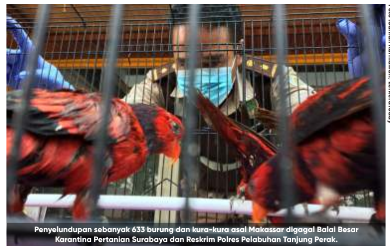
Penyelundupan sebanyak 633 burung dan kura-kura asal Makassar gagal Balai Besar Karantina Pertanian Surabaya dan Reskrim Polres Pelabuhan Tanjung Perak.

Nuri Tanimbar dan Kakatua Jambul Putih merupakan jenis satwa yang dilindungi sehingga tidak dapat diburu dan diperjualbelikan. Oleh sebab itu, kegagalan penyelundupan ini merupakan