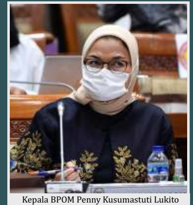
Kepala BPOM Penny Kusumastuti Lukito

Kendati demikian, Penny tak menyertakan secara detail bagaimana hasil review uji klinis I tersebut. Selanjutnya BPOM, kata dia, akan menggelar pertemuan bersama para ahli dan tim peneliti vaksin nusantara pada 16 Maret 2021. "Saya hanya memberikan komentar bahwa data yang diberikan tadi tidak sama dengan data yang diberikan pada BPOM, dan kami sudah melakukan evaluasi," kata Penny dalam agenda Rapat Kerja bersama