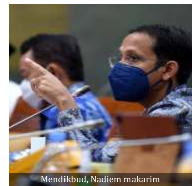
Mendikbud, Nadiem makarim

Kecuali yang diblokir oleh Kementerian Komunikasi dan Informatika (Kemenkominfo) serta daftar pengecualian yang tercantum pada situs resmi bantuan kuota data internet Kemendikbud: http://kuota-belajar.kemdikbud.go.id seperti Instagram, TikTok dan aplikasi lainnya. (ist)