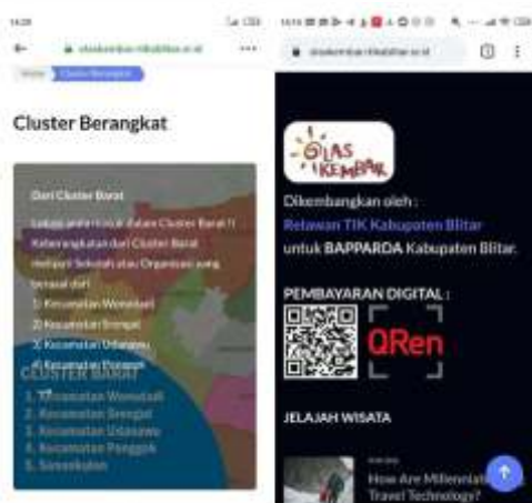
Tampilan aplikasi berbasis website olaskembar.id yang lolos 20 besar WSIS Prizes 2021

Informasi, dari seluruh penjuru dunia," ujar Hamzah, Kamis (11/3/2021).