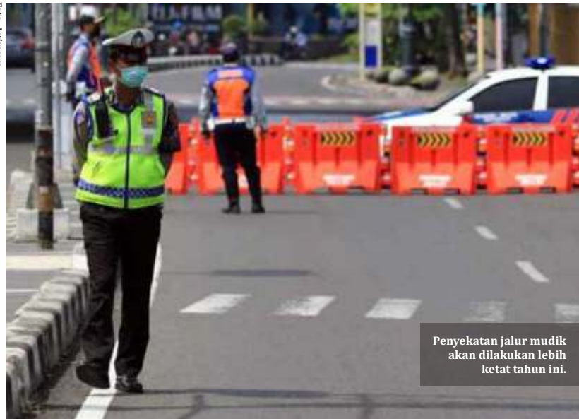
Penyekatan jalur mudik akan dilakukan lebih ketat tahun ini.

Jakarta-Banjir protes terkait larangan mudik tak membuat pemerintah goyah. Pemerintah resmi melarang mudik Lebaran tahun ini. Bahkan bagi yang nekat mudik tanpa alasan yang mendesak, kepolisian bersikukuh akan memutar balik.