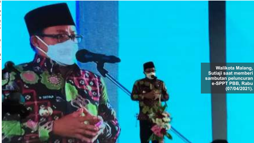
Walikota Malang, Sutiaji saat memberi sambutan peluncuran e-SPPT PBB, Rabu (07/04/2021).

M ALANG- Kemudahan pelayanan di era digital dan adaptasi di tengah pandemi Covid-19 sudah menjadi keharusan. Mengerti akan keinginan dari masyarakat saat ini, Pemerintah Kota (Pemkot) Malang pun terus mengembangkan sistem pembayaran non-tunai yang praktis.