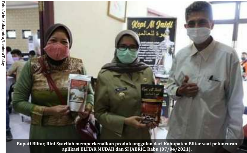
Bupati Blitar, Rini Syarifah memperkenalkan produk unggulan dari Kabupaten Blitar saat peluncuran aplikasi BLITAR MUDAH dan SI JABRIC, Rabu (07/04/2021).

B LITAR – Pandemi Covid-19 belum diketahui kapan akan berakhir. Pemerintah daerah pun mengeluarkan berbagai strategi untuk memulihkan perekonomian. Kabupaten Blitar misalnya baru saja meluncurkan 2 aplikasi sekaligus untuk menarik investor.