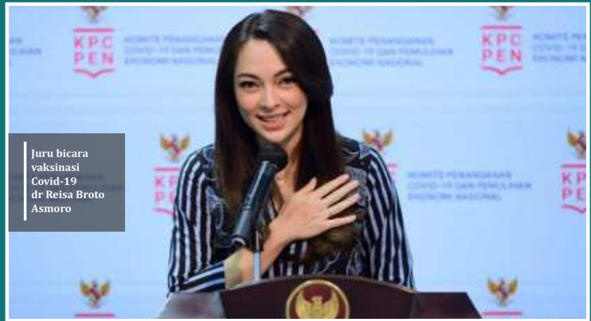
Juru bicara vaksinasi Covid-19 dr Reisa Broto Asmoro

Sementara itu, sebanyak 126 pasien meninggal akibat Covid-19 pada hari ini. Sehingga, total kasus meninggal akibat Corona menjadi 42.782 kasus. Pada hari ini, daerah yang melaporkan penambahan kasus baru terbanyak adalah Provinsi Jawa Barat, yakni sebanyak 1.456 kasus baru Covid-19. Sedangkan daerah dengan kasus sembuh tertinggi ada di Jawa Tengah, yakni sebanyak 1.952 kasus sembuh. (ist)