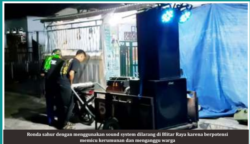
Ronda sahur dengan menggunakan sound system dilarang di Blitar Raya karena berpotensi memicu kerumunan dan mengganggu warga

Sementara itu Kapolres Blitar, AKBP Leonard M Sinambela menyampaikan sesuai SE Bupati Blitar No. 400/91/409.07/2021 tentang Pelaksanaan Rangkaian Ibadah di Bulan Ramadhan dan Perayaan Idul Fitri 1442 H Dalam Kondisi Pandemi Covid-19, telah diatur mengenai larangan ronda sahur menggunakan pengeras suara atau sound sistem. "Dalam SE Bupati Blitar poin E, disebutkan ronda