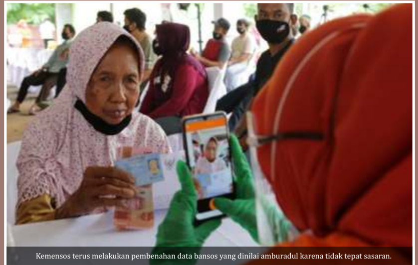
Kemensos terus melakukan pembenahan data bansos yang dinilai ambruk karena tidak tepat sasaran.

Risma menyatakan, data tersebut juga bisa dipakai Pemda untuk memperbaharui data penerima bansos secara berkala. "Pemda bisa update, karena tak bisa data itu selamanya tetap, karena ada yang meninggal,