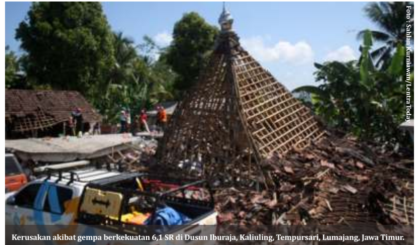
Kerusakan akibat gempa berkekuatan 6,1 SR di Dusun Iburaja, Kaliuling, Tempursari, Lumajang, Jawa Timur.

Sebelumnya, Deputi Bidang Meteorologi BMKG, Guswanto MSi dalam keterangan tertulisnya dikutip Selasa (13/04) mengungkapkan, pada tanggal 12 April 2021, pukul 07.00 WIB, BMKG menemukan terbentuknya bibit siklon tropis 94W. Bibit siklon tropis 94 W ini terpantau berada di sekitar Pasifik Barat sebelah utara Papua, tepatnya di