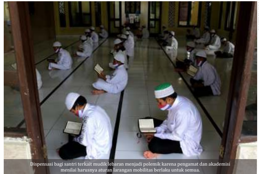
Dispensasi bagi santri terkait mudik lebaran menjadi polemik karena pengamat dan akademisi menilai harusnya aturan larangan mobilitas berlaku untuk semua.

Menurutnya, jika pemerintah terlalu banyak memberikan dispensasi, pemerintah bakal terkesan tidak serius dalam menangani penyebaran covid 19 di massa mudik Lebaran nanti. Bila ada wacana permintaan