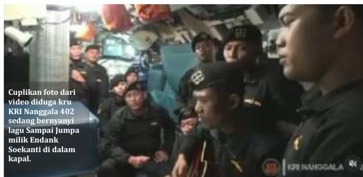
Cuplikan foto dari video diduga kru KRI Nanggala 402 sedang bernyanyi lagu Sampai Jumpa milik Endank Soekanti di dalam kapal.

Keretakan tersebut membuat barang-barang yang berada di dalam kapal selam kemudian terangkat keluar. Barang-barang itulah yang kemudian ditemukan oleh tim pencari dari TNI AL selama beberapa hari. "Barang-barang ini sebenarnya ada di dalam, apalagi penahan untuk pelurus torpedo ini sampai bisa keluar, berarti terjadi keretakan yang besar," ucapnya. (wan,ist)