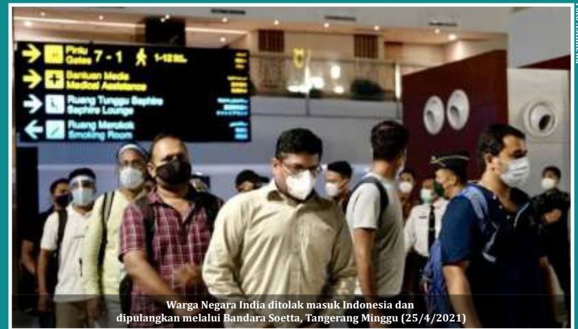
Warga Negara India ditolak masuk Indonesia dan dipulangkan melalui Bandara Soetta, Tangerang Minggu (25/4/2021)

"Kita nggak perlu menstigmakan WN India. Kita harus waspada dengan semua orang yang dari luar negeri. Memang sekarang India yang paling tinggi, tapi negara lain juga tinggi," kata