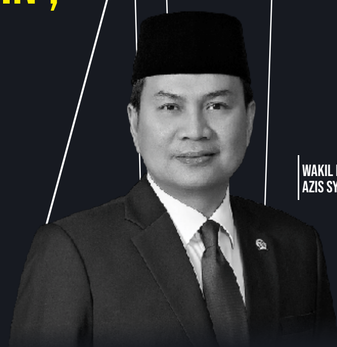
WAKIL KETUA DPR AZIS SYAMSUDDIN