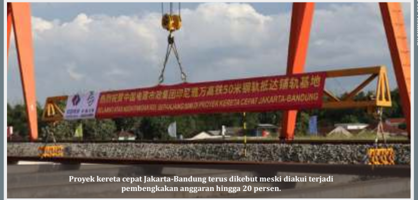
Proyek kereta cepat Jakarta-Bandung terus dikebut meski diakui terjadi pembengkakan anggaran hingga 20 persen.

Kemudian, menurut Luhut, berdasarkan penjelasan yang disampaikan oleh PT KCIC, penambahan Stasiun Padalarang dilakukan untuk memberikan pilihan kenyamanan terintegrasi yang lebih baik untuk masy-