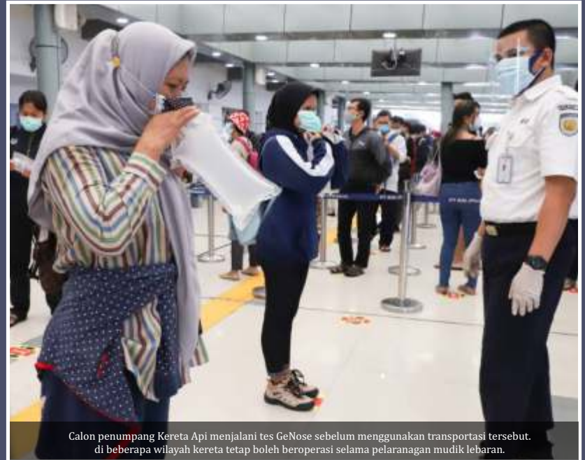
Calon penumpang Kereta Api menjalani tes GeNose sebelum menggunakan transportasi tersebut. di beberapa wilayah kereta tetap boleh beroperasi selama pelaksanaan mudik lebaran.

Pria yang juga menjabat Ketua Bidang Advokasi dan Kemasyarakatan Masyarakat Transportasi Indonesia (MTI) Pusat ini, lebih lanjut menyampaikan, larangan mudik Lebaran memberatkan bagi pekerja konstruksi dengan penghasilan mingguan di