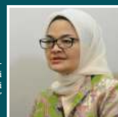
KEPALA BADAN POM PENNY KUSUMASTUTI LUKITO

"Kita kan harus mendukung produksi dalam negeri terutama produksi anak bangsa. Kita tahu bahwa vaksin-vaksin dari luar ini juga masuknya enggak gampang ke Indonesia apalagi saat sekarang ini embargo vaksin dilakukan oleh negara-negara penghasil vaksin. Oleh karena itu kita harus support vaksin-vaksin yang ada."