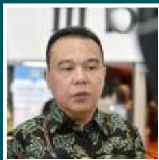
WAKIL KETUA DPR RI, SUFMI DASCO AHMAD

"Saya punya penyakit jantung, ring sudah 5. Komorbid. Saya juga warga negara yang punya hak untuk mendapat kesehatan dan divaksin. Sementara Sinovac tidak memungkinkan, AstraZeneca tidak memungkinkan, Johnson & Johnson tidak memungkinkan. Yang memungkinkan cuma ini, karena diambil dari sel darah sendiri sehingga tidak ada unsur luar yang masuk."