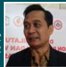
KETUA UMUM PENGURUS BESAR IKATAN DOKTER INDONESIA (IDI) DAENG M FAQIH

"Tahapan-tahapan tersebut tidak bisa diabaikan, dan pengabaian itu sangat banyak sekali aspeknya di dalam pelaksanaan uji klinik dari fase 1 dari vaksin dendritik."