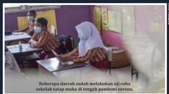
Beberapa daerah sudah melakukan uji coba sekolah tatap muka di tengah pandemi corona.

pada hari ini. Total kasus meninggal akibat Corona menjadi 45.116 kasus. Pada hari ini, daerah yang melaporkan penambahan kasus baru terbanyak adalah Provinsi Jawa Barat, yaitu sebanyak 1.354 kasus. Sedangkan daerah dengan kasus sembuh tertinggi juga ada di Jawa Barat. (ist)