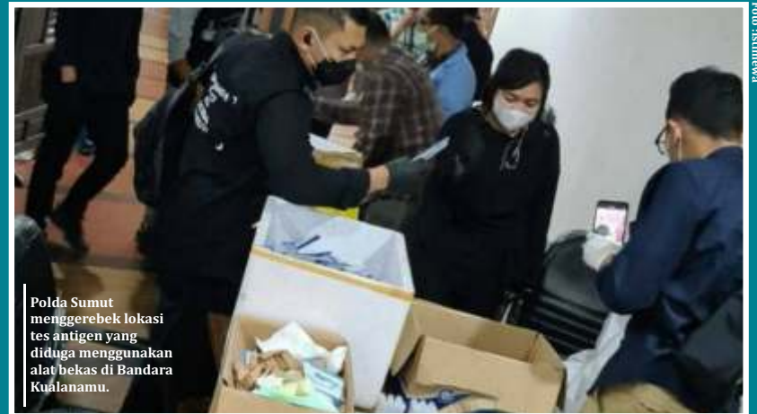
Polda Sumut menggerebek lokasi tes antigen yang diduga menggunakan alat bekas di Bandara Kualanamu.

Sahroni menambahkan, Polri harus membentuk tim bersama kementerian kesehatan untuk merazia dan mengaudit lab-lab tes Covid-19 yang sudah ada. Hal ini diperlukan untuk memastikan hal yang sama tidak