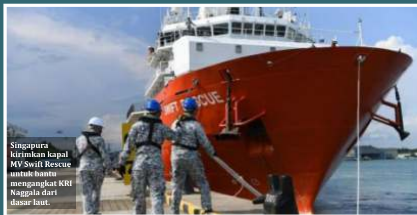
Singapura kirimkan kapal MV Swift Rescue untuk bantu mengangkat KRI Nanggala dari dasar laut.

Di tengah rotasi SDM TNI, pengamat militer Lembaga Studi Per-