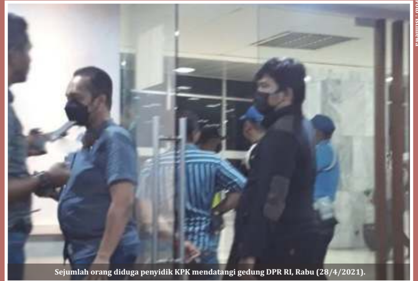
Sejumlah orang diduga penyidik KPK mendatangi gedung DPR RI, Rabu (28/4/2021).