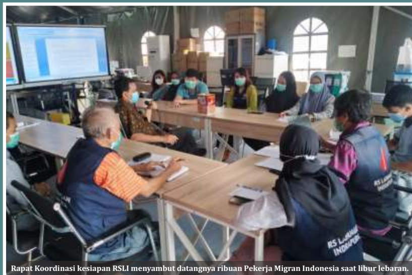
Rapat Koordinasi kesiapan RSLI menyambut datangnya ribuan Pekerja Migran Indonesia saat libur lebaran.

"Kami juga terus edukasi dan penyadaran akan perkembangan dan penanganan Covid-19. Serta upaya