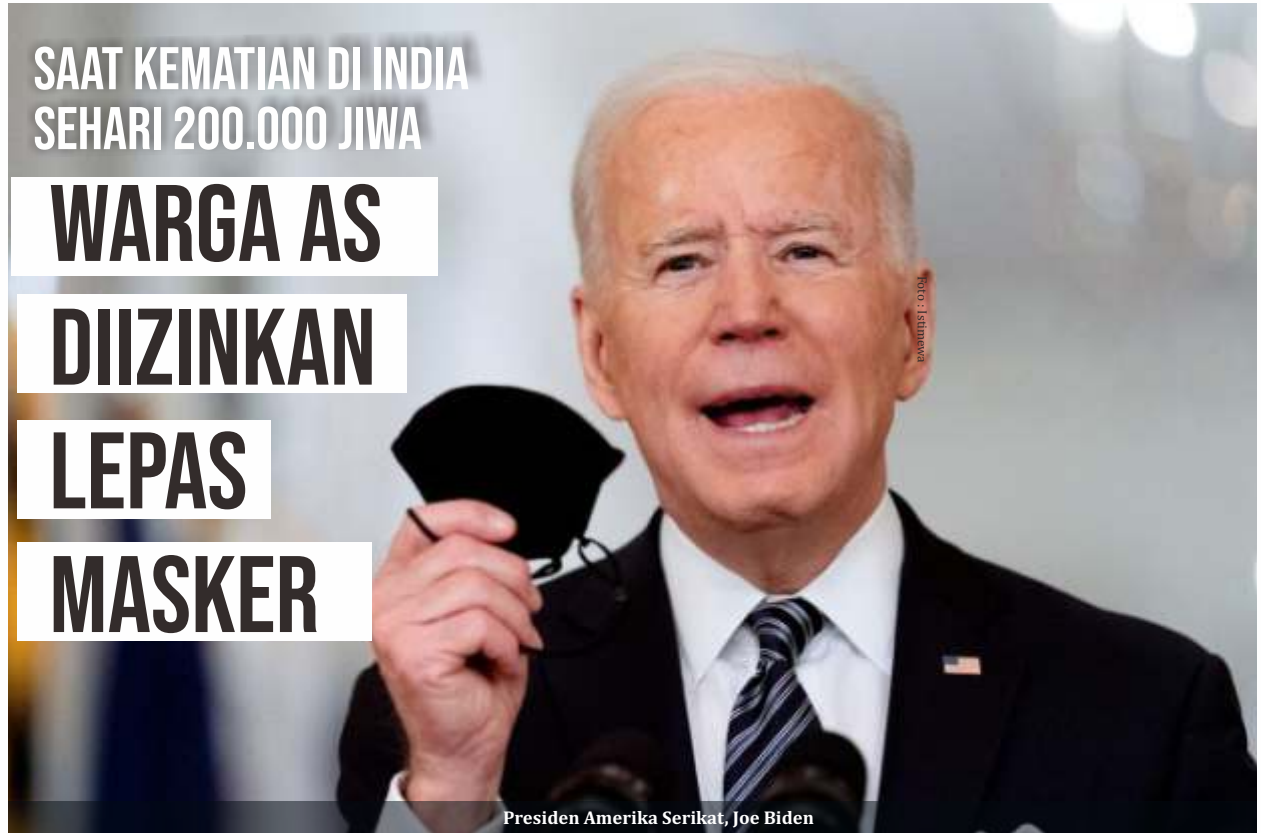
Presiden Amerika Serikat, Joe Biden

Serikat (AS) memberi pasokan komponen vaksin. Pemerintah Perdana Menteri Narendra Modi kini disebut banyak pihak gagal membendung corona di negeri itu. Sejumlah politisi bahkan memintanya untuk mundur.