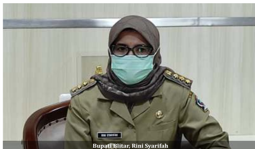
Bupati Blitar, Rini Syarifah

Secara terpisah Bupati Blitar, Rini Syarifah ketika sedang dikonfirmasi mengenai kosongnya jabatan Sekda, karena masa jabatan Pj Sekda Kabupaten Blitar, Mujianto berakhir pada 11 Mei 2021. Menyampaikan jika dari 3 nama terbaik calon Sekda, sudah menge-rucut ke 1 nama. "Sudah-sudah menge-rucut ke 1 nama dari 3 nama terbaik, yang lolos seleksi," kata Bupati