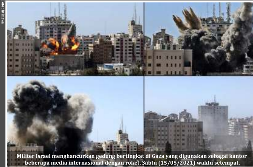
Militer Israel menghancurkan gedung bertingkat di Gaza yang digunakan sebagai kantor beberapa media internasional dengan roket, Sabtu (15/05/2021) waktu setempat.

Jakarta - Presiden Joko Widodo (Jokowi) mengutuk keras serangan Israel ke Palestina yang telah mengakibatkan hilangnya nyawa ratusan orang, termasuk perempuan dan anak-anak. Jokowi menegaskan agresi Israel harus dihentikan.