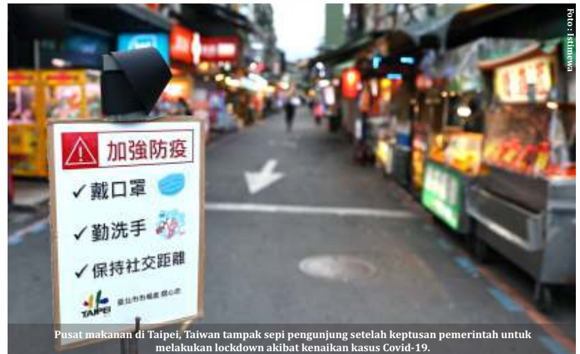
Pusat makanan di Taipei, Taiwan tampak sepi pengunjung setelah keputusan pemerintah untuk melakukan lockdown akibat kenaikan kasus Covid-19.

Channel News Asia menyebut Malaysia mencatat total 444.484 kasus