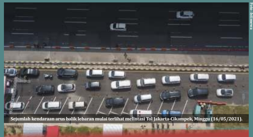
Sejumlah kendaraan arus balik lebaran mulai terlihat melintasi Tol Jakarta-Cikampek, Minggu (16/05/2021).

"Tapi bukan berarti gagal sama sekali. Secara umum sudah bagus. Kita juga betul-betul memanfaatkan data historis penanganan peniadaan mudik tahun lalu, termasuk kita perketat jalur-jalur tikus dan kita pelajari secara detail, kemudian modus operandi mereka yang nekat dengan cara-cara yang menurut mereka kreatif tapi sebetulnya itu tidak terbukti juga sudah kita antisipasi," tuturnya (ist)