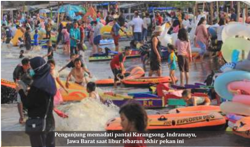
Pengunjung memadati pantai Karangsong, Indramayu, Jawa Barat saat libur lebaran akhir pekan ini

Jakarta-Sudah diprediksi sejak awal, bila aturan pemerintah saat larangan mudik lebaran malah memicu ledakan mobilitas pariwisata. Pemerintah pun dinilai kecolongan. Meski di satu sisi bisa mengendalikan arus pulang kampung, tapi di sisi lain destinasi wisata penuh sesak.