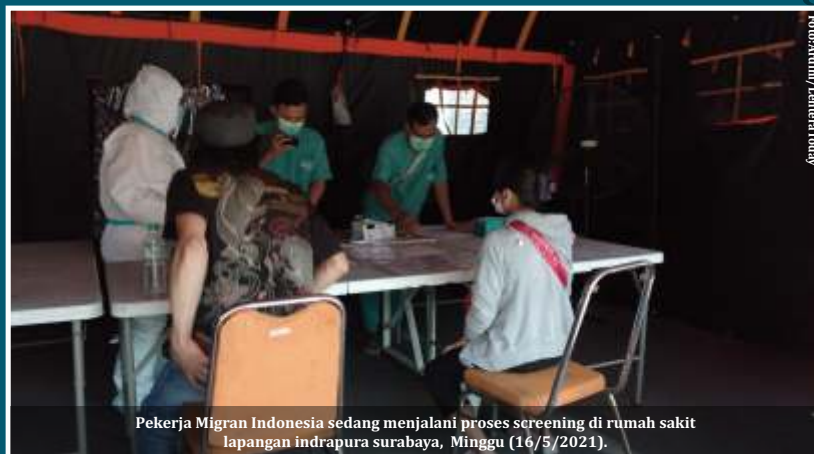
Pekerja Migran Indonesia sedang menjalani proses screening di rumah sakit lapangan indrapura surabaya, Minggu (16/5/2021).

Radian Jadid juga mengimbau kepada masyarakat agar tidak lupa menerapkan protokol kesehatan dengan ketat. Para tenaga kesehatan khususnya, sangat penting harus waspada. "Nanti kalau tenaga kesehatan tidak ada siapa yang menangani, protokol