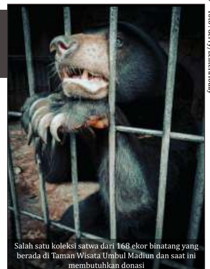
Salah satu koleksi satwa dari 168 ekor binatang yang berada di Taman Wisata Umbul Madiun dan saat ini membutuhkan donasi

Adapun kebutuhan mendasar yang diperlukan untuk pemeliharaan hewan-hewan tersebut di antaranya makanan satwa berupa buah-buahan, daging ayam segar, dan obat-obatan. Selain wahana edukasi satwa, Taman Wisata Umbul yang berada di Desa Glonggong, Kecamatan Dolopo, Kabupaten Madiun tersebut juga terdapat delapan wahana permainan yang menjadi jujukan