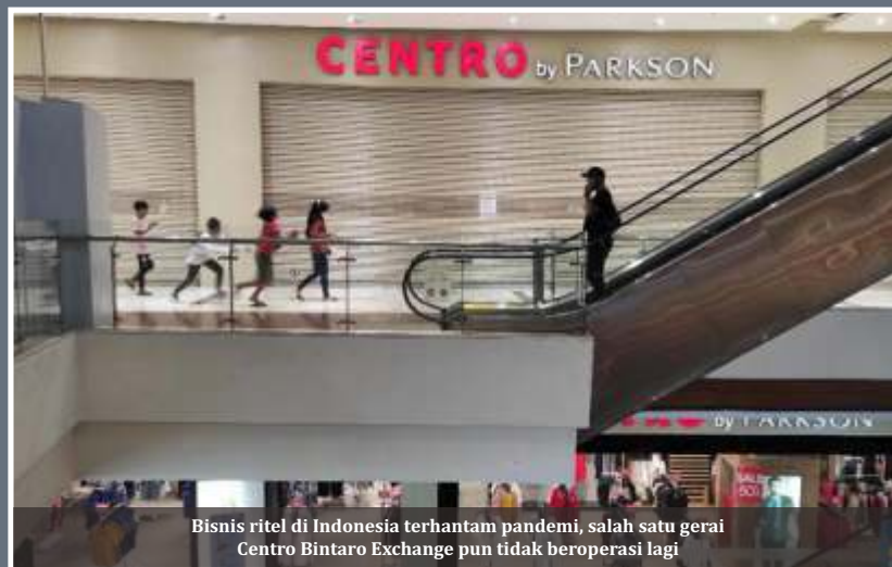
Bisnis ritel di Indonesia terhantam pandemi, salah satu gerai Centro Bintaro Exchange pun tidak beroperasi lagi

Struktur pertumbuhan ritel modern diperkirakan tidak akan banyak berubah dibandingkan dengan