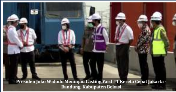
Presiden Joko Widodo Meninjau Casting Yard #1 Kereta Cepat Jakarta - Bandung, Kabupaten Bekasi

Jakarta - Presiden Joko Widodo (Jokowi) membuka kemungkinan untuk memperpanjang rute kereta cepat tidak hanya melalui jalur Jakarta - Bandung, melainkan juga sampai Surabaya. Saat ini sendiri, progres pembangunan proyek kereta cepat Jakarta-Bandung sudah selesai 73 persen. Setelah itu, diharapkan bisa diuji coba pada akhir 2022.