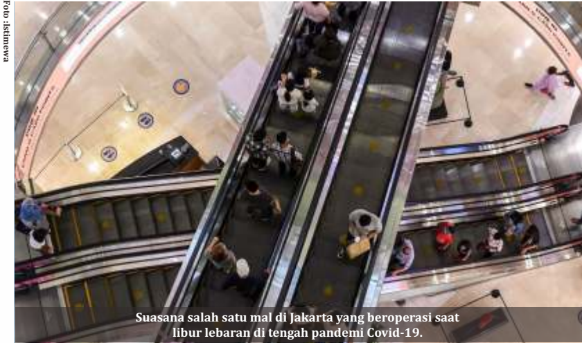
Suasana salah satu mal di Jakarta yang beroperasi saat libur lebaran di tengah pandemi Covid-19.

Jakarta - Menteri Kesehatan RI Budi Gunadi Sadikin menyebut ada beberapa daerah yang sengaja memperkecil jumlah tes Corona harian agar temuan kasus di wilayahnya sedikit sehingga masuk ke zona hijau atau daerah risiko rendah COVID-19.