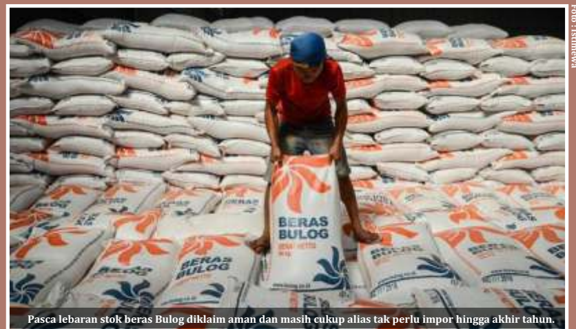
Pasca lebaran stok beras Bulog diklaim aman dan masih cukup alias tak perlu impor hingga akhir tahun.

Buwas mengaku sudah berkirim surat sebanyak tiga kali ke menteri terkait penanganan CBP tersebut, namun lagi-lagi belum mendapat jawaban yang pasti terkait penanganan 412 ribu ton beras. "Sebenarnya ini sudah keputusan secara lisan Pak Presiden Jokowi menyampaikan segera ditangani, beliau setuju dijual lebih murah. Tapi kemarin jadi persoalan negara harus mengeluarkan selisih harga itu, kurang lebih Rp 740