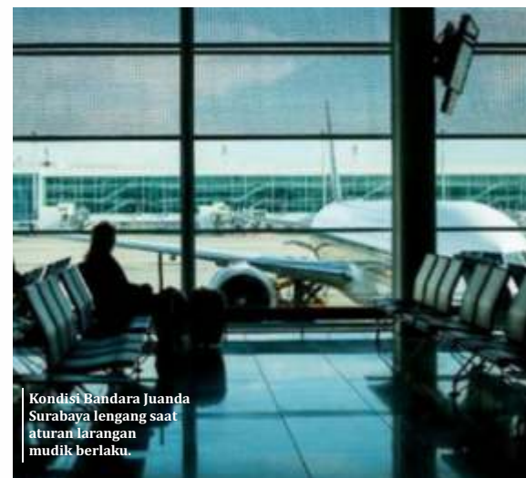
Kondisi Bandara Juanda Surabaya lengang saat aturan larangan mudik berlaku.

Saat ini, PT. KAI kembali mengoperasikan 144 KA jarak jauh pasca larangan mudik (18-24 Mei 2021). Sedangkan yang beroperasi melalui wilayah Daop 7 Madiun terdapat 14 KA. Diantaranya KA Bima, Gajayana, Sritanjung, Kahuripan, Logawa, Ranggajati, Argo Wilis, KLB Pasundan, Wijayakusuma, Matarmaja, Gaya Baru Malam Selatan, Bangunkarta, Mutiara Timur dan Kertanegara. (ist,ger)