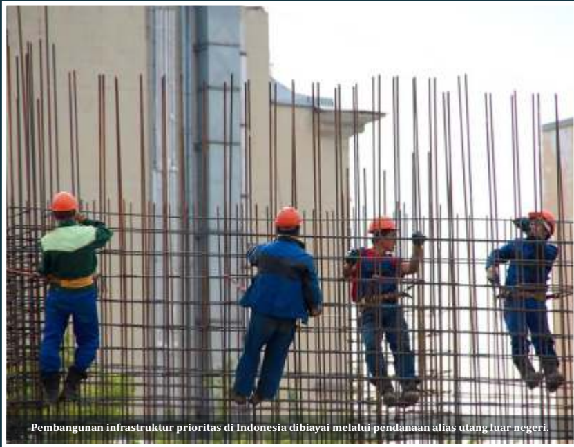
Pembangunan infrastruktur prioritas di Indonesia dibiayai melalui pendanaan alias utang luar negeri.

Jakarta – Falsafah Jawa 'eling lan waspada' yang mengajarkan untuk selalu ingat dan hati-hati wajib menjadi acuan pemerintah dalam mengelola keuangan terutama terkait utang negara. Kementerian Keuangan (Kemenkeu) mencatat total utang pemerintah pusat per April 2021 melonjak Rp 6.527,29 triliun. Angka itu naik Rp 82,22 triliun dibandingkan dengan akhir bulan sebelumnya yang sebesar Rp 6.445,07 triliun.