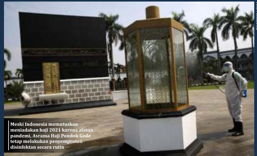
Meski Indonesia memutuskan meniadakan haji 2021 karena alasan pandemi, Asrama Haji Pondok Gede tetap melakukan penyemprotan disinfektan secara rutin

Dia mengatakan tak ada secuilpun uang jemaah yang digunakan untuk investasi ke sektor infrastruktur. "Tidak ada satupun atau tidak ada secuil dana pun yang diinvestasikan di sektor yang langsung termasuk infrastruktur, jadi memang belum ada langkah untuk membuat direct