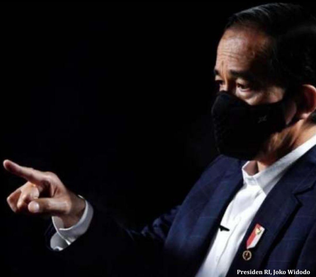
Presiden RI, Joko Widodo

Jakarta - Pandemi Covid-19 di Indonesia dan negara-negara di dubia belum bisa dipastikan kapan akan berakhir. Setidaknya, untuk tahun depan virus corona dipastikan menjadi tantangan yang harus diatasi.