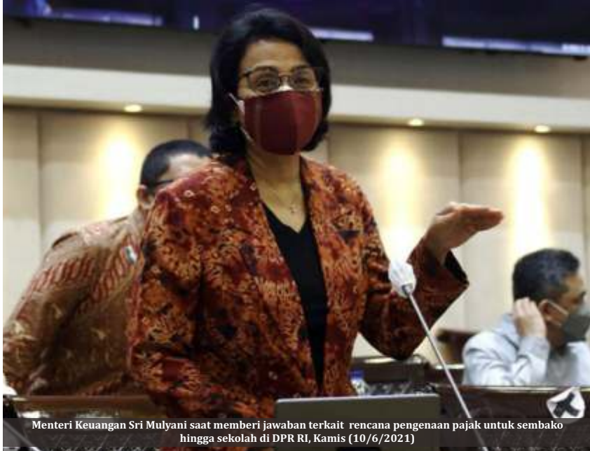
Menteri Keuangan Sri Mulyani saat memberi jawaban terkait rencana penerapan pajak untuk sembako hingga sekolah di DPR RI, Kamis (10/6/2021)

Jakarta- Pemerintah memberikan penjelasan terkait rencana pemungutan pajak pertambahan nilai (PPN) pada kebutuhan pokok hingga jasa pendidikan. Menteri Keuangan Sri Mulyani mengaku bingung untuk memberikan jawaban kepada publik. Sebab, secara etika politik seharusnya draf draf Perubahan Kelima Atas Undang-undang Nomor 6 Tahun 1983 tentang Ketentuan Umum dan Tata Cara Perpajakan (KUP) itu tidak bocor ke publik sebelum Presiden Joko Widodo (Jokowi) menyampaikan langsung ke DPR.