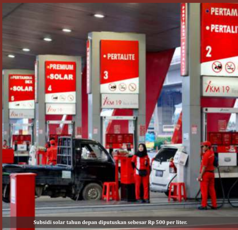
Subsidi solar tahun depan diputuskan sebesar Rp 500 per liter.

Jakarta - Rapat kerja antara Komisi VII dan Menteri ESDM Arifin Tasrif membahas asumsi dasar dan pagu indikatif Kementerian ESDM tahun 2022 menghasilkan dua kesimpulan. Kesimpulan rapat dibacakan Ketua Komisi VII Sugeng Suparwoto, Kamis (10/6).