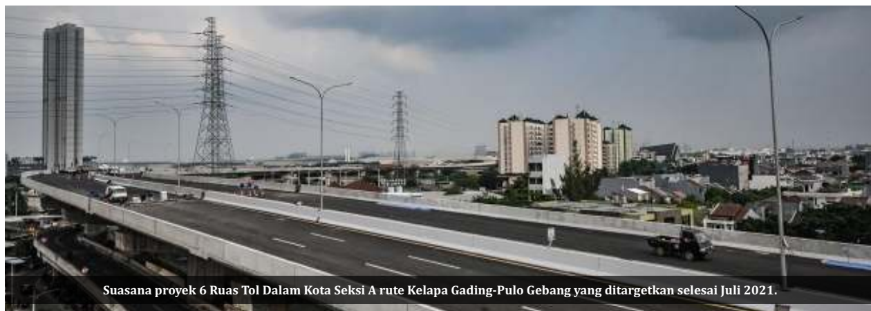
Suasana proyek 6 Ruas Tol Dalam Kota Seksi A rute Kelapa Gading-Pulo Gebang yang ditargetkan selesai Juli 2021.

bersama Menteri Keuangan dan Menteri PPN/Bappenas No S-361/MK.02/2021 dan B.238/M.PPM/D.8/PP.04.02/04/2021 per tanggal 29 April 2021, Pagu anggaran Kementerian PUPR tahun 2022 adalah sebesar Rp 100,46 triliun."Ini respons terhadap usulan kami sebesar Rp 176 triliun sebelumnya, yang meliputi kluster Kementerian Keuangan," jelas Basuki dalam Rapat Kerja dengan Komisi V DPR RI, Rabu (2/6).(ist)