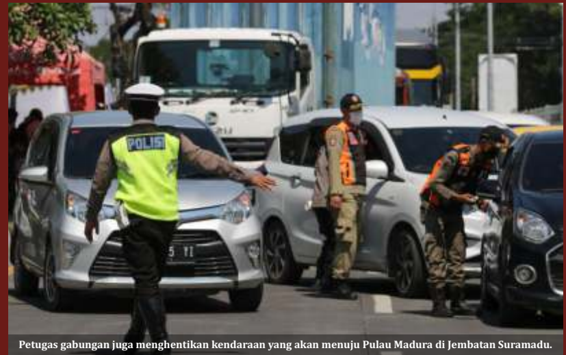
Petugas gabungan juga menghentikan kendaraan yang akan menuju Pulau Madura di Jembatan Suramadu.

Nantinya untuk proses pengembalian KTP atau SIM pihaknya sudah berikirim surat ke Dispendukcapil untuk dilakukan pemblokiran bagi yang menyerahkan KTP.