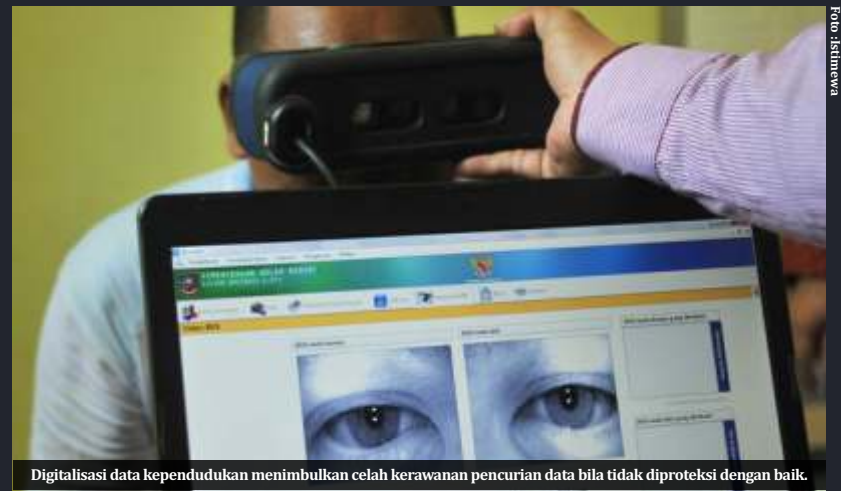
Digitalisasi data kependudukan menimbulkan celah kerawanan pencurian data bila tidak diproteksi dengan baik.

Sementara terkait kebocoran data kependudukan di Malang hingga Bogor, politikus PAN, Guspari Gaus, meminta aparat penegak hukum segera bertindak dalam menyikapi bocornya data kependudukan yang terjadi di sejumlah kabupaten/kota.