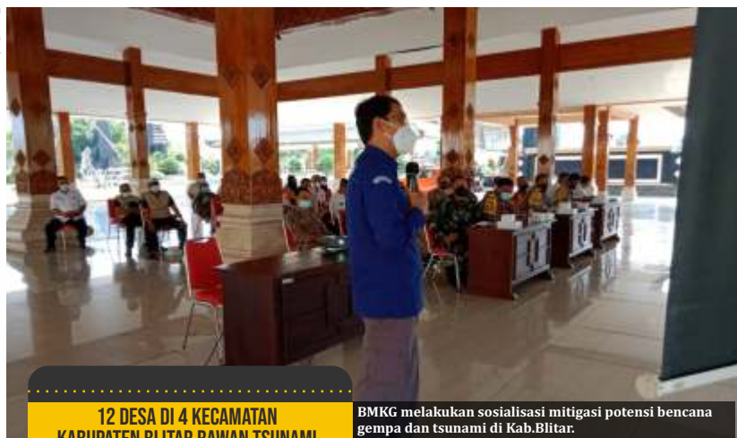
BMKG melakukan sosialisasi mitigasi potensi bencana gempa dan tsunami di Kab.Blitar.