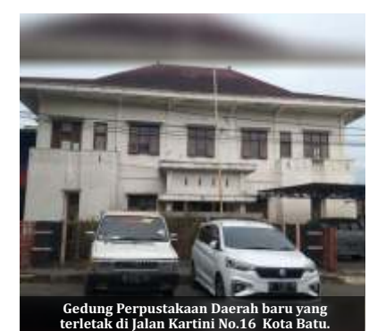
Gedung Perpustakaan Daerah baru yang terletak di Jalan Kartini No.16 Kota Batu.

Dengan anggaran dana sebesar Rp 1,9 milyar, Perpustakaan ini akan terealisasi dalam waktu dekat. "Target kita semua ini akan selesai pada bulan November 2021. Semoga cepat selesai dan bermanfaat bagi masyarakat," tutupnya. (ree)