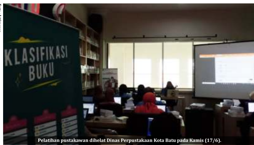
Pelatihan pustakawan dihelat Dinas Perpustakaan Kota Batu pada Kamis (17/6).

BATU- Dinas Perpustakaan Kota Batu membuat terobosan baru dengan membangun perpustakaan daerah pertama dengan konsep kekinian. Gedung yang rencananya launching pada November 2021 tidak hanya menyediakan buku dan ruang baca, tapi juga akan dilengkapi co-working space serta café.