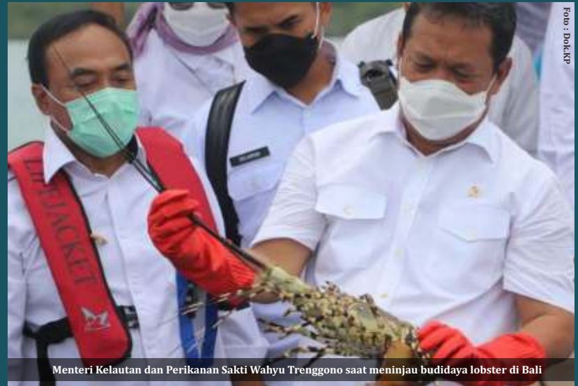
Menteri Kelautan dan Perikanan Sakti Wahyu Trenggono saat meninjau budidaya lobster di Bali

hanya menguntungkan negara tetangga terutama Vietnam yang membeli. Pasalnya mereka bisa mengembangkan budidaya dari hasil beli benih lobster Indonesia kemudian mengeksportnya ke negara lain dengan nilai lebih tinggi.