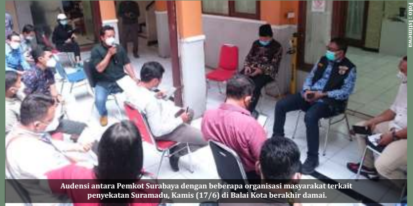
Audiensi antara Pemkot Surabaya dengan beberapa organisasi masyarakat terkait penyekatan Suramadu, Kamis (17/6) di Balai Kota berakhir damai.

"Saya juga berharap kerjasama ini tetap terjalin dengan baik ke depannya, sehingga ketika ada isu-isu bahwa ada diskriminasi terhadap warga Madura, tentu itu tidak ada. Sekali lagi, tidak ada diskriminasi kepada warga Madura, karena perlakuan yang sama juga dilakukan bagi warga yang akan berkunjung ke Madura, dilakukan tes swab yang sama di Surabaya," tegasnya saat meninjau penyekatan di Suramadu sisi Surabaya, Rabu (16/6) malam.