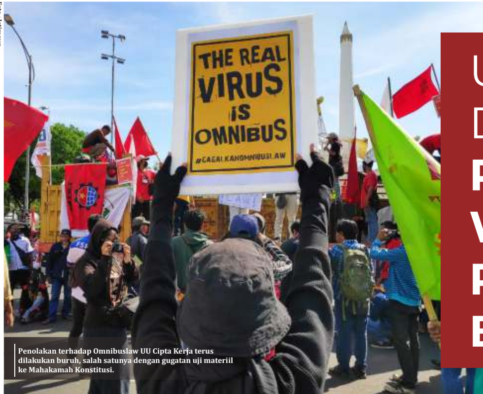
Penolakan terhadap Omnibuslaw UU Cipta Kerja terus dilakukan buruh, salah satunya dengan gugatan uji materil ke Mahkamah Konstitusi.