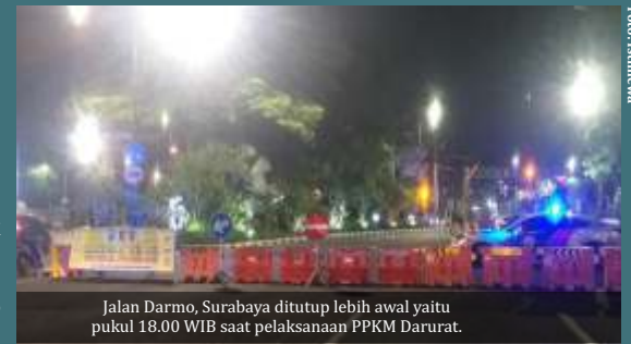
Jalan Darmo, Surabaya ditutup lebih awal yaitu pukul 18.00 WIB saat pelaksanaan PPKM Darurat.

Tak hanya itu, Khofifah mengingatkan masyarakat yang dari luar kota hendak melewati penyekatan tersebut, wajib membawa surat ke-terangan