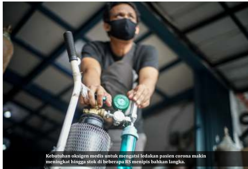
Kebutuhan oksigen medis untuk mengatasi ledakan pasien corona makin meningkat hingga stok di beberapa RS menipis bahkan langka.

Luhut meminta tabung oksigen bisa segera disediakan lebih cepat. Soal impor tabung oksigen pihaknya telah meminta kepada Kementerian