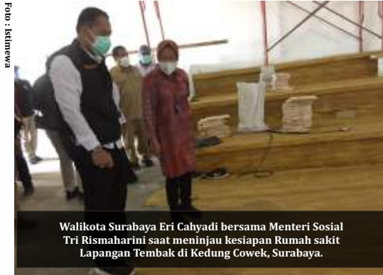
Walikota Surabaya Eri Cahyadi bersama Menteri Sosial Tri Rismaharini saat meninjau kesiapan Rumah sakit Lapangan Tembak di Kedung Cowek, Surabaya.

Jakarta- Kementerian Agama (Kemenag) mencatat, di 8 asrama haji yang ada di Indonesia hingga Senin (5/7) menampung 1.054 pasien Covid-19 yang menjalani isolasi mandiri. Asrama haji itu tersebar di wilayah Jakarta, Surabaya, Balikpapan, Semarang, Ambon, Di Yogyakarta, Gorontalo dan Lombok. Jumlah pasien di Kota Pahlawan lah yang terbanyak.