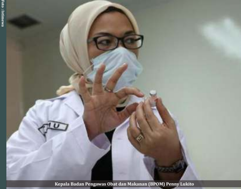
Kepala Badan Pengawas Obat dan Makanan (BPOM) Penny Lukito

Jakarta- Masyarakat Indonesia sedang ramai membicarakan ivermectin, obat keras untuk membunuh parasit seperti cacing dalam tubuh, sebagai obat Covid-19. Namun nama obat tersebut tidak ada dalam daftar 12 obat sudah dapat izin dari BPOM. Kok?