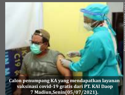
Calon penumpang KA yang mendapatkan layanan vaksinasi covid-19 gratis dari PT. KAI Daop 7 Madiun, Senin (05/07/2021).

Masalah lain terdapat pada tenaga medis yang dimiliki PT. INKA sangat terbatas. Sehingga perusahaan perlu merekrut tenaga kesehatan untuk mengoptimalkan layanan. "Selama 4 bulan pertama operasional EMT sangat terbantu oleh tenaga medis dari Dinas Kesehatan Madiun dengan biaya operasional ditanggung oleh PT INKA