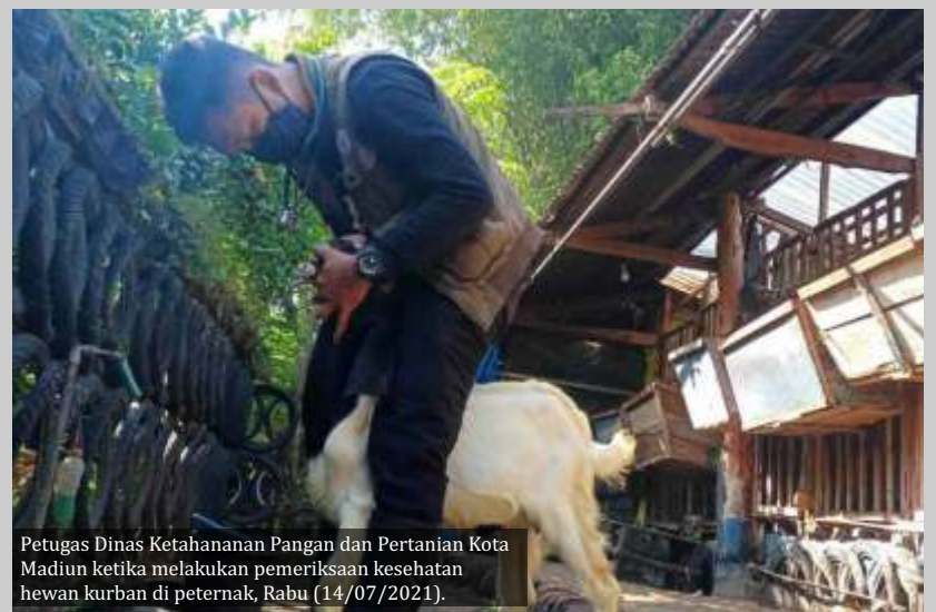
Petugas Dinas Ketahanan Pangan dan Pertanian Kota Madiun ketika melakukan pemeriksaan kesehatan hewan kurban di peternak, Rabu (14/07/2021).

Penjualan hewan kurban juga dilakukan secara terbatas. Yakni