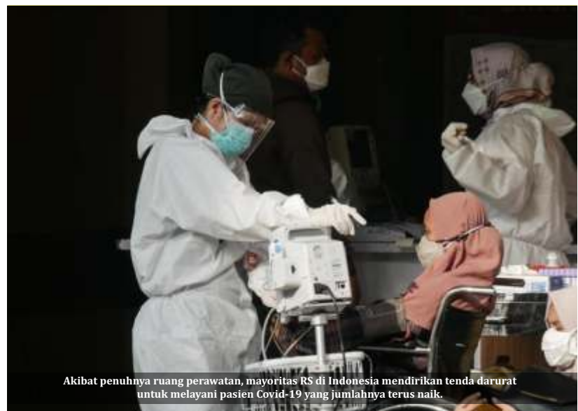
Akibat penuhnya ruang perawatan, mayoritas RS di Indonesia mendirikan tenda darurat untuk melayani pasien Covid-19 yang jumlahnya terus naik.

Terpisah, pengamat politik dari Universitas Al Azhar Indonesia Ujang Komaruddin, pernyataan-pernyataan