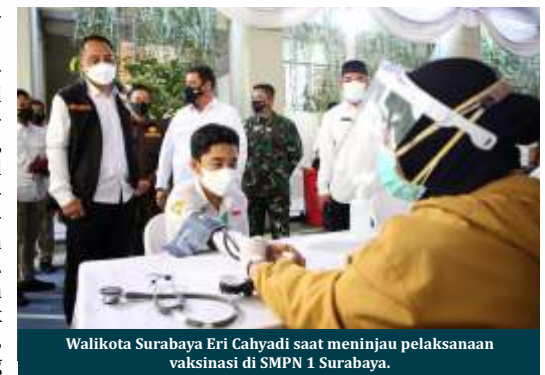
Walikota Surabaya Eri Cahyadi saat meninjau pelaksanaan vaksinasi di SMPN 1 Surabaya.

Kegiatan ini, kata Eri, tidak hanya dilaksanakan di wilayah jatim saja. Tapi juga di 14 wilayah yang notabene sebagai episentrum Covid-19. Menurutnya, dari awal pandemi sudah