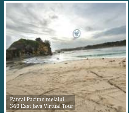
Pantai Pacitan melalui 360 East Java Virtual Tour

Disbudpar Jatim berharap website wisata virtual mendorong content creator lokal maupun global dalam ekspos kreatif potensi pariwisata di Jawa Timur.(adv)