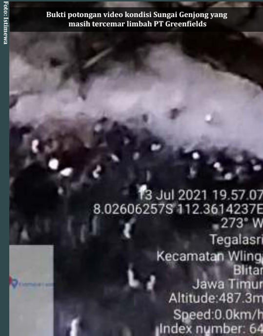
Bukti potongan video kondisi Sungai Genjong yang masih tercemar limbah PT Greenfields