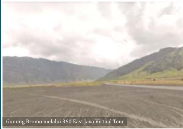
Gunung Bromo melalui 360 East Java Virtual Tour