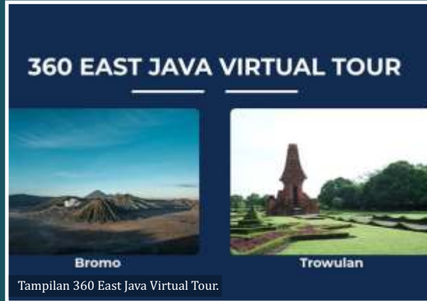
Tampilan 360 East Java Virtual Tour.

S urabaya-Ingin melihat pemandangan alam indah atau mengunjungi candi - candi di Jawa Timur saat PPKM Darurat? Jangan bingung, berwisata sekarang bisa dilakukan dengan mudah karena Dinas Kebudayaan dan Pariwisata Jawa Timur (Disbudpar Jatim) telah menyiapkan website wisata virtual.f.