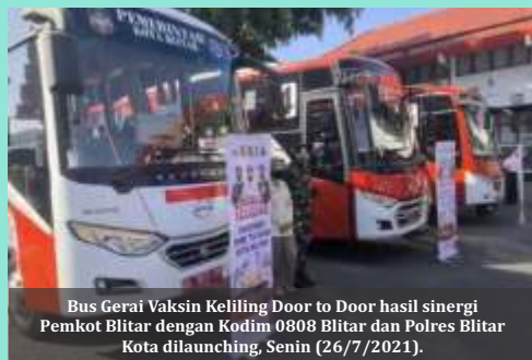
Bus Gerai Vaksin Keliling Door to Door hasil sinergi Pemkot Blitar dengan Kodim 0808 Blitar dan Polres Blitar Kota diluncurkan, Senin (26/7/2021).

B LITAR (Lenteratoday) - Guna mempercepat terwujudnya Herd Immunity atau kekebalan kelompok di Kota Blitar, Pemkot bekerjasama dengan TNI-Polri yaitu Kodim 0808 Blitar dan Polres Blitar Kota menyulap Bus Sekolah menjadi Gerai Vaksin Keliling. Ada 3 unit bus yang akan 'door to door' memberikan pelayanan suntik vaksin ke warga.