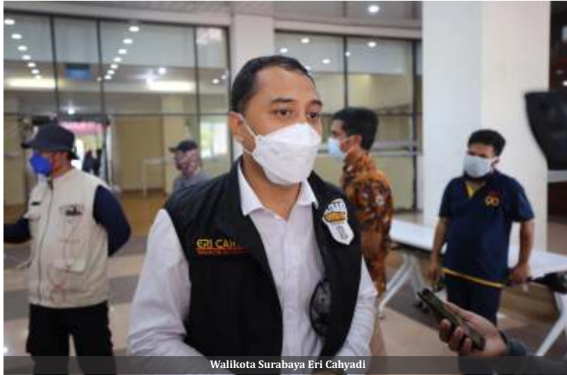
Walikota Surabaya Eri Cahyadi

S urabaya-PPKM Darurat yang digeber 5-25 Juli 2021 diklaim Walikota Surabaya Eri Cahyadi menekan angka kematian akibat Covid-19 hingga separuh lebih. Menurut catatan, untuk kasus kematian yang dimakamkan dengan standar protokol kesehatan saat ini sudah di bawah 100 orang. Jumlah itu jauh menurun dibanding sebelum diterapkan pembatasan.