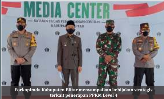
Forkopimda Kabupaten Blitar menyampaikan kebijakan strategis terkait penerapan PPKM Level 4

B LITAR (Lenteratoday) - Setelah ditetapkan masuk PPKM Level 4 oleh pemerintah pusat periode 26 Juli - 2 Agustus 2021, Pemerintah Kabupaten (Pemkab) Blitar bersama Forkopimda mengambil langkah cepat dengan menyiapkan beberapa kebijakan strategis.