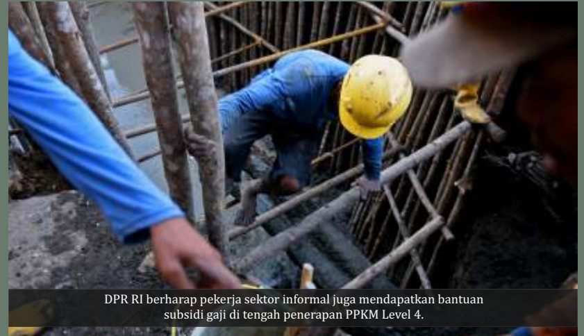
DPR RI berharap pekerja sektor informal juga mendapatkan bantuan subsidi gaji di tengah penerapan PPKM Level 4.

Selain subsidi upah, pemerintah juga akan menambah pencairan bantuan sosial (bansos) selama perpanjangan PPKM, terutama yang menerapkan PPKM Level 4. Salah satunya adalah penambahan bantuan kartu sembako senilai Rp200.000 selama 2 bulan kepada para penerima