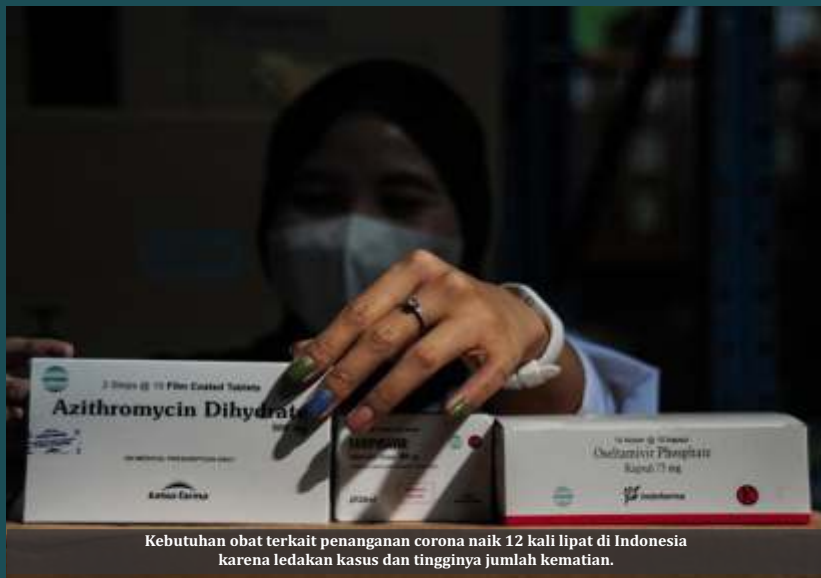
Kebutuhan obat terkait penanganan corona naik 12 kali lipat di Indonesia karena ledakan kasus dan tingginya jumlah kematian.

Jakarta- Jangan bahagia dulu dengan pengumuman penurunan kasus beberapa hari ini. Sebab, hal ini terjadi seiring dengan rendahnya tingkat testing. Ironisnya, pada Senin (26/7) saat testing dan infeksi sedikit, jumlah kematian masih melejit.