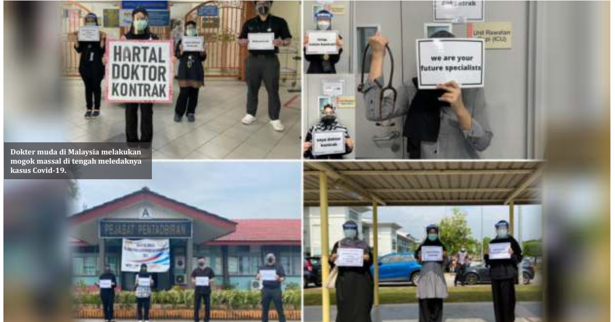
Dokter muda di Malaysia melakukan mogok massal di tengah meledaknya kasus Covid-19.

Pada Senin (26/7), Parlemen Malaysia akhirnya mengadakan sidang pertama setelah vakum selama tujuh bulan, karena penetapan status