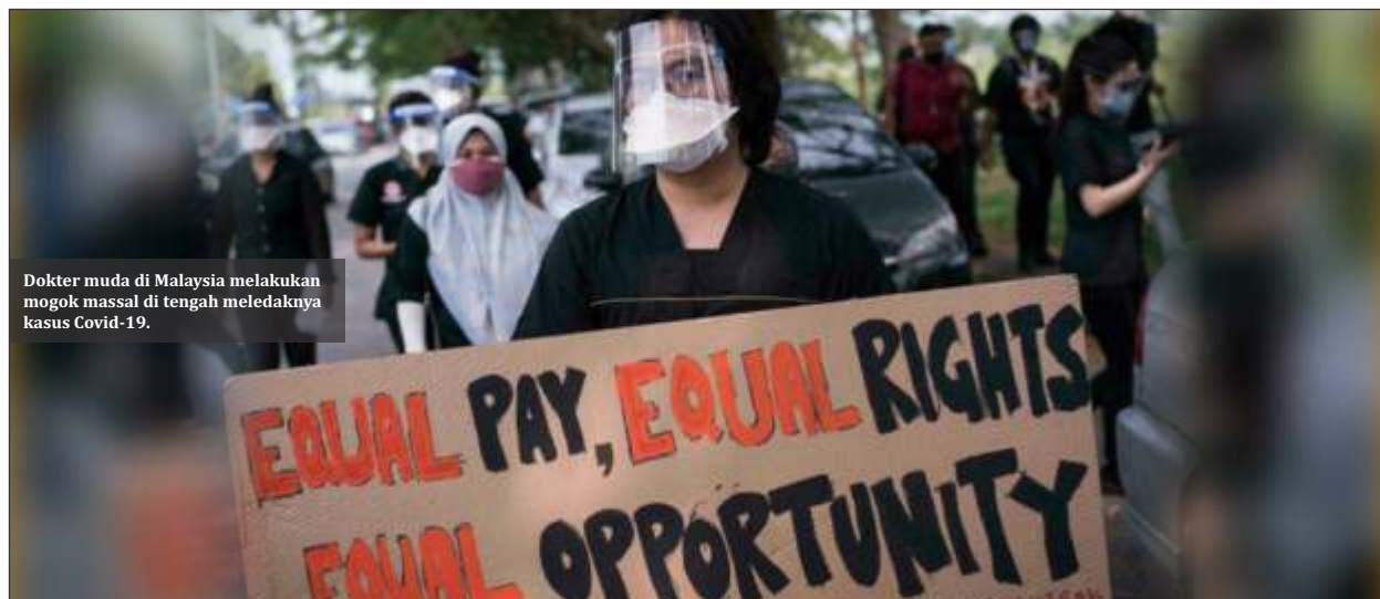
Dokter muda di Malaysia melakukan mogok massal di tengah meledaknya kasus Covid-19.

Muhyiddin akan memberi penjelasan singkat kepada parlemen tentang tanggapan pemerintahnya terhadap Covid-19. Dilaporkan juga "rencana pemulihan nasional" empat fase, yang diresmikan pada Juni. Muhyiddin akan didampingi oleh menteri lain, termasuk mereka yang bertanggung jawab atas ekonomi dan program vaksinasi. Anggota parlemen Malaysia akan memiliki kesempatan untuk menguji para menteri. Keadaan darurat tidak hanya menangguhkan urusan parlemen, tetapi juga mengizinkan aturan berdasarkan keputusan pemerintah. (ist)