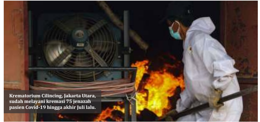
Krematorium Cilincing, Jakarta Utara, sudah melayani kremasi 75 jenazah pasien Covid-19 hingga akhir Juli lalu.

Dari jumlah tersebut, 518.310 merupakan kasus aktif. Kasus aktif artinya pasien yang masih dirawat akibat Corona. Kabar baiknya, hari ini