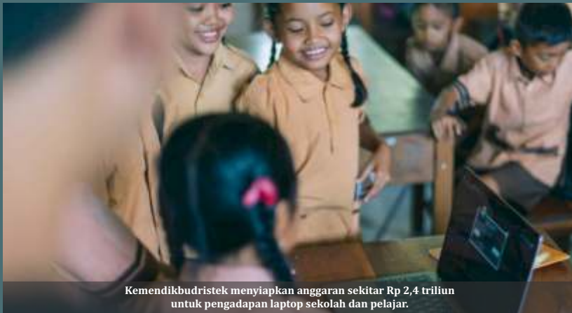
Kemendikbudristek menyiapkan anggaran sekitar Rp 2,4 triliun untuk pengadaan laptop sekolah dan pelajar.

Jakarta - Rencana program Laptop Merah Putih Kementerian Pendidikan, Kebudayaan, Riset, dan Teknologi (Kemendikbudristek) dikritisi oleh berbagai pihak. Bahkan DPR juga memberikan berbagai catatan penting agar rencana digitalisasi sektor pendidikan tersebut tak gagal dan sia-sia. Salah satu sorotan paling tajam terhadap rencana pengadaan sebesar Rp 2,4 triliun itu adalah spesifikasi dinilai tak memadai dan harganya terlalu mahal.