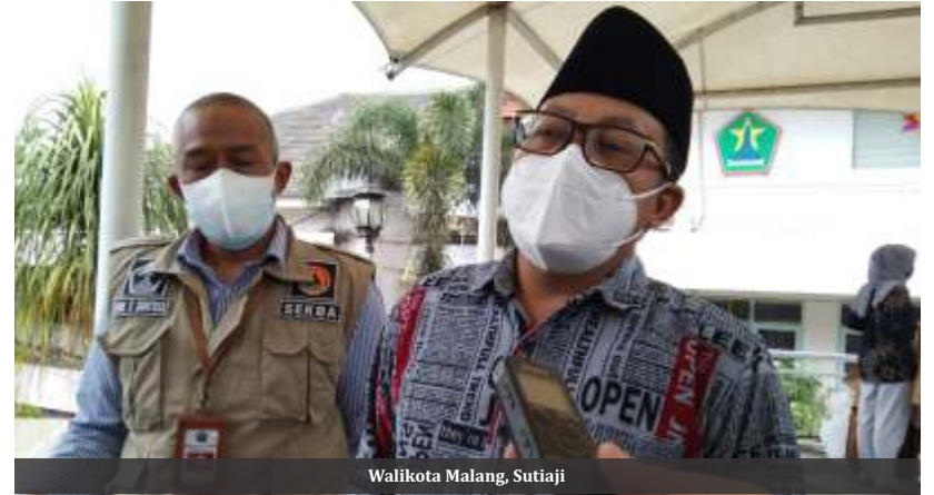
Walikota Malang, Sutiaji

Sejauh ini, Politikus Partai Demokrat itu menuturkan bahwa banyak di antara aset itu memiliki izin penggunaan. "Ada izin penggunaannya surat-suratnya juga banyak, makanya kami harus cek lagi ke BPN, BKAD, intinya banyak yang harus dilakukan