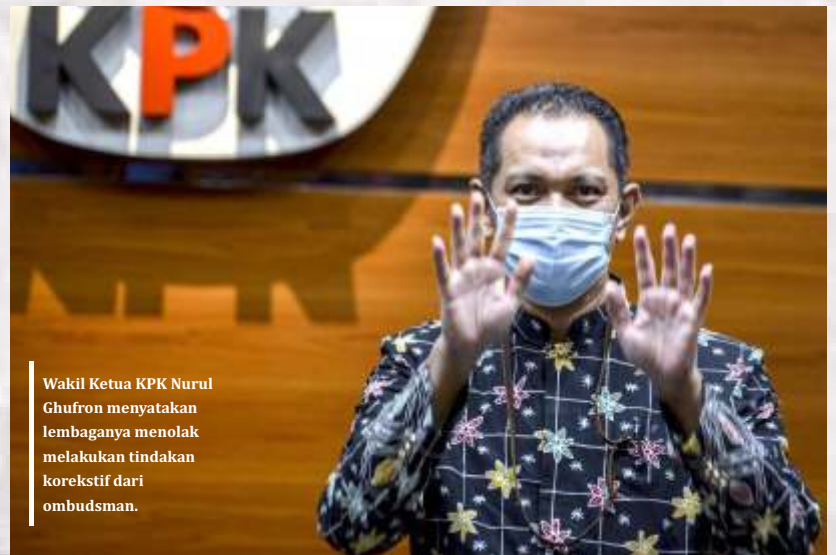
Wakil Ketua KPK Nurul Ghufron menyatakan lembaganya menolak melakukan tindakan korektif dari ombudsman.

"UU 37/2008 tentang Ombudsman RI pasal 9 dan 36 menyatakan dalam melaksanakan kewenangannya Ombudsman dilarang mencampuri kebebasan hakim dalam berikan putusan, selanjutnya pasal 36 ayat 1 menyatakan Ombudsman RI menolak laporan sebagaimana dalam pasal 35