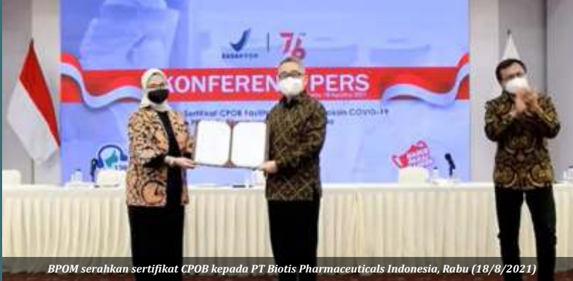
B POM serahkan sertifikat CPOB kepada PT Biotis Pharmaceuticals Indonesia, Rabu (18/8/2021)

Jakarta-PT Biotis Pharmaceuticals Indonesia menjadi fasilitator produksi Vaksin Merah Putih buatan Universitas Airlangga (Unair). Badan Pengawas Obat dan Makanan (BPOM) menyerahkan sertifikat Cara Pembuatan Obat yang Baik (CPOB) kepada perusahaan pada hari ini, Rabu (18/8).