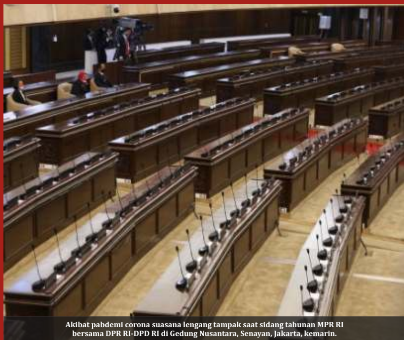
Akibat pabdemi corona suasana lengang tampak saat sidang tahunan MPR RI bersama DPR RI-DPRD RI di Gedung Nusantara, Senayan, Jakarta, kemarin.

JAKARTA - Sejatinnya kewajiban melaporkan Laporan Harta Kekayaan Negara (LHKPN) yang dikenakan kepada penyelenggara negara, termasuk para anggota DPR, merupakan upaya dukungan terhadap pemberantasan korupsi. Mirisnya menurut data Komisi Pemberantasan Korupsi (KPK), bahwa tingkat kepatuhan penyerahan pejabat legislatif menurun drastis sepanjang Semester I 2021.