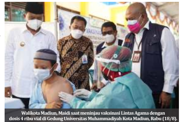
Walikota Madiun, Madiun saat meninjau vaksinasi Lintas Agama dengan dosis 4 ribu vial di Gedung Universitas Muhammadiyah Kota Madiun, Rabu (18/8).

kewajibkan, tapi juga termasuk kebutuhan. "Saya sudah pernah kena. Tidak enak sekali rasanya. Untuk itu proses penting meski sudah divaksin," tutupnya. (Ger)