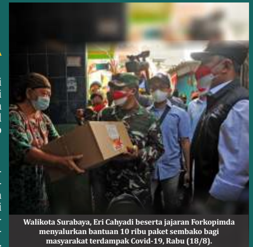
Walikota Surabaya, Eri Cahyadi beserta jajaran Forkopimda menyalurkan bantuan 10 ribu paket sembako bagi masyarakat terdampak Covid-19, Rabu (18/8).

Eri meminta, bagi warga yang merasa berhak menerima atau ada tetangga yang layak, bisa dilaporkan ke aplikasi Wargaku atau bisa langsung disampaikan kepada Lurah, RT dan RW. Eri menegaskan bantuan ini adalah bagi warga yang tidak menerima bantuan dari Kementerian Sosial baik Bantuan Sosial Tunia (BST) atau Program Keluarga Harapan (PKH).