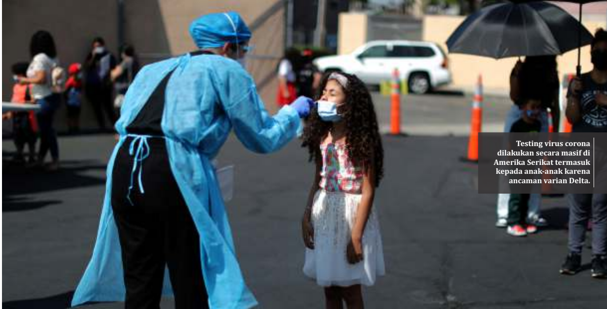
Testing virus corona dilakukan secara masif di Amerika Serikat termasuk kepada anak-anak karena ancaman varian Delta.

Washington- Lonjakan kasus corona di Amerika Serikat (AS) mengejutkan semua pihak yaitu mencapai 1.000 persen. Fasilitas kesehatan (faskes) di negara itu pun mulai menunjukkan tanda-tanda kewalahan. Para ahli pun mengatakan ini merupakan 'ronde keempat' pandemi di negaranya.