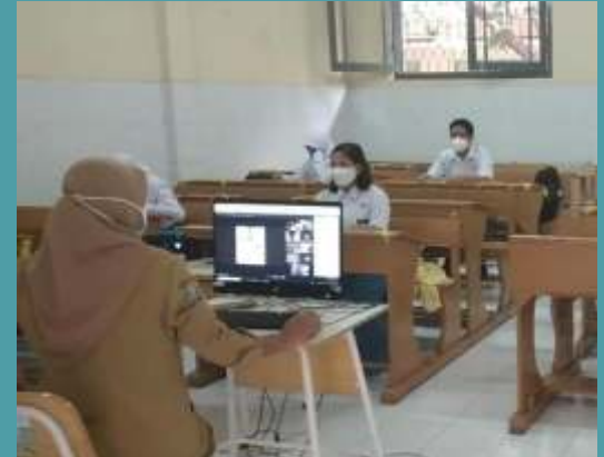
Pembelajaran tatap muka (PTM) terbatas di SMAN 5 Surabaya, mulai dilakukan pada Senin (30/8/2021).

Sejumlah sekolah pun sudah mulai PTM Senin (30/8). Salah satunya, SMA Negeri 5, Kecamatan Genteng, Kota Surabaya. Para murid terlebih dahulu