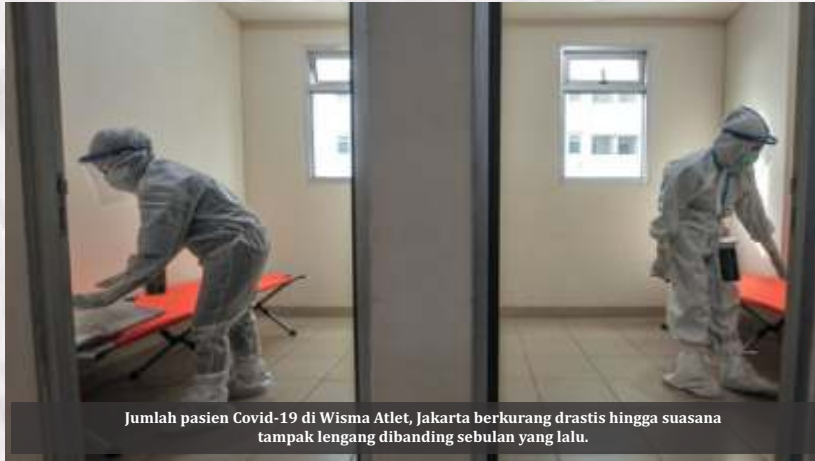
Jumlah pasien Covid-19 di Wisma Atlet, Jakarta berkurang drastis hingga suasana tampak lengang dibanding sebulan yang lalu.

Jakarta-Presiden Joko Widodo atau Jokowi mengumumkan bahwa kondisi pandemi Covid-19 di wilayah Jawa-Bali dan luar Jawa-Bali sudah mulai membaik. Sejumlah daerah turun dari level asesmen 4 menjadi level 3. Dengan demikian, daerah yang ditetapkan Level 3 juga semakin banyak. Meski demikian, kebijakan Pemberlakuan Pembatasan Kegiatan Masyarakat (PPKM) dilanjutkan hingga 6 September 2021.