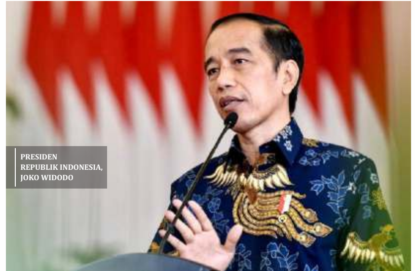
PRESIDEN REPUBLIK INDONESIA, JOKO WIDODO

e. masa jabatan lebih dari 4 (empat) tahun sampai dengan 5 (lima) tahun sebesar 1 x uang penghargaan.