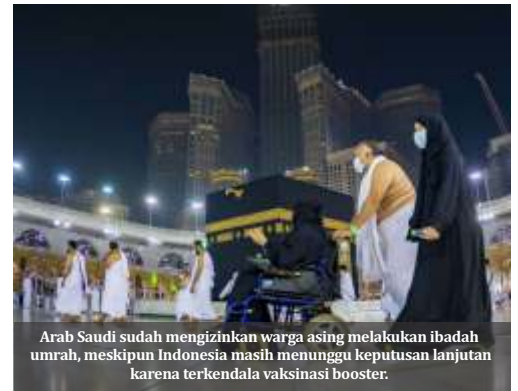
Arab Saudi sudah mengizinkan warga asing melakukan ibadah umroh, meskipun Indonesia masih menunggu keputusan lanjutan karena terkendala vaksinasi booster.

Indonesia belum menerima pemberitahuan secara resmi dari pemerintah Kerajaan Arab Saudi terkait penyelenggaraan ibadah umroh 1443 Hijriah ini," sambungnya menjelaskan.