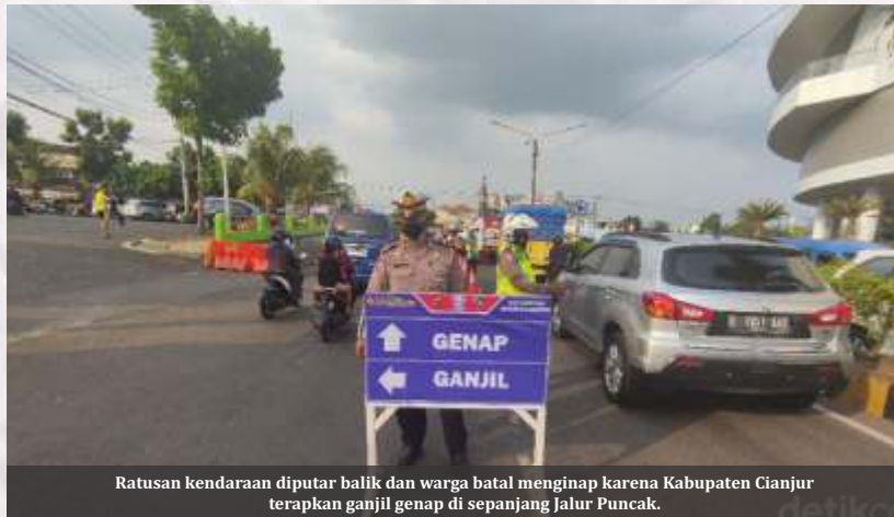
Ratusan kendaraan diputar balik dan warga batal menginap karena Kabupaten Cianjur terapkan ganjil genap di sepanjang Jalur Puncak.

Jakarta- Euforia meredanya kasus corona tampak dari menggeliatnya mobilitas warga di mayoritas kota-kota tanah air. Tak sekadar bekerja, di weekend pekan ini jalur-jalur wisata penuh sesak kendaraan. Pakar pun mengingatkan ancaman gelombang 3 Covid-19 bila tidak adaantisipasi dari pemerintah maupun kesadaran warga sendiri.