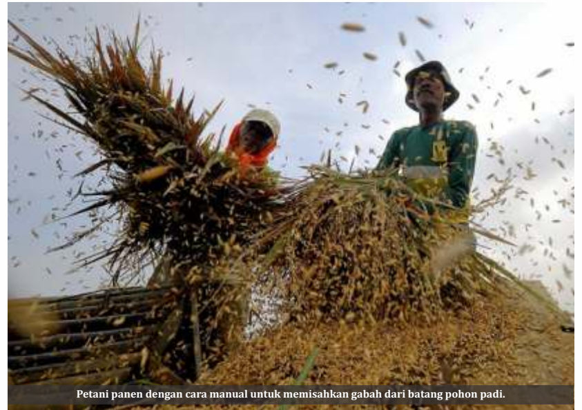
Petani panen dengan cara manual untuk memisahkan gabah dari batang pohon padi.

Para ekonom menilai proyeksi ekonomi di kuartal III-2021 dipastikan turun meski ada sejumlah aturan baru yang mengarah pada relaksasi. Penurunan tersebut terjadi, dibandingkan dengan kuartal II-2021 yang sukses menembus angka 7,07%.