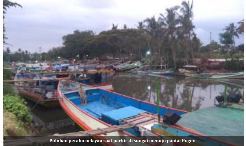
Puluhan perahu nelayan saat parkir di sungai menuju pantai Puger.

"Kami berharap Pemkab Jember bisa memberikan solusi atas kelangkaan solar yang dialami ribuan nelayan di Puger. Sebab solar ini merupakan bahan bakar perahu untuk mendapatkan ikan di laut satu-satunya penghasilan bagi para nelayan," ujar-nya.