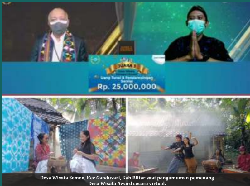
Desa Wisata Semen, Kec Gandusari, Kab Blitar saat pengumuman pemenang Desa Wisata Award secara virtual.

B LITAR -Warga Desa Semen, Kabupaten Blitar berhasil menunjukkan kreatifitasnya dengan mengemas kearifan lokal menjadi magnet yang menarik wisatawan. Tak heran bila kemudian destinasi wisata tersebut dinobatkan menjadi salah satu juara Desa Wisata Award 2021.