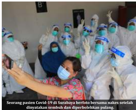
Seorang pasien Covid-19 di Surabaya berfoto bersama nakes setelah dinyatakan sembuh dan diperbolehkan pulang.

Kemudian Tracing Rasio dari Kemenkes RI 18,16 persen per tanggal, 2 September 2021 kemarin. Selanjutnya, Bed Occupancy Rate (BOR) juga bertambah 18,16 persen. "Kalau BOR di Kota Surabaya total kumulatifnya sudah 24 persen, per tanggal 3 September 2021. Lalu isolasi biasa