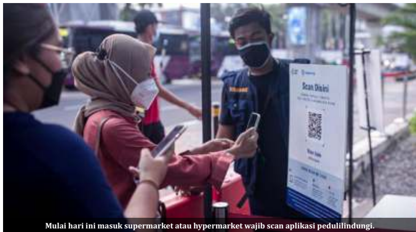
Mulai hari ini masuk supermarket atau hypermarket wajib scan aplikasi pedulilindungi.

Jakarta - Pandemi Covid-19 di Indonesia semakin mereda. Meski demikian, pemerintah kembali melakukan perpanjangan kebijakan Pemberlakuan Pembatasan Kegiatan Masyarakat (PPKM) per level di Jawa-Bali. PPKM ini berlaku sampai 20 September 2021.