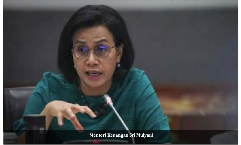
Menteri Keuangan Sri Mulyani

"Jenis program di daerah itu bisa mencapai jumlahnya 29.623. Kalau program dipecah jadi kegiatan menjadi 263.135. Kita bisa bayangkan ini yang disebut diecer-ecer itu seperti ini, pokoknya kecil-kecil semuanya dapat