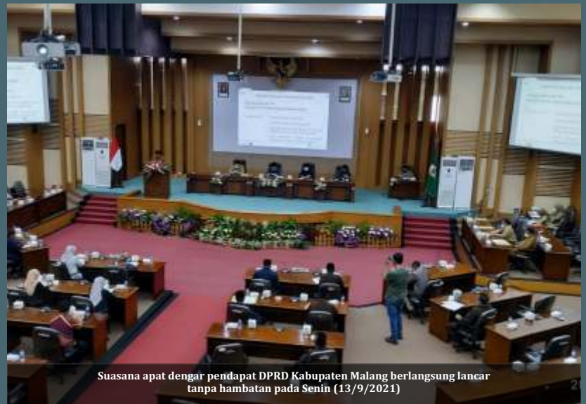
Suasana apat dengar pendapat DPRD Kabupaten Malang berlangsung lancar tanpa hambatan pada Senin (13/9/2021)