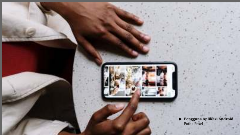
► Pengguna Aplikasi Android

Bahkan bukan hanya 8 aplikasi itu aja, Trend Micro melaporkan ada lebih dari 120 aplikasi penambangan cryptocurrency palsu yang tersedia.