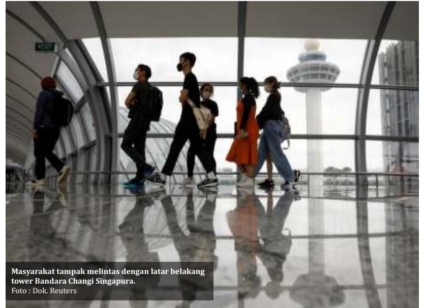
Masyarakat tampak melintas dengan latar belakang tower Bandara Changi Singapura.

Indonesia kembali menjadi sorotan publik setelah sebuah media asing asal Jepang merilis data 'COVID-19 Recovery Index'. Per 31 September lalu, Indonesia menduduki peringkat