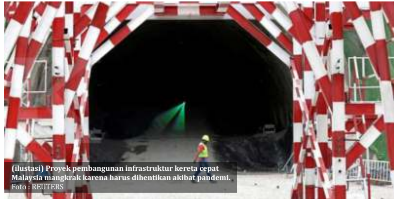
(ilustrasi) Proyek pembangunan infrastruktur kereta cepat Malaysia mangkrak karena harus dihentikan akibat pandemi.

Ekonom Center of Reform of Economics (CORE), Yusuf Rendi Manilet menyatakan masuknya proyek