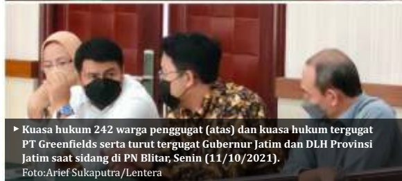
► Kuasa hukum 242 warga penggugat (atas) dan kuasa hukum tergugat PT Greenfields serta turut tergugat Gubernur Jatim dan DLH Provinsi Jatim saat sidang di PN Blitar, Senin (11/10/2021).

Kuasa hukum tergugat PT Greenfields, Jhon Micharl Amalu Sipet minta waktu 2 minggu. Oleh hakim dikabulkan pada 25 Oktober 2021, dengan syarat hanya untuk jawaban