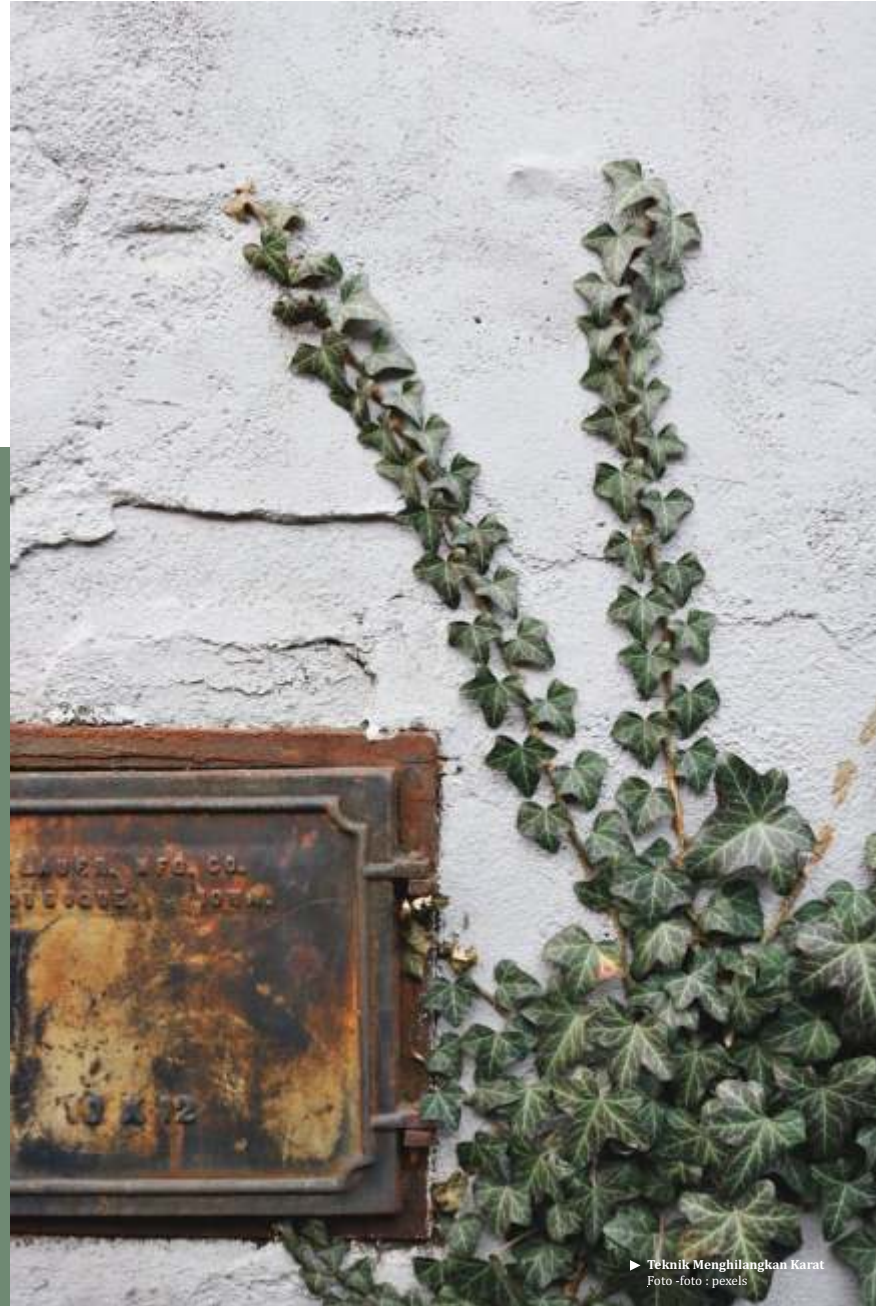
► Teknik Menghilangkan Karat Foto - foto - pexels