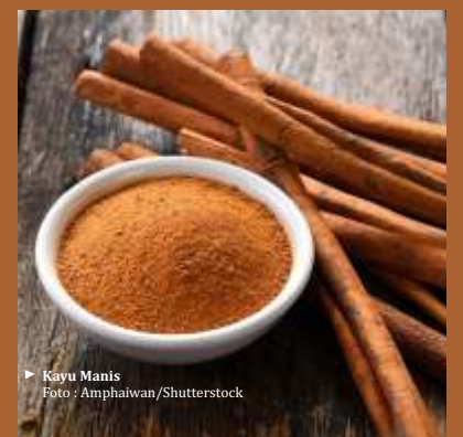
► Kayu Manis

Caranya, buatlah campuran pasta dari bubuk kayu manis, yoghurt, pisang matang, dan jus lemon. Oleskan pasta ini di wajah. Diamkan sampai wajah terasa kering. Kemudian, cuci wajah dengan air hangat. (berbagai sumber/dya)