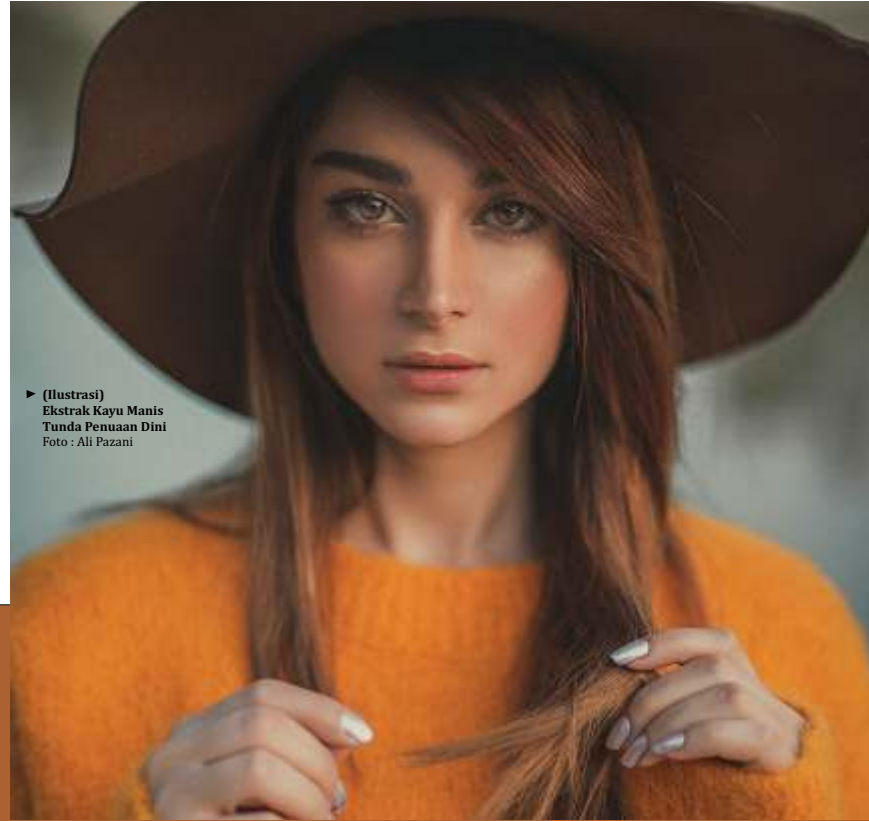
► (Ilustrasi) Ekstrak Kayu Manis Tunda Penuaan Dini

Peneliti lulusan The University of Toledo, Ohio, USA juga menyebutkan, kulit yang tak sehat ditandai dengan kulit meradang atau inflamasi, kemerahan, tekstur kulit tidak merata, bintik hitam, dan keriput. Ekstrak kayu manis bisa membantu meredakan masalah pada kulit. Nantinya akan diterapkan menjadi kosmetik yang aman digunakan. (isti/dya)