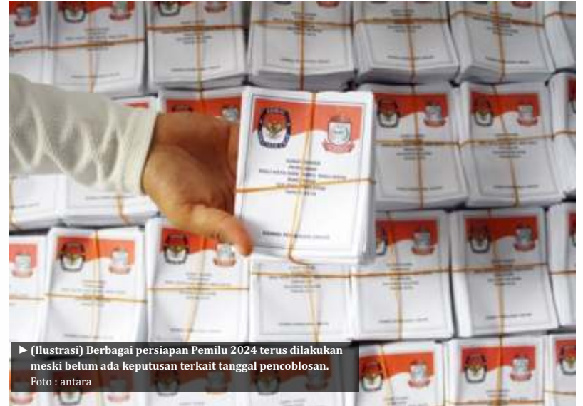
► (Ilustrasi) Berbagai persiapan Pemilu 2024 terus dilakukan meski belum ada keputusan terkait tanggal pencoblosan.

Dia menambahkan, pemerintah paling berperan dalam menentukan mutu komisioner KPU dan Bawaslu ke