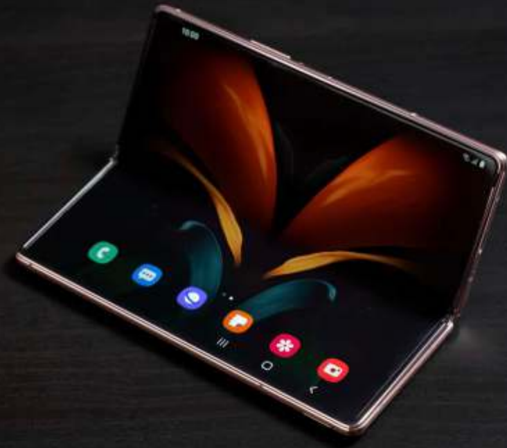
► Google Pixel Fold

Yaitu misalnya untuk pengembangan dari sisi software, seperti pengembangan fungsi multitasking di Android untuk ponsel foldable. Namun tetap saja, kemunculannya memperlihatkan keseriusan Google untuk