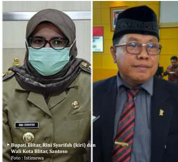
▶ Bupati Blitar, Rini Syarifah (kiri) dan Wali Kota Blitar, Santoso

Sesuai dengan pengumuman yang disampaikan melalui flyer medsos Pemkab Blitar, untuk vaksinasi di depan Kantor Bupati Blitar di Kanigoro disiapkan 6.000 dosis dan sisanya 24.000 dosis tersebar di beberapa puskesmas kecuali Kanigoro. Khusus di Kabupaten Blitar, setiap orang yang vaksin akan mendapatkan paket telur