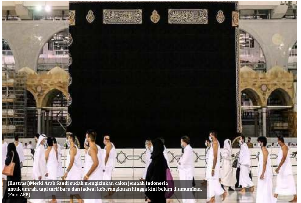
(Ilustrasi) Meski Arab Saudi sudah mengizinkan calon jemaah Indonesia untuk umrah, tapi tarif baru dan jadwal keberangkatan hingga kini belum diumumkan.

Sebelumnya, biaya umrah itu diperkirakan naik 15 persen sampai 25 persen karena kebijakan baru di tengah pandemi Covid-19. Kenaikan biaya umrah itu di luar kewajiban calon jemaah untuk melakukan tes PCR dan karantina yang diberlakukan,