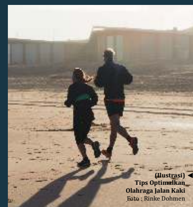
► (Ilustrasi) Tips Optimalkan Olahraga Jalan Kaki

bisa diubah menjadi beberapa jenis meditasi. Misalnya saja berjalan dengan rute yang sama atau memblokir dunia luar dengan musik. Menurut Survei Wawancara Kesehatan Nasional 2017, yang diterbitkan oleh National Institutes of Health, praktik meditasi sedang meningkat untuk alasan yang baik. Meditasi terbukti dapat mengatur peradangan, ritme sirkadian, dan metabolisme glukosa, serta menurunkan tekanan darah. (isti/dya)