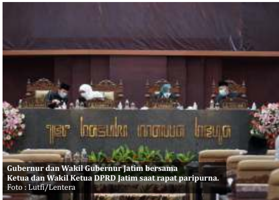
Gubernur dan Wakil Gubernur Jatim bersama Ketua dan Wakil Ketua DPRD Jatim saat rapat paripurna.