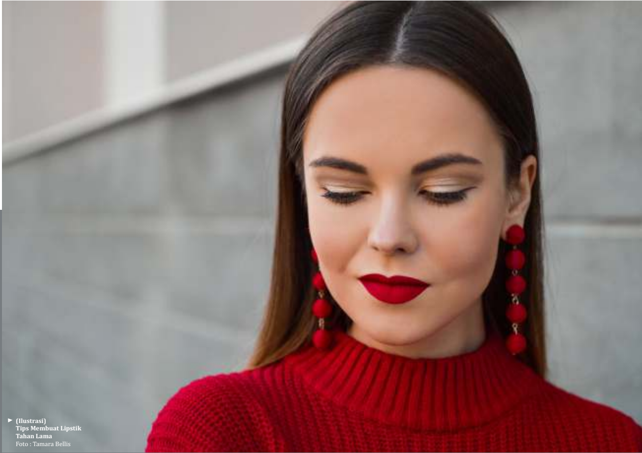
► (Ilustrasi) Tips Membuat Lipstik Tahan Lama

Pilih produk pelembap bibir yang mengandung minyak jojoba, emolient, vitamin E, sterol dan asam oleat yang mampu menghaluskan kulit bibirmu. Cara pemakaiannya mudah, oleskan lip balm ke seluruh per-