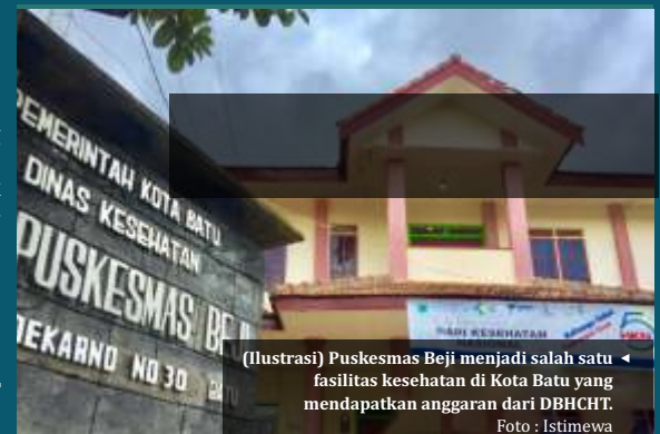
(Ilustrasi) Puskesmas Beji menjadi salah satu fasilitas kesehatan di Kota Batu yang mendapatkan anggaran dari DBHCHT.

Kepala Bagian Perekonomian dan SDA Pemkot Batu, Emilyati menjelaskan sosialisasi ini mampu memberantas perdagangan rokok ilegal, dan memungkinkan untuk menaikkan pendapatan asli daerah. "Menjual rokok legal sudah berkontribusi