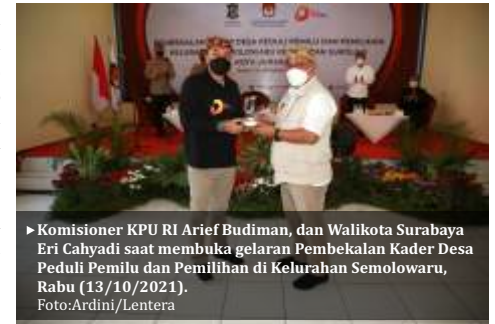
► Komisioner KPU RI Arief Budiman, dan Walikota Surabaya Eri Cahyadi saat membuka gelaran Pembekalan Kader Desa Peduli Pemilu dan Pemilihan di Kelurahan Semolowaru, Rabu (13/10/2021).

banyak yang peduli serius, ini akan dikembangkan supaya semua peduli. Targetnya adalah untuk meningkatkan partisipasi pemilih di tahun 2024," terang dia.