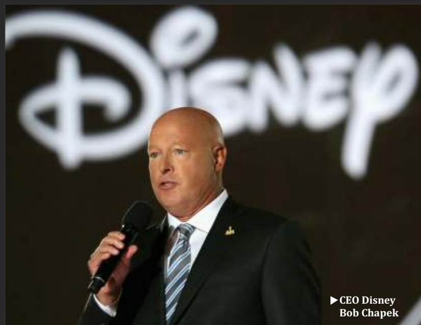
► CEO Disney Bob Chapek

Johansson juga mengatakan senang bisa menyelesaikan perbedaannya dengan perusahaan itu dan menyambut