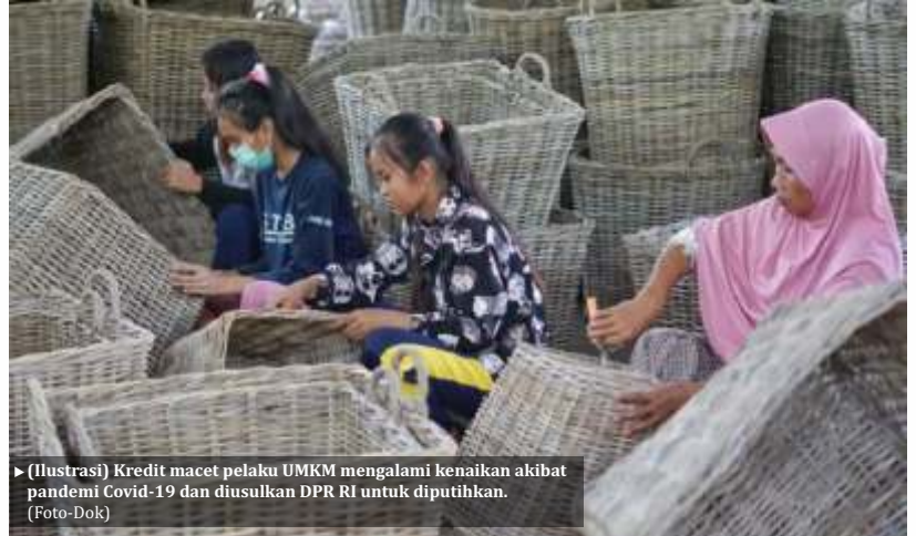
► (Ilustrasi) Kredit macet pelaku UMKM mengalami kenaikan akibat pandemi Covid-19 dan diusulkan DPR RI untuk diputihkan.

Selain itu, Gobel juga mengingatkan agar perbankan melakukan pem-