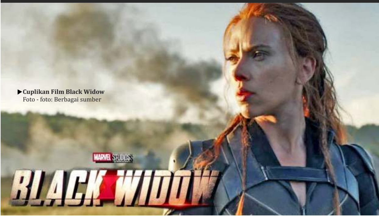
► Cuplikan Film Black Widow

Akibat penutupan bioskop dan menjamurnya layanan streaming, Disney mengadopsi alternatif streaming untuk film-film terbesar mereka. Disney sendiri telah mengirimkan lima film ke Disney+ Premier Access sejak pandemi dimulai, dari Mulan hingga Jungle Cruise. (THR/dya)