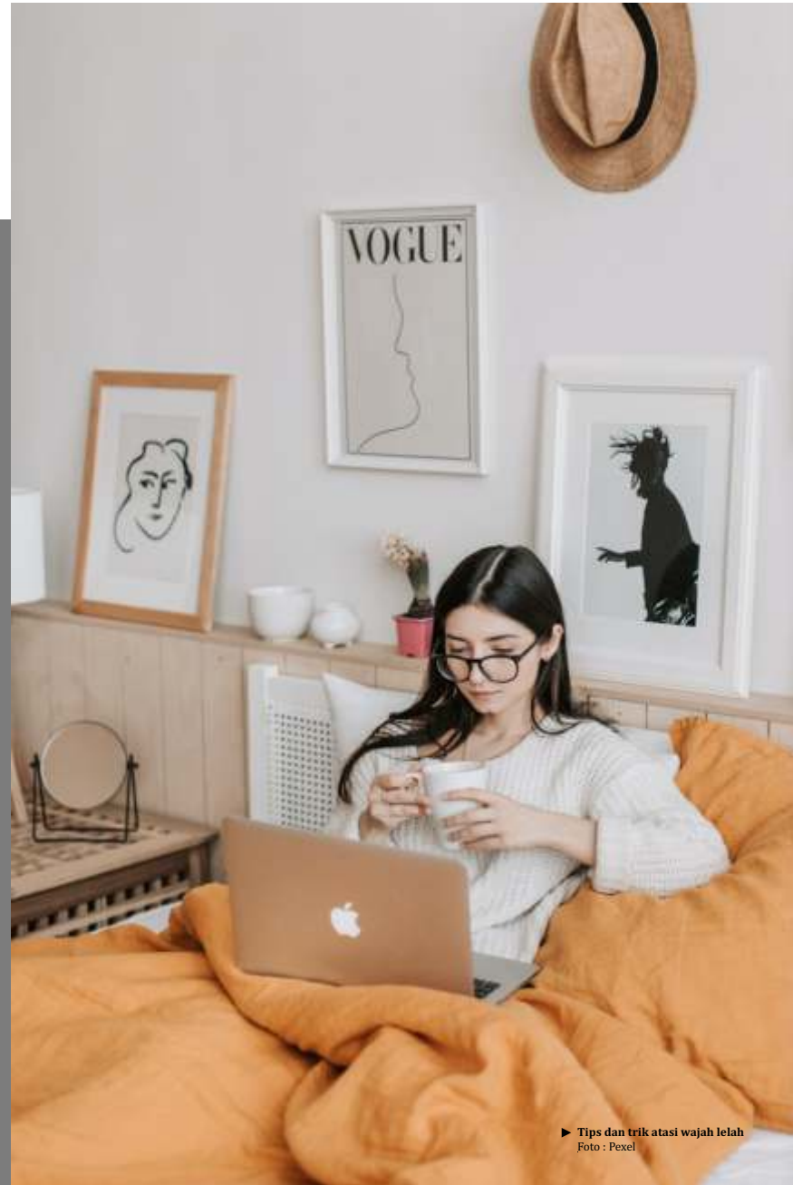
► Tips dan trik atasi wajah lelah

Mandi lah menggunakan air dingin untuk membantu tubuh jadi terasa lebih segar dan memperlancar peredaran darah. Untuh area wajah, kamu bisa membasuhnya dulu dengan air dingin, aplikasikan face cleanser, basuh dengan air