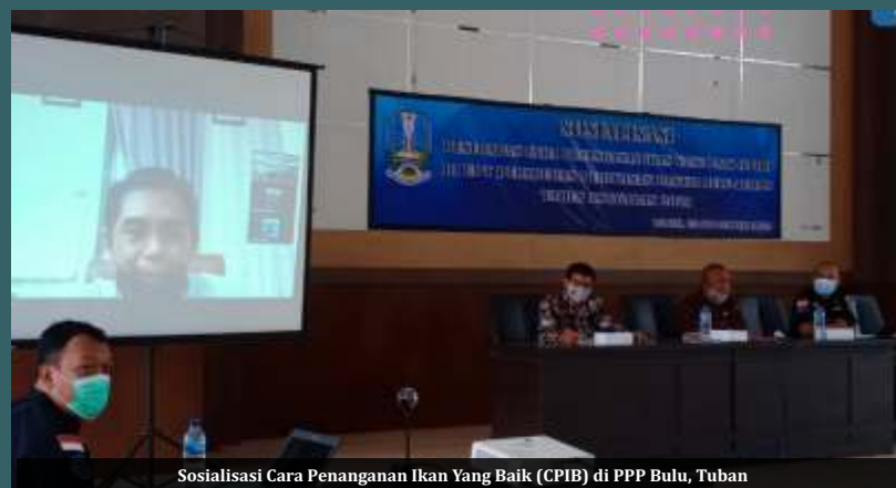
Sosialisasi Cara Penanganan Ikan Yang Baik (CPIB) di PPP Bulu, Tuban

Masyarakat nelayan mengikuti dengan seksama dan memperhatikan protokol kesehatan, semoga dengan adanya sosialisasi ini dapat memberikan wawasan kepada kru kapal dalam melakukan penanganan ikan di kapal.(adv)