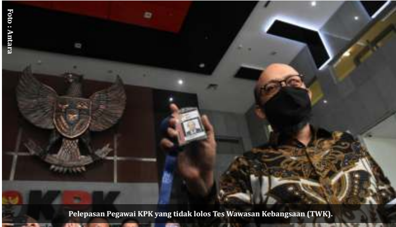
Pelepasan Pegawai KPK yang tidak lolos Tes Wawasan Kebangsaan (TWK).

Jakarta-Berbagai masukan dan kritikan terus beredar terkait rencana perekrutan Novel Baswedan Cs oleh Polri. Indonesia Police Watch (IPW) mendukung, tapi ada 'garis bawah' terkait peraturan perundang-undangan yakni KUHAP dan UU Nomor 2 Tahun 2002 Tentang Kepolisian Republik Indonesia yang bisa menjadi persoalan.