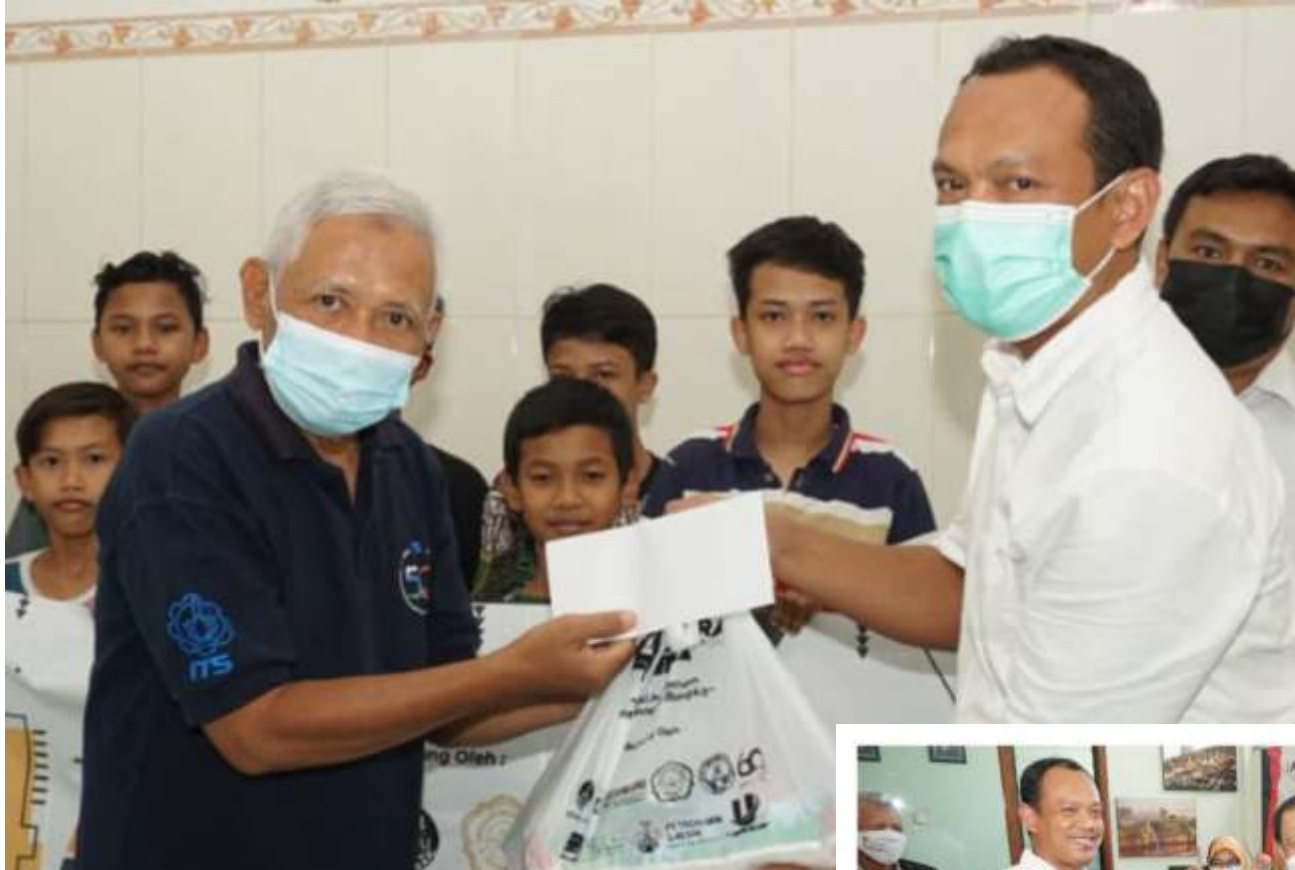
Berbagai kegiatan berbagi Lentera Media Group dalam rangka memperingati tahun ke-4.