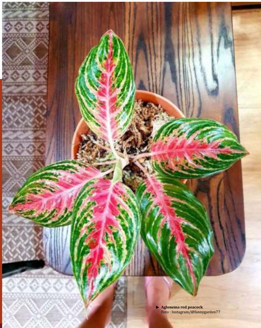
► Aglonema red peacock

Cara merawat tanaman hias aglonema red peacock berikutnya adalah dengan memerhatikan tata letaknya. Tanaman ini bisa diletakkan di dalam ruangan, tapi harus tetap sesekali mendapatkan sinar matahari pagi. Kalau tanaman kurang matahari warnanya juga kurang cantik. Minimal, seminggu tiga kali kalau di dalam ruangan. (berbagai sumber/dya)