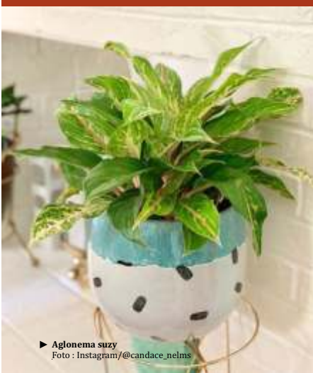
► Aglonema suzy

Kamu perlu melindungi tanaman ini dari paparan langsung sinar matahari. Jangan lupa untuk melakukan penyiraman secara berkala dengan intensitas air sedang. Untuk mendapatkannya, kamu bisa membelinya dengan kisaran harga Rp60 ribuan. (berbagai sumber/dya)