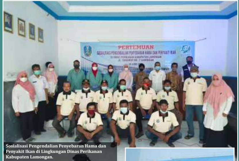
Sosialisasi Pengendalian Penyebaran Hama dan Penyakit Ikan di Lingkungan Dinas Perikanan Kabupaten Lamongan.

Materi yang di sampaikan dalam kegiatan sosialisasi ini meliputi, Potensi dan Strategi menjadi pembudidaya ikan yang baik; aplikasi penghitungan pemberian pakan; pengenalan jenis-jenis hama dan penyakit ikan yang sering ditemukan dan dialami oleh pembudidaya, pengujian berkala kualitas