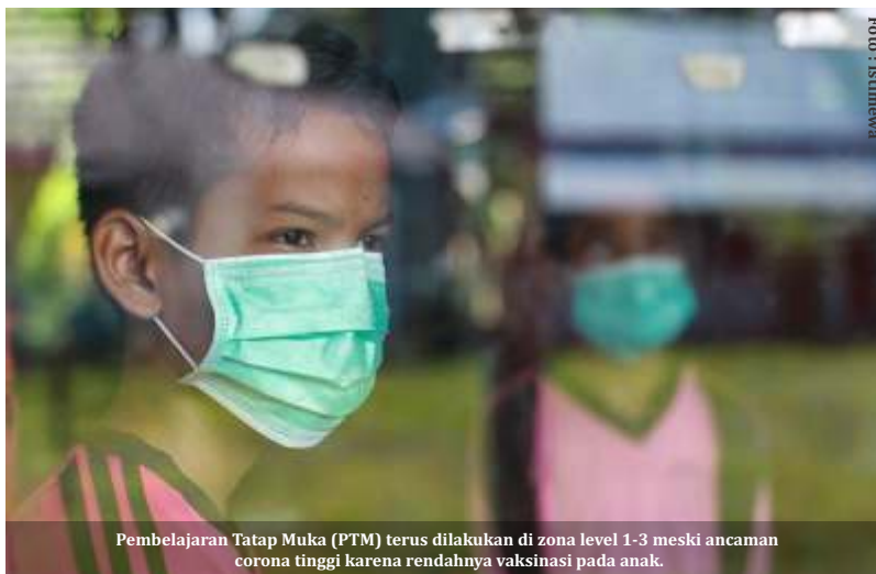
Pembelajaran Tatap Muka (PTM) terus dilakukan di zona level 1-3 meski ancaman corona tinggi karena rendahnya vaksinasi pada anak.

Dia mengatakan Badan Kesehatan Dunia (WHO) meminta positivity rate 5 persen sebagai syarat member-