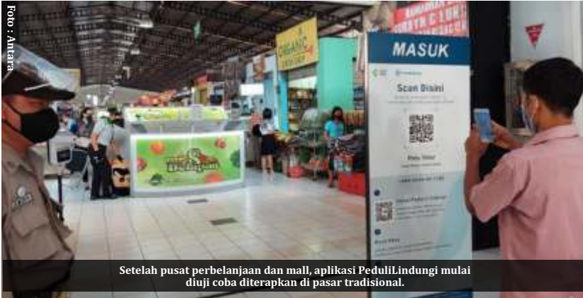
Setelah pusat perbelanjaan dan mall, aplikasi PeduliLindungi mulai diuji coba diterapkan di pasar tradisional.

Jakarta- Tak sekadar aplikasi yang merekam berbagai hal terkait Covid-19, PeduliLindungi bakal ditambah beberapa fitur diantaranya pembayaran digital. Bila hal itu terealisasi, aplikasi inipun akan menjadi superapp alias aplikasi super.