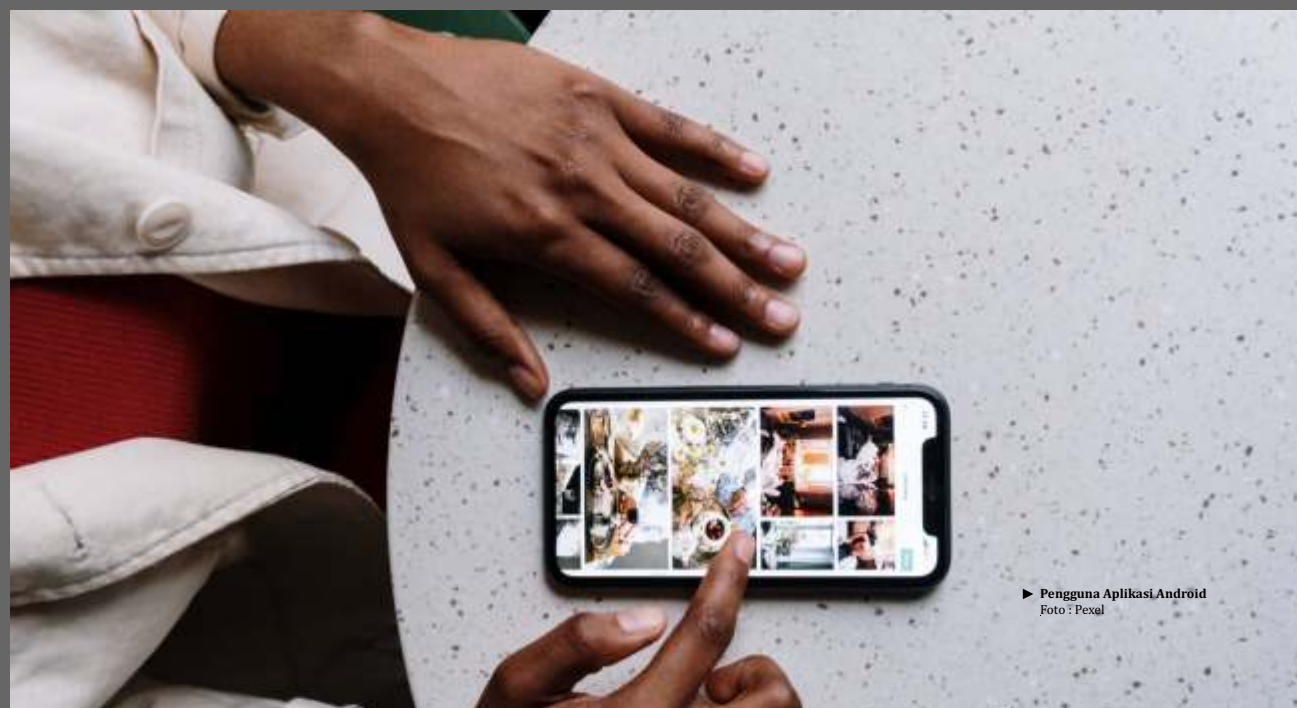
► Pengguna Aplikasi Android

Sama seperti trojan perbankan kebanyakan, GriftHorse tidak mengeksploitasi celah keamanan di sistem operasi Android. Setelah pengguna mengunduh aplikasi berisi GriftHorse, malware ini memanfaatkan kelengahan korban dan menggunakan rekayasa sosial untuk mendaftarkan nomor korban ke