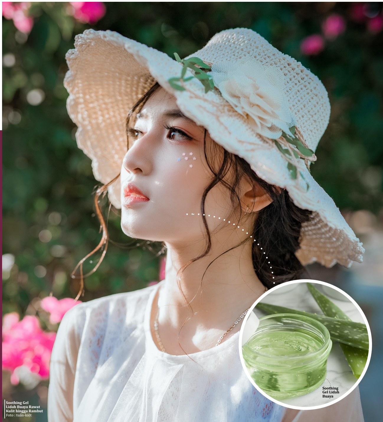
Soothing Gel Lidah Buaya Rawat Kulit hingga Rambut

Gel lidah buaya memiliki sifat mendinginkan dan anti-inflamasi. Ini adalah salah satu solusi paling alami untuk kulit yang terbakar sinar matahari. Mengoleskan gel ini memberikan lapisan pelindung untuk kulit dan membantu mempertahankan kelembapan. Lidah buaya kaya antioksidan dan mineral yang meningkatkan proses penyembuhan.