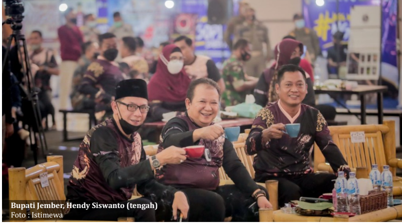
Bupati Jember, Hendy Siswanto (tengah)

Jember-Upaya memutus peredaran rokok ilegal yang merugikan pendapatan negara, harus melibatkan kerja sama semua pihak. Sehingga sosialisasi dan edukasi kepada masyarakat menjadi bagian penting, dalam menghentikan peredaran rokok tanpa cukai.