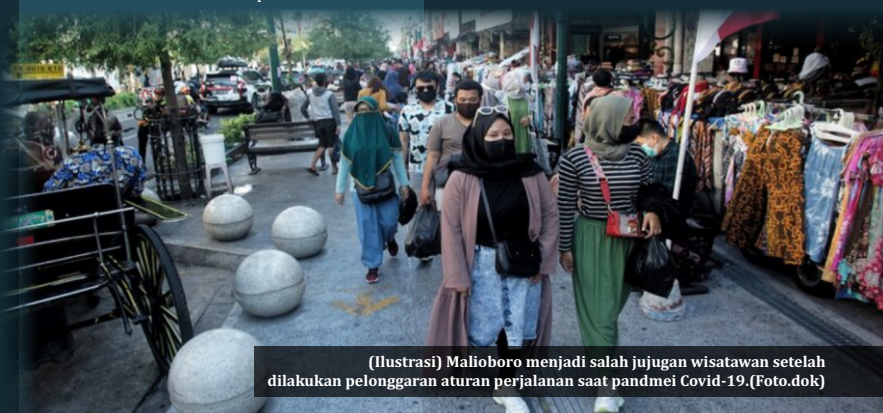
(Ilustrasi) Malioboro menjadi salah jujugan wisatawan setelah dilakukan pelanggaran aturan perjalanan saat pandemi Covid-19. (Foto.dok)

6. Dilarang untuk melakukan pawai atau arak-arakan dalam rangka peringatan Hari Raya Natal 2021 yang melibatkan jumlah peserta dalam skala besar