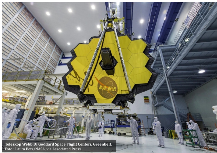
Teleskop Webb Di Goddard Space Flight Center, Greenbelt.

Webb tidak akan mengorbit Bumi seperti dilakukan Hubble. Sebaliknya, ia akan mengelilingi matahari di titik Lagrangian "L2" Bumi, di mana tarikan gravitasi Bumi dan matahari membatalkan satu sama lain, lalu membentuk kantong ruang yang stabil di