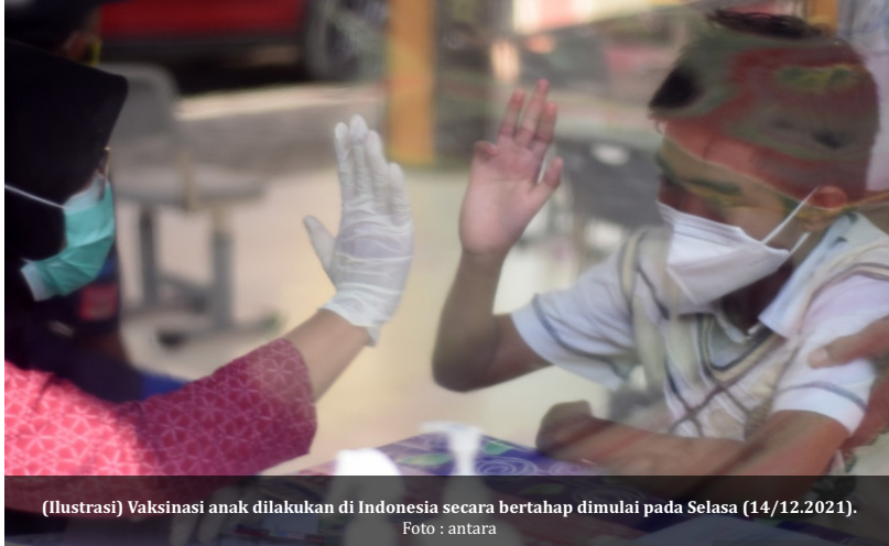
(Ilustrasi) Vaksinasi anak dilakukan di Indonesia secara bertahap dimulai pada Selasa (14/12.2021).

S urabaya – Vaksinasi Covid-19 terhadap anak usia 6-11 tahun di Jawa Timur (Jatim) dilaksanakan mulai Rabu (15/12) hari ini. Untuk sementara vaksinasi anak ini akan dilaksanakan di 21 dari 38 daerah di Jatim.