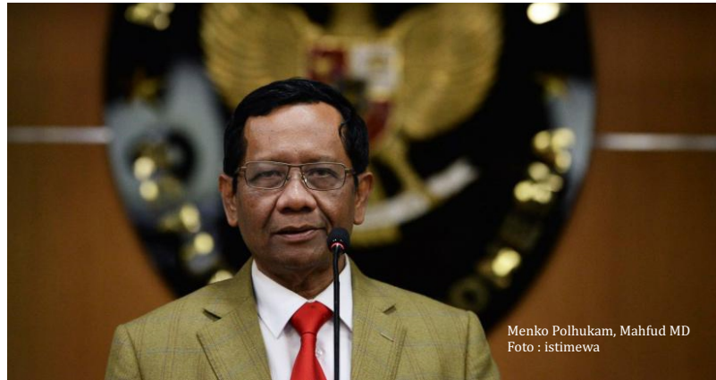
Menko Polhukam, Mahfud MD

Namun, dalam rincian program legislasi nasional (prolegnas) tahun 2022, DPR belum memasukan RUU Perampasan Aset. "Makanya, Presiden Jokowi dua hari kemudian akan mengajukan itu dan kita mohon pengertian