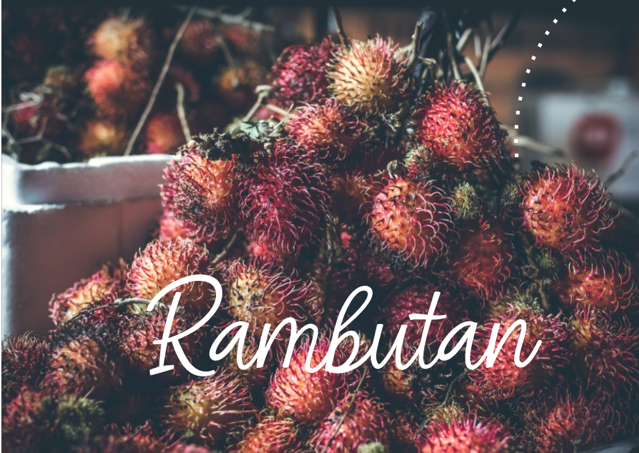
(Ilustrasi) Manfaat Konsumsi Rambutan