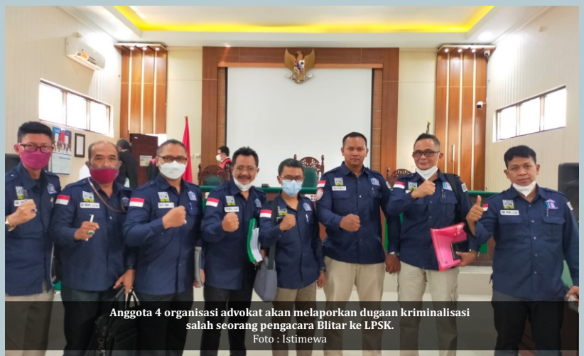
Anggota 4 organisasi advokat akan melaporkan dugaan kriminalisasi salah seorang pengacara Blitar ke LPSK.

Namun kenyataannya oleh hakim di pengadilan seperti diabaikan, atau