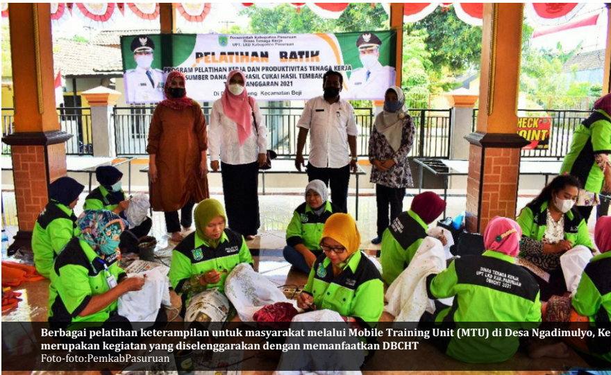
Berbagai pelatihan keterampilan untuk masyarakat melalui Mobile Training Unit (MTU) di Desa Ngadimulyo, Kec. Sukorejo, Kab.Pasuruan dan juga merupakan kegiatan yang diselenggarakan dengan memanfaatkan DBCHT