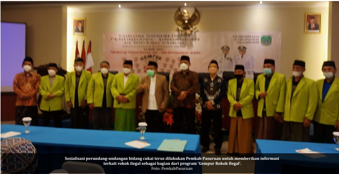
Sosialisasi perundang-undangan bidang cukai terus dilakukan Pemkab Pasuruan untuk memberikan informasi terkait rokok ilegal sebagai bagian dari program 'Gempur Rokok Ilegal'.

Pasuruan- Upaya memutus peredaran rokok ilegal yang merugikan pendapatan negara, harus melibatkan kerja sama semua pihak. Sehingga sosialisasi dan edukasi kepada masyarakat menjadi bagian penting, dalam menghentikan peredaran rokok tanpa cukai.