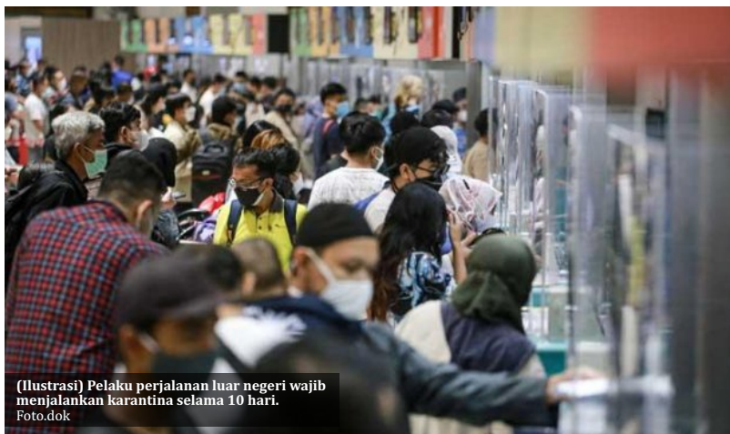
(Ilustrasi) Pelaku perjalanan luar negeri wajib menjalankan karantina selama 10 hari.

Abdul Aziz berharap hal ini dapat menjadi perhatian bersama baik dari sisi perekonomian maupun peningkatan spiritual umat Islam. "Banyak travel yang hampir semuanya tutup, mem-PHK karyawan, kalau saya hitung-hitung ada 10.000-an