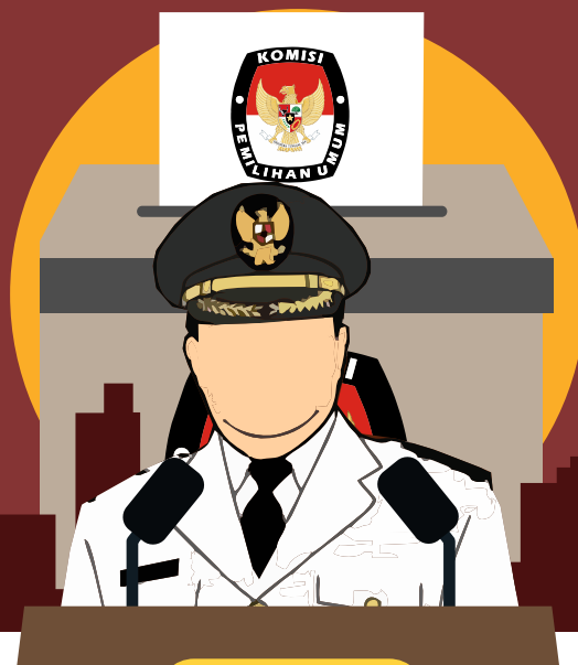
Sumber Berbagi Sumber Diolah

Dalam Undang-Undang Nomor 7 Tahun 2017, ambang batas parlemen ditetapkan sebesar 4% dan berlaku nasional untuk semua anggota DPR. Partai mengikuti Pemilu PKB, Gerindra, PDIP, Golkar, Nasdem, PKS, PPP, PAN, dan Demokrat. Kemudian terdapat tujuh partai tidak melenggang ke Senayan yakni Garuda, Berkarya, PSI, Perindo, Hanura, PBB dan PKPI.