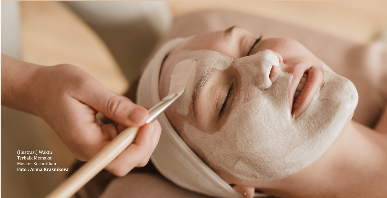
(Ilustrasi) Waktu Terbaik Memakai Masker Kecantikan

Jangan salah, ternyata pilihan waktu memakai masker wajah akan menentukan efektivitasnya terhadap kulit kita. Menggunakan masker wajah dalam kondisi kulit belum bersih, misalnya, bisa membuat kandungan skincare dalam masker tidak terserap dengan baik ke kulit karena adanya kotoran dan minyak di wajah.