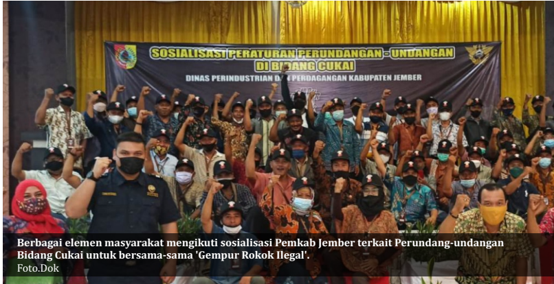
Berbagai elemen masyarakat mengikuti sosialisasi Pemkab Jember terkait Peraturan-undangan Bidang Cukai untuk bersama-sama 'Gempur Rokok Ilegal'.

Jember - Hasil tembakau (produk mentah) dan cerutu (produk jadi) dari Jember memiliki kualitas terbaik dan nilai jual tinggi. Tidak heran, negara-negara di Eropa banyak yang tertarik untuk membelinya.