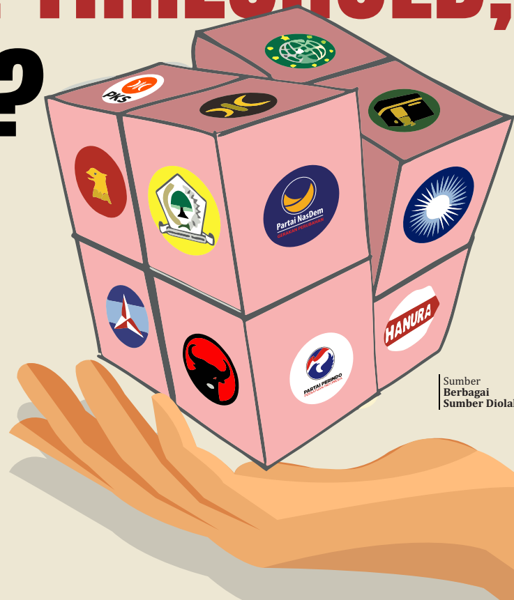
Sumber Berbagai Sumber Diolah