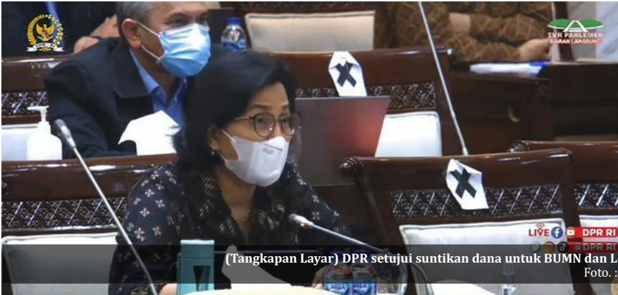
(Tangkapan Layar) DPR setuju suntikan dana untuk BUMN dan Lembaga saat rapat dengan Menkeu, Sri Mulyani, Rabu (15/12/2021).