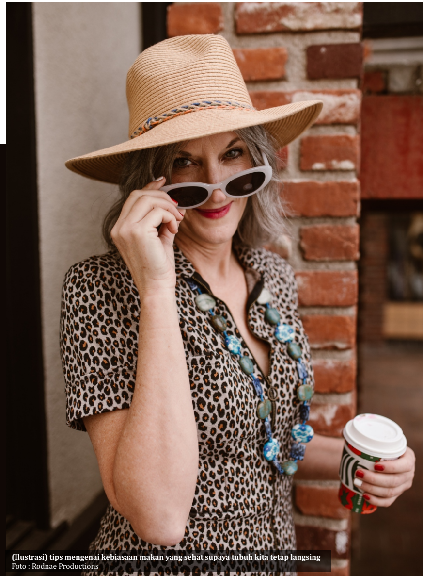
(Ilustrasi) tips mengenai kebiasaan makan yang sehat supaya tubuh kita tetap langsing

Di samping itu, protein juga dapat membantu menjaga otot untuk mencegah penurunan metabolisme. "Makanlah sumber protein tanpa lemak yang baik seperti telur, kacang-kacangan, polong-polongan, dan dua