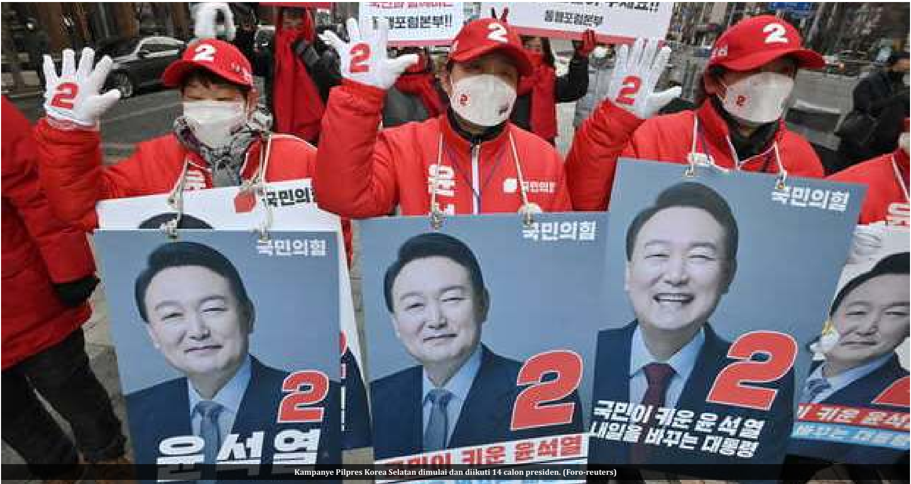
Kampanye Pilpres Korea Selatan dimulai dan diikuti 14 calon presiden.

SEOUL - Korea Selatan (Korsel) akan menggelar pemilu presiden (pilpres) pada 9 Maret mendatang. Ada 14 calon presiden (capres) yang akan bertarung dan masa kampanye yang telah dimulai.