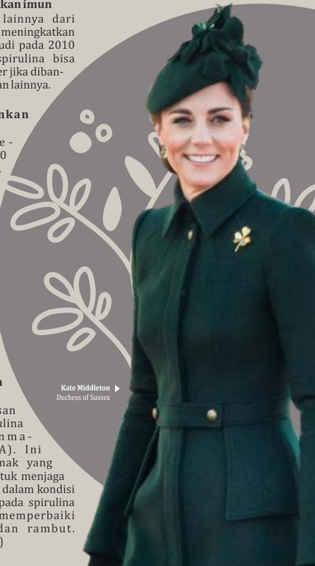
Kate Middleton Duchess of Sussex

Menurut penjelasan Cathy Holligan, spirulina mengandung gamma-linolenic acid (GLA). Ini merupakan asam lemak yang punya manfaat baik untuk menjaga sistem saraf agar selalu dalam kondisi sehat. Selain itu, GLA pada spirulina juga diyakini bisa memperbaiki penampilan kulit dan rambut. (berbagasi sumber/dya)