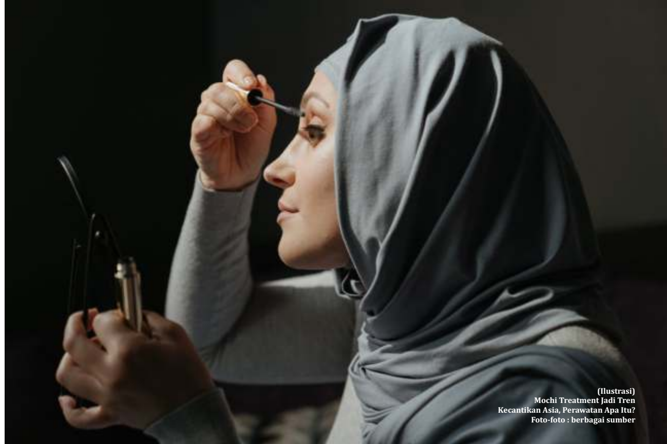
(Ilustrasi) Mochi Treatment Jadi Tren Kecantikan Asia, Perawatan Apa Itu?

Produk serum bulu mata juga aman bagi lingkungan. Bulu mata palsu menghasilkan limbah plastik tambahan dan lem bulu mata mengandung bahan kimia keras yang