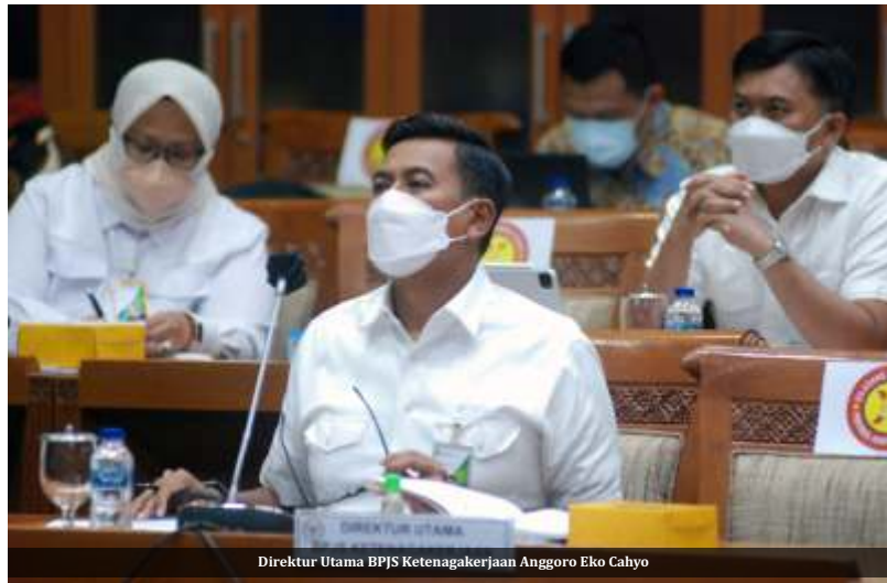
Direktur Utama BPJS Ketenagakerjaan Anggoro Eko Cahyo

Selain itu 12,5% ditempatkan di saham yang didominasi oleh saham blue chip yang masuk kategori LQ45. Sebanyak 7% diinvestasikan pada instrumen reksa dana yang berisi saham blue chip. "Setengah persen diinvestasikan pada properti dan penyertaan langsung. Dengan demikian portofolio investasi JHT ini aman dan likuid," tambah dia.