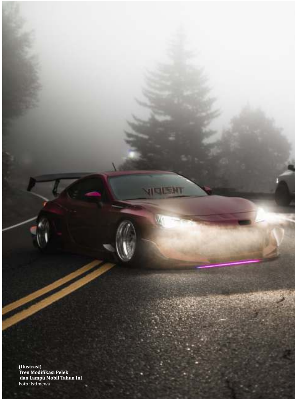
(Ilustrasi) Tren Modifikasi Pelek dan Lampu Mobil Tahun Ini

"Kemudian, pemilik kendaraan juga harus tahu fungsi dan pengetahuan produk tersebut, jadi mereka tidak asal jual saja. Dan terakhir, pastikan after sales bisa dipertanggungjawabkan dan dijaga," kata dia. (berbagi sumber/dya)