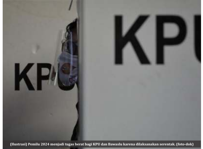
(Ilustrasi) Pemilu 2024 menjadi tugas berat bagi KPU dan Bawaslu karena dilaksanakan serentak.

untuk Pemilu dan Demokrasi (Perludem) Khoirunnisa Nur Agustyati menekankan bahwa 12 nama pimpinan KPU Bawaslu terpilih harus mampu bekerja secara transparan dan akuntabel dan terbuka terhadap masukan publik. Para penyelenggara Pemilu tersebut wajib menjaga independensinya khususnya dalam mempersiapkan perhalatan pemilu serentak 2024 mendatang.