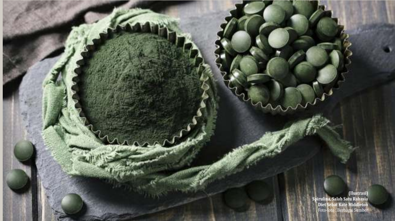
(Ilustrasi) Spirulina, Salah Satu Rahasia Diet Sehat Kate Middleton