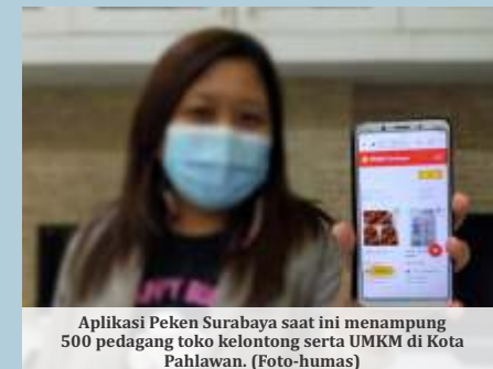
Aplikasi Peken Surabaya saat ini menampung 500 pedagang toko kelontong serta UMKM di Kota Pahlawan.