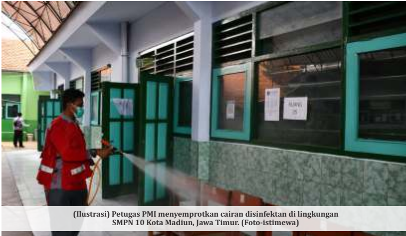
(Ilustrasi) Petugas PMI menyemprotkan cairan disinfektan di lingkungan SMPN 10 Kota Madiun, Jawa Timur.

Madiun — Beberapa wilayah naik status ke level 4 dalam Pemberlakuan Pembatasan Kegiatan Masyarakat (PPKM) berdasarkan Instruksi Menteri Dalam Negeri Nomor 12 Tahun 2022. Di Provinsi Jawa Timur (Jatim), Kota Madiun menjadi satu-satunya wilayah yang naik ke level tersebut.