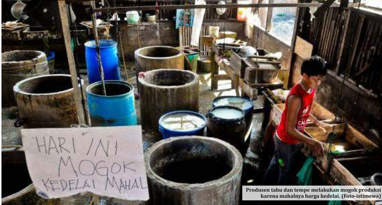
Produsen tahu dan tempe melakukan mogok produksi karena mahalnya harga kedelai.