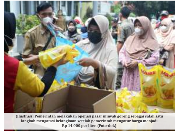
(Ilustrasi) Pemerintah melakukan operasi pasar minyak goreng sebagai salah satu langkah mengatasi kelangkaan setelah pemerintah mengatur harga menjadi Rp 14.000 per liter.

Enam kebijakan Kementerian Perdagangan (Kemendag) tersebut melalui Permendag nomor 36 tahun 2020, Permendag 72 tahun 2021, dan