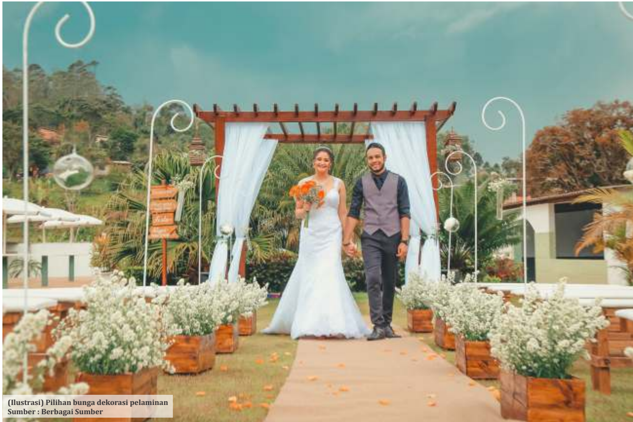
(Ilustrasi) Pilihan bunga dekorasi pelaminan

Ada banyak bunga yang biasa hadir di pesta-pesta pernikahan. Anda bisa memilihnya berdasarkan yang disukai, atau menyesuaikan dengan palet warna dominan pada dekorasi. Berikut pilihan bunga dekorasi pelaminan, mengutip berbagai sumber.