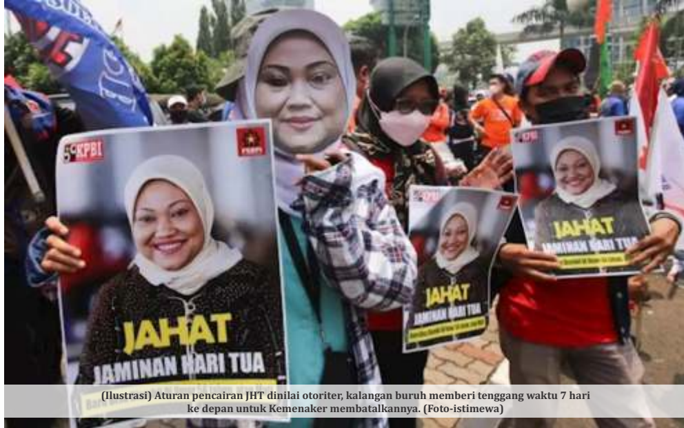
(Ilustrasi) Aturan pencairan JHT dinilai otoriter, kalangan buruh memberi tenggang waktu 7 hari ke depan untuk Kemenaker membatalkannya.

"Permenaker yang baru dikeluarkan ini memberatkan para pekerja