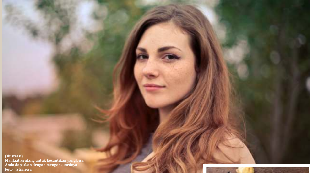
(Ilustrasi) Manfaat kentang untuk kecantikan yang bisa Anda dapatkan dengan mengonsumsinya

Tak banyak yang tahu, manfaat kentang untuk kecantikan bisa meningkatkan warna kulit. Kentang memiliki kandungan zat besi yang tinggi yang membuat kulit sehat dan bercahaya.