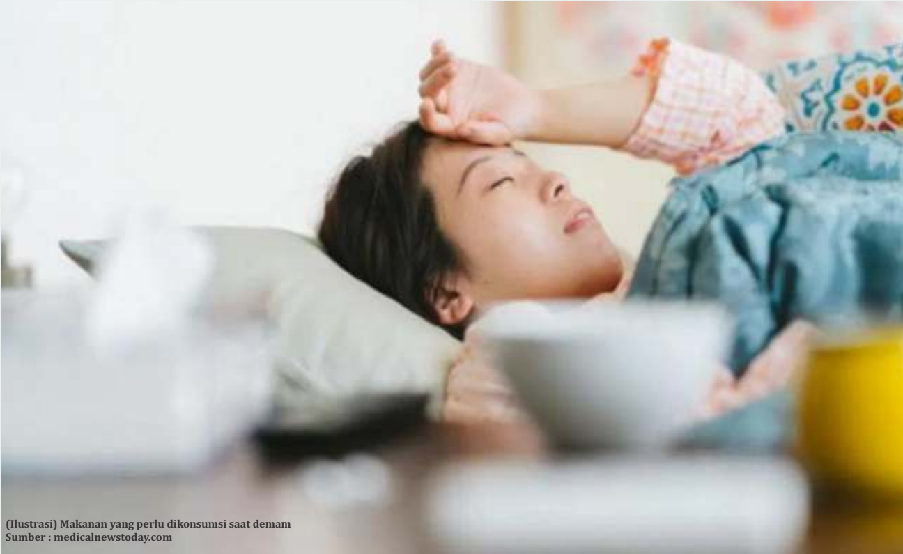
(Ilustrasi) Makanan yang perlu dikonsumsi saat demam

Makanan yang perlu dikonsumsi saat demam di antaranya makanan yang banyak mengandung cairan, sayur, buah, asupan tinggi protein tapi minim lemak jahat, dan rempah-rempah.