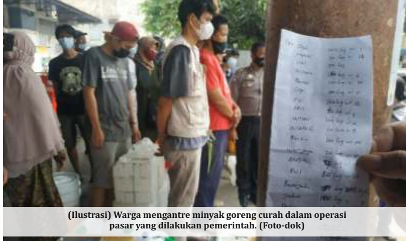
(Ilustrasi) Warga mengantre minyak goreng curah dalam operasi pasar yang dilakukan pemerintah.

Ridho menjelaskan bahwa ketika harga HET sudah ditetapkan oleh pemerintah. Namun, masih tetap terjadi penimbunan, maka