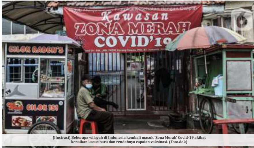
(Ilustrasi) Beberapa wilayah di Indonesia kembali masuk 'Zona Merah' Covid-19 akibat kenaikan kasus baru dan rendahnya capaian vaksinasi.

Di sisi lain WHO akhirnya menetapkan subvarian omicron BA.1 dan BA.2 sebagai variant of Concern. Keputusan itu diambil berdasarkan data transmisi, keparahan, infeksi