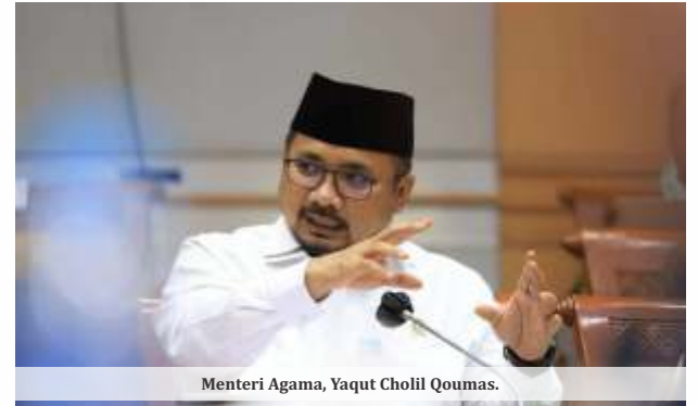
Menteri Agama, Yaqut Cholil Qoumas.

Jadi, yang diatur bagaimana volume speaker tidak boleh kencang-kencang, hanya 100 dB maksimal. Diatur kapan mereka bisa mulai gunakan speaker itu sebelum dan setelah azan. "Jadi tidak ada