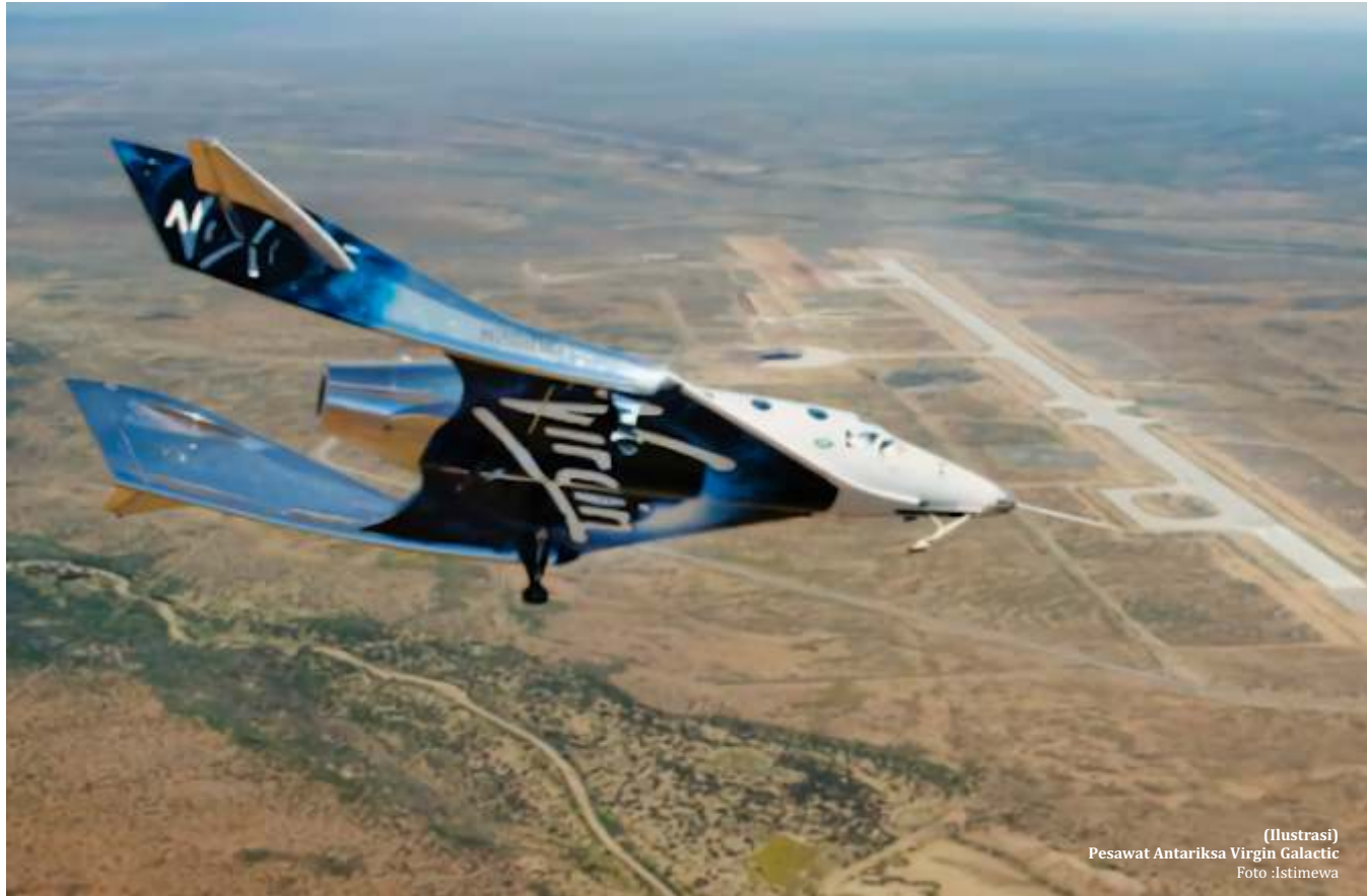
(Ilustrasi) Pesawat Antariksa Virgin Galactic

PERUSAHAAN antariksa kembali bikin heboh para 'sultan' dunia setelah menawarkan tiket wisata luar angkasa. Mereka memberi kesempatan kepada umum untuk melihat bagaimana pemandangan ruang gelap di luar Bumi.a.