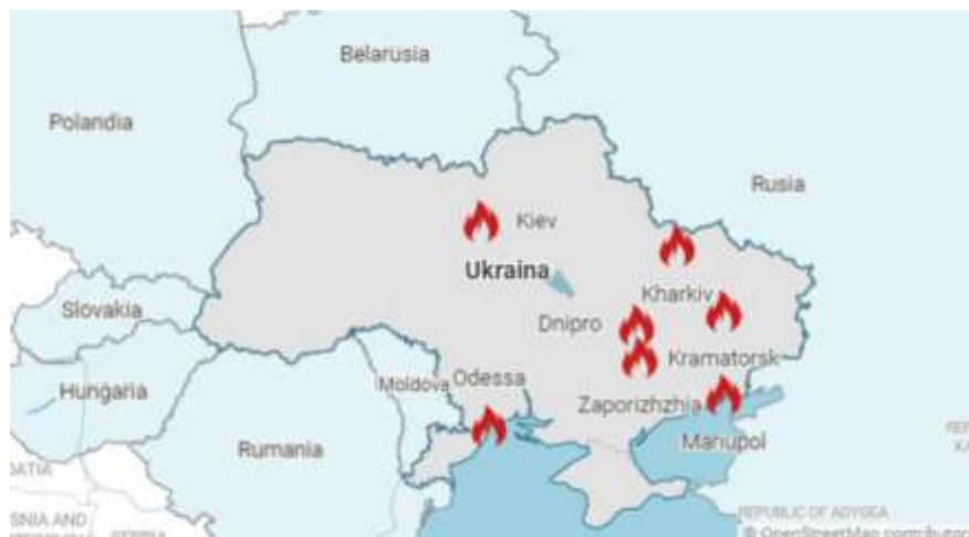
Data per Kamis (24/2)

Rusia mulai menyerang Ukraina pada Kamis (24/2). Sejumlah kota dibombardir