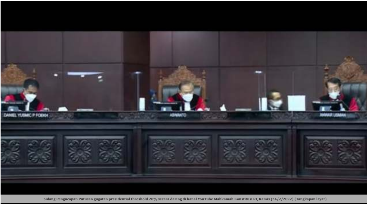
Sidang Pengucapan Putusan gugatan presidential threshold 20% secara daring di kanal YouTube Mahkamah Konstitusi RI, Kamis (24/2/2022). (Tangkapan layar)

JAKARTA -Mahkamah Konstitusi (MK) secara konsisten menyatakan presidential threshold atau ketentuan ambang batas pencalonan presiden dan wakil presiden sebesar 20 persen adalah konstitusional. Ini seperti terkandung dalam Pasal 222 Undang-Undang Nomor 7 Tahun 2017 tentang Pemilihan Umum.