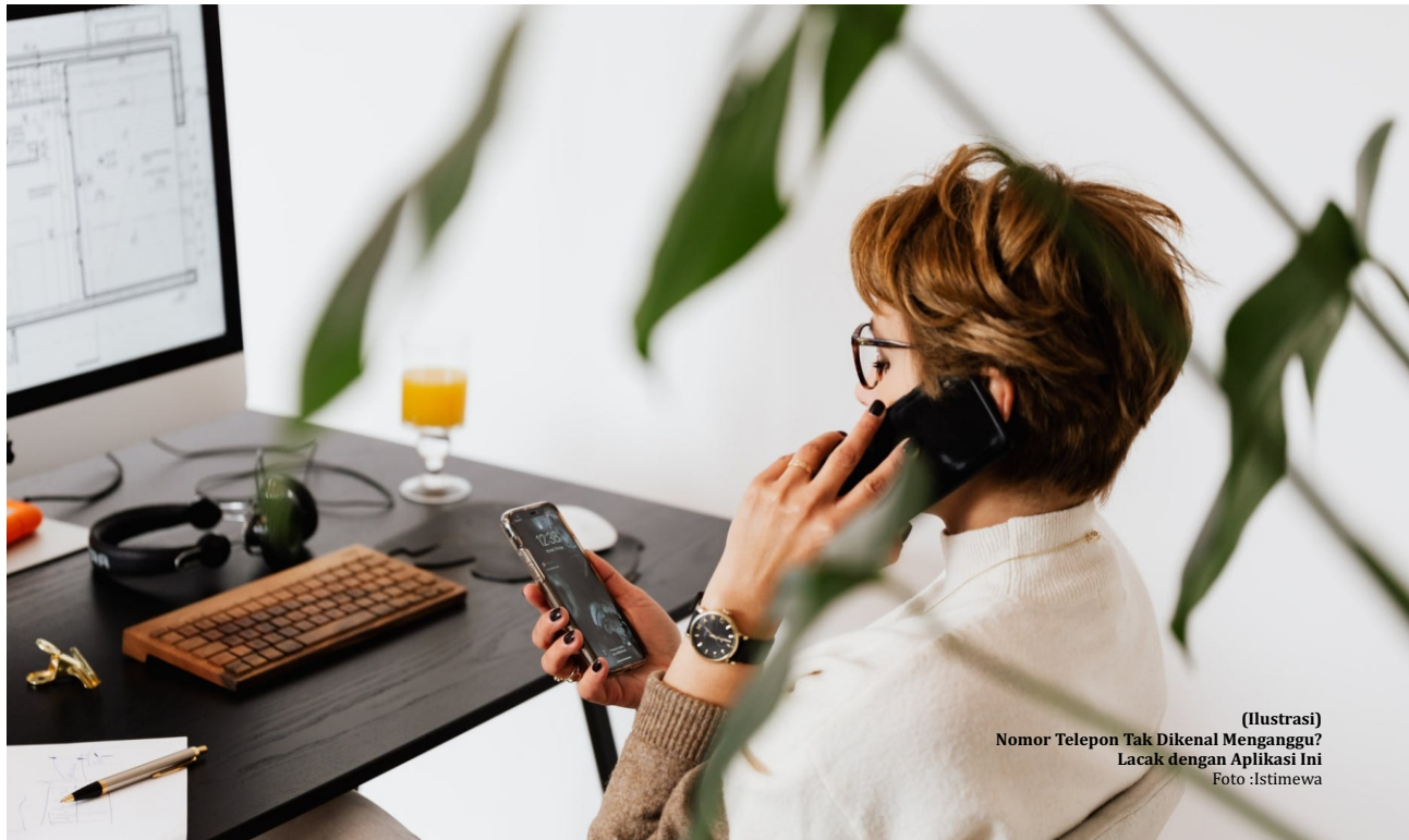
(Ilustrasi) Nomor Telepon Tak Dikenal Mengganggu? Lacak dengan Aplikasi Ini

Getcontact memiliki fitur yang hampir sama dengan Truecaller, yaitu