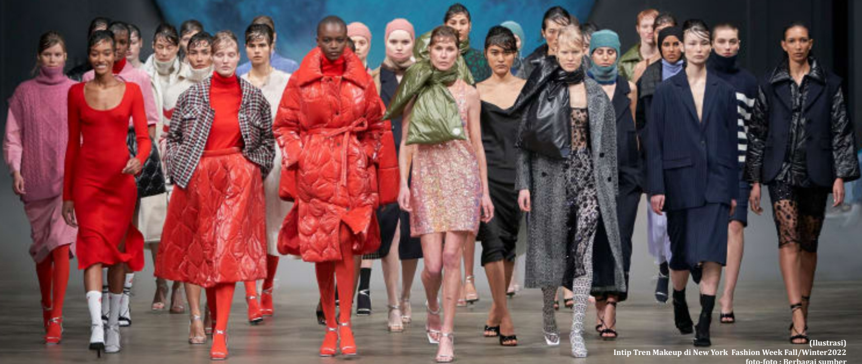
(Ilustrasi) Intip Tren Makeup di New York Fashion Week Fall/Winter2022