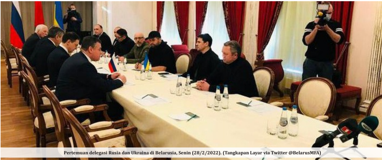
Pertemuan delegasi Rusia dan Ukraina di Belarusia, Senin (28/2/2022).

KIEV- Pembicaraan antara pejabat Rusia dan Ukraina dimulai di perbatasan Belarusia pada Senin (28/2). Pembicaraan dimulai lima hari setelah Rusia menginvasi Ukraina, yang menjadi serangan terbesar di Eropa sejak Perang Dunia Kedua.