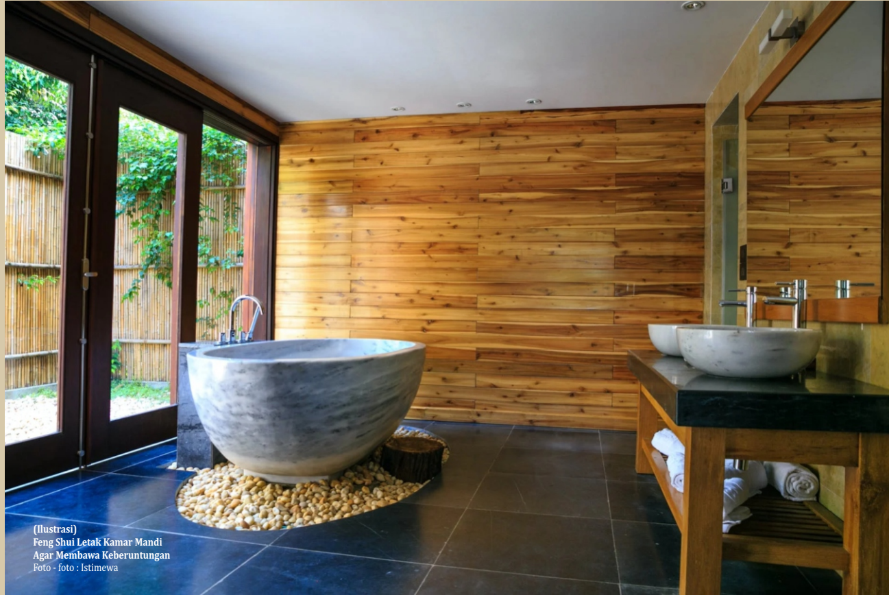
(Ilustrasi) Feng Shui Letak Kamar Mandi Agar Membawa Keberuntungan

Nah, bagi kamu yang mempercayai feng shui, berbagai hal tersebut nggak bisa ditentukan sembarangan, lho. Rukita mau kasih beberapa tips feng shui yang baik, terutama untuk letak kamar mandi di rumah yang bisa membawa energi positif dan keberuntungan bagi kamu.