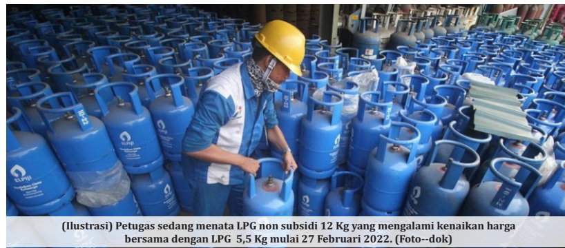
(Ilustrasi) Petugas sedang menata LPG non subsidi 12 Kg yang mengalami kenaikan harga bersama dengan LPG 5,5 Kg mulai 27 Februari 2022.

Di samping itu, Bhima juga mengaku khawatir masyarakat miskin dan pelaku UMKM yang benar-benar membutuhkan