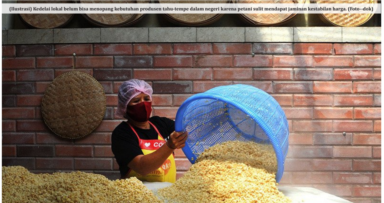
(Ilustrasi) Kedelai lokal belum bisa menampung kebutuhan produsen tahu-tempe dalam negeri karena petani sulit mendapat jaminan kestabilan harga.

Dosen jurusan agroteknologi Fakultas Pertanian Unsoed itu juga menambahkan bahwa terkait peningkatan produksi maka perlu adanya insentif bagi petani agar mau menanam kedelai. "Petani perlu kepastian pasar dan harga yang layak. Selain itu petani juga perlu jaminan pasar dan harga agar mereka makin terdorong untuk menanam kedelai," katanya. Selain itu, kata dia, para petani juga perlu dukungan teknologi terutama varietas unggul untuk bisa memacu dan peningkatan produksi