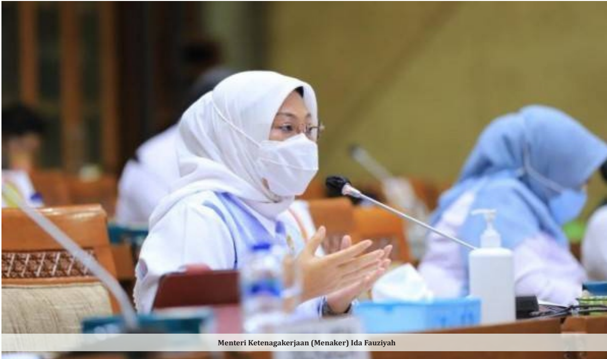
Menteri Ketenagakerjaan (Menaker) Ida Fauziyah

JAKARTA- RUU TPKS memang sudah terkatung-katung lama. Dahulu, RUU ini bernama RUU Penghapusan Kekerasan Seksual. Komnas Perempuan menginisiasi pembentukan peraturan perundangan yang memayungi masalah kekerasan seksual sejak tahun 2012. Sayangnya DPR dinilai lambat sehingga hingga kini belum juga disahkan menjadi undang-undang.