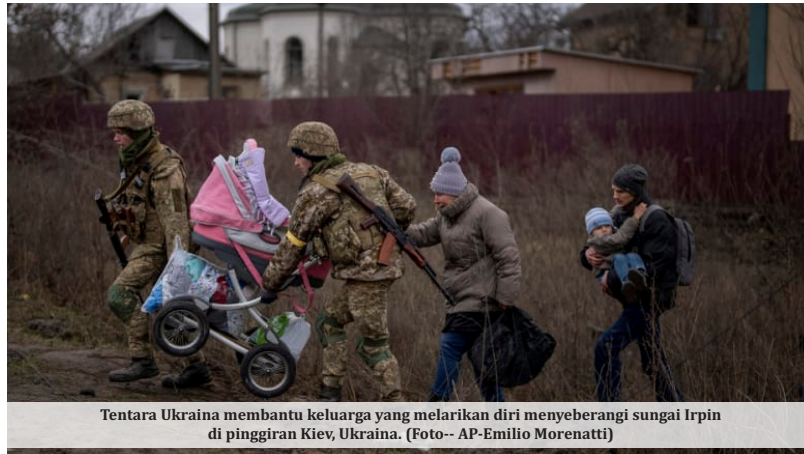
Tentara Ukraina membantu keluarga yang melarikan diri menyeberangi sungai Irpin di pinggiran Kiev, Ukraina.

Lanjut Moody's, konflik kedua negara ini juga dapat menambah tekanan pada industri komputer