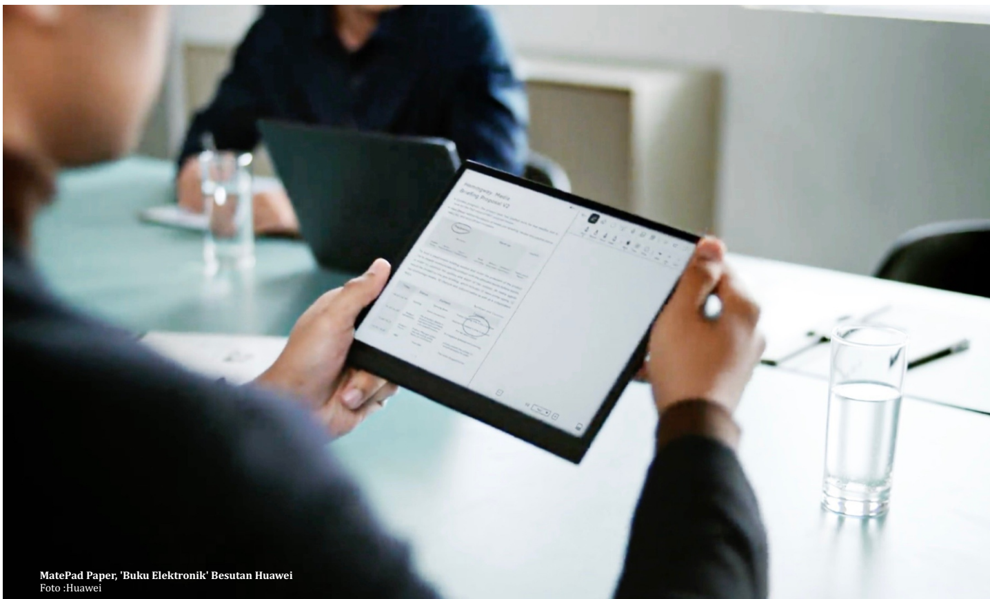
MatePad Paper, 'Buku Elektronik' Besutan Huawei

HUAWEI meluncurkan e-reader atau pembaca buku elektronik bernama MatePad Paper. Perangkat tersebut diluncurkan dalam ajang Mobile World Congress (MWC) 2022 di Barcelona, Spanyol akhir Februari. Pada dasarnya MatePad Paper mirip sebuah tablet, namun, desain dan fungsinya dirancang menyerupai buku untuk menunjang aktivitas pengguna ketika menulis atau membaca.