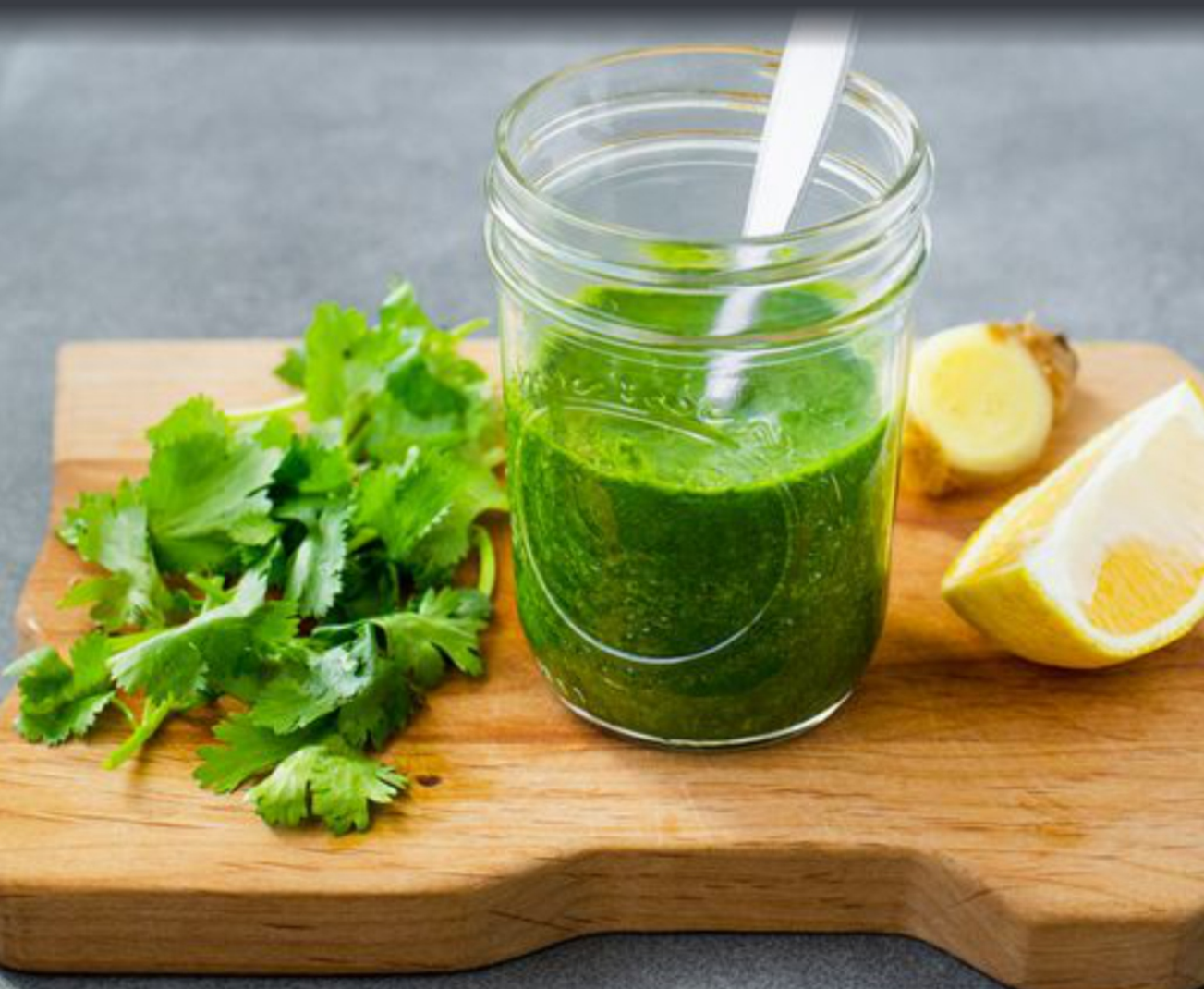
(Ilustrasi) Pangkas lemak dan tingkatkan metabolisme dengan jus ketumbar

Penelitian memang tidak dilakukan pada manusia, meski begitu, bisa juga diterapkan dalam kehidupan sehari-hari terutama untuk diet. Ieva mengatakan jus ketumbar mungkin rasanya tidak terlalu enak. Tapi tetap