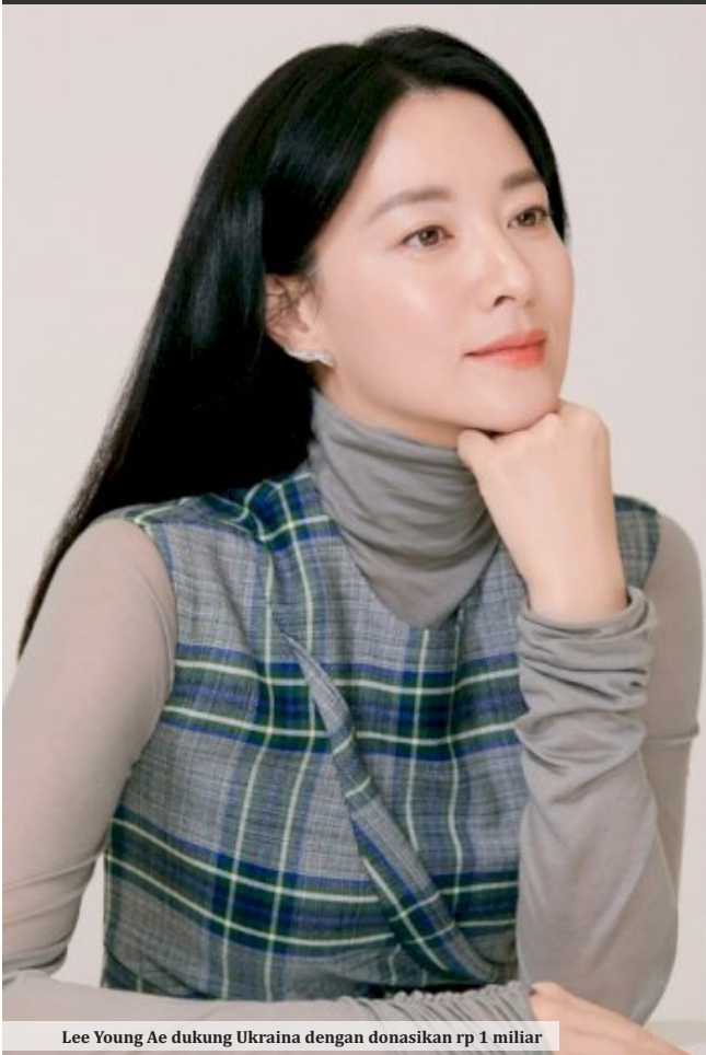
Lee Young Ae dukung Ukraina dengan donasikan rp 1 miliar