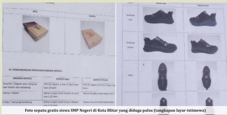
Foto sepatu gratis siswa SMP Negeri di Kota Blitar yang diduga palsu

BLITAR - Bantuan sepatu gratis untuk ribuan siswa SMP di Kota Blitar, yang nilainya mencapai ratusan juta rupiah diduga menggunakan sepatu palsu. Hal ini terungkap setelah pemilik hak paten merk sepatu dari Surabaya, melaporkannya ke Satreskrim Polres Blitar Kota. Kasat Reskrim Polresta Blitar, AKP Momon Suwito ketika dikonfirmasi wartawan membenarkan jika ada laporan pengaduan dugaan tindak pidana pemalsuan merek yang diterima pada 27 Januari 2022 lalu dan sudah dalam proses penyelidikan.