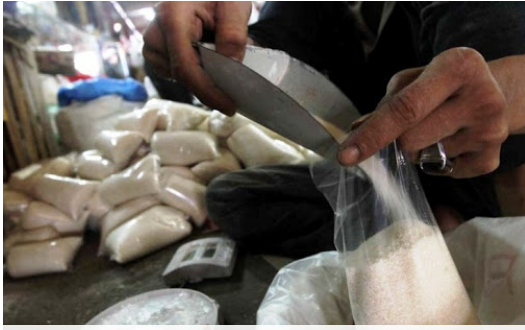
(Ilustrasi) Harga gula mulai naik jelang Ramadan. (foto--dok)

SURABAYA- Untuk periode Januari-Maret 2022, harga gula pasir di pasar modern terus bergerak naik, bergerak 3,94% dibandingkan kondisi sebulan yang lalu. Data di tingkat nasional, harga gula pasir mulai bergerak naik mendekati akhir tahun 2021. Rata-rata harga gula pasir di pasar modern per Minggu (20/3) dijual Rp 13.920 per kg, naik 0,09% dibandingkan posisi akhir pekan lalu.