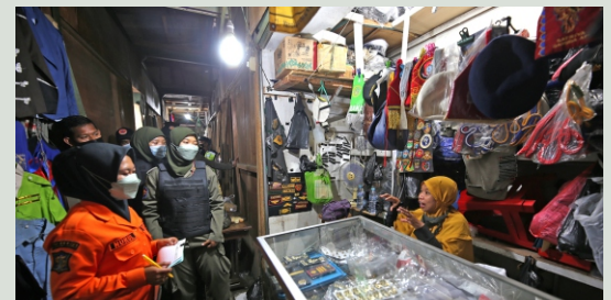
Petugas Pemkot Surabaya melakukan sosialisasi dan membantu proses pindahan pedagang Pasar Turi yang ada di Tempat Penampungan Sementara (TPS).

"Sudah dari kemarin, kami melakukan persiapan. Rencananya