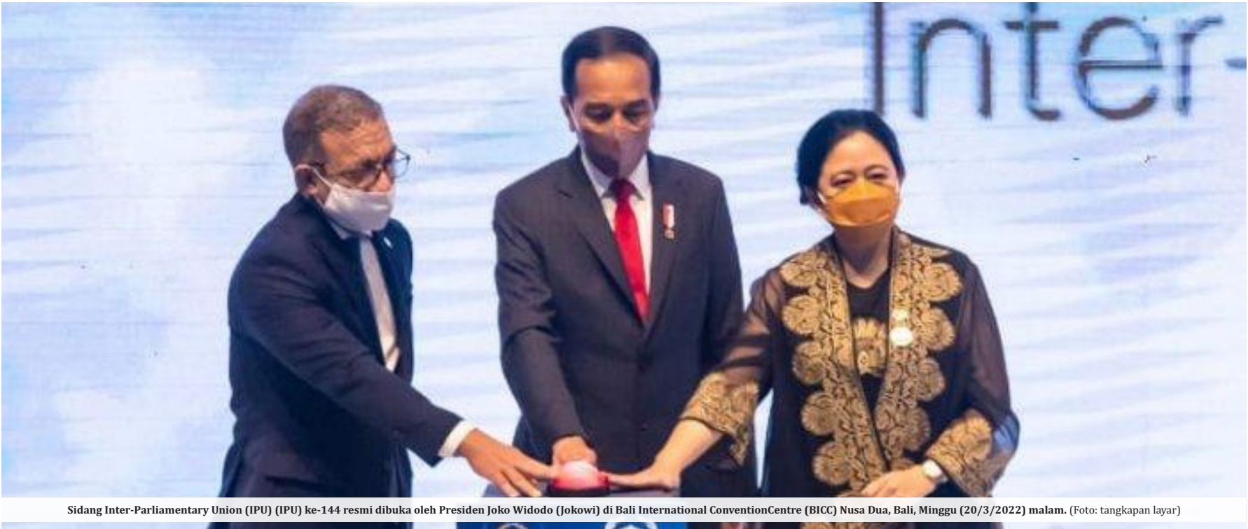
Sidang Inter-Parliamentary Union (IPU) (IPU) ke-144 resmi dibuka oleh Presiden Joko Widodo (Jokowi) di Bali International Convention Centre (BICC) Nusa Dua, Bali, Minggu (20/3/2022) malam.

NUSA DUA -Presiden Jokowi membuka secara resmi sidang Ke-144 The Inter-Parliamentary Union (IPU) di Nusa Dua, Bali Internasional Convention Center (BICC) malam ini. Dalam forum bertema "Getting to Zero: Mobilizing Parliaments to act on Climate Change", Jokowi menyampaikan beberapa hal dalam sambutannya sebelum membuka IPU.