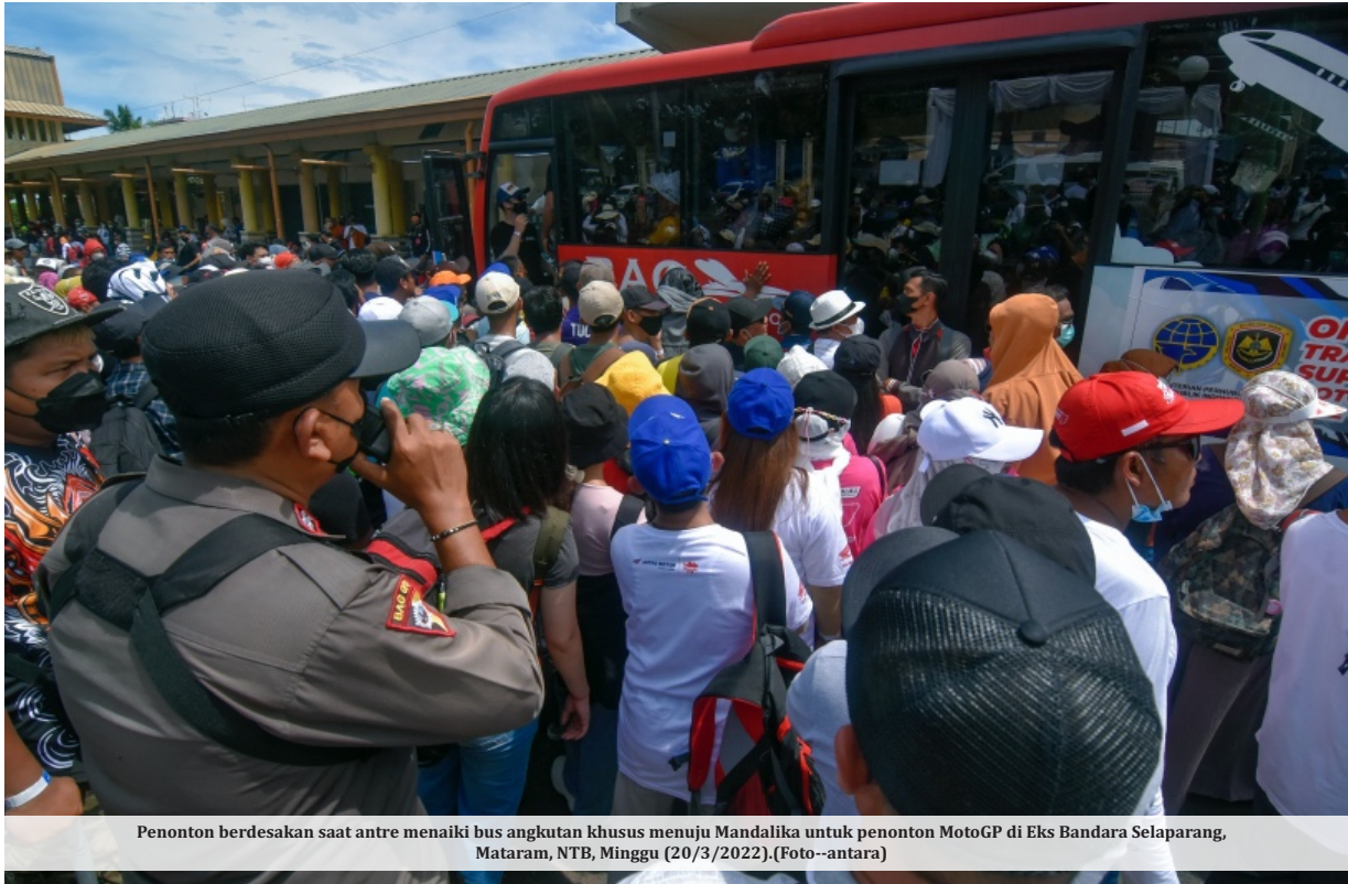
Penonton berdesakan saat antre menaiki bus angkutan khusus menuju Mandalika untuk penonton MotoGP di Eks Bandara Selaparang, Mataram, NTB, Minggu (20/3/2022).

JAKARTA -Menurut Organisasi Kesehatan Dunia (WHO) pandemi Covid-19 diprediksi akan segera berakhir. Ramalah berbeda diungkapkan Presiden Global Pfizer Vaccines Nanette Cocero yang memperkirakan pandemi baru akan selesai 2 tahun lagi atau pada 2024 mendatang. Apabila prediksi ini benar, maka pandemi di dunia diperkirakan selesai tepat di tahun pemilu nasional digelar di Indonesia.