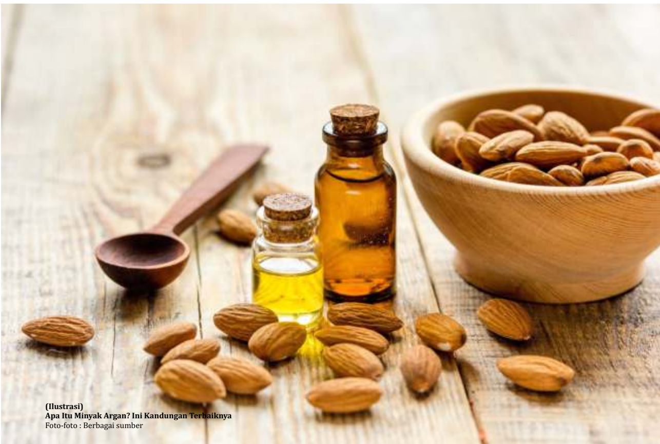
(Ilustrasi) Apa Itu Minyak Argan? Ini Kandungan Terbaiknya

Apakah kamu tengah kebingungan mencari makeup remover? Bagi kamu yang sehari-hari tak lepas dari makeup, makeup remover adalah satu benda yang wajib dipunyai. Pasalnya, makeup remover akan membantumu dalam menghapus sisa-sisa makeup setelah seharian dikenakan serta terhindar dari breakout dan kulit kusam.