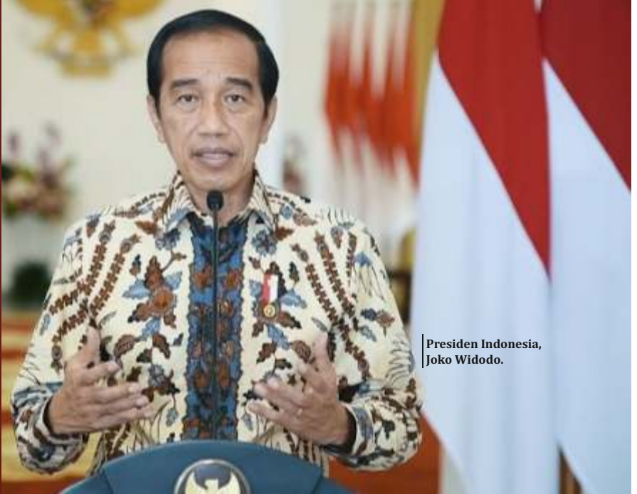
Presiden Indonesia, Joko Widodo.

tersebut bertujuan mendorong lansia melakukan vaksinasi untuk mencegah lonjakan kasus Covid-19. "Sudah dibicarakan di sana dan itu merupakan untuk memacu supaya lansia ingin divaksin booster," sebut dia.