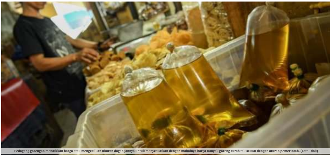
Pedagang gorengan menaikkan harga atau mengecilkan ukuran dagangannya untuk menyesuaikan dengan mahalnya harga minyak goreng curah tak sesuai dengan aturan pemerintah.

Terkait fenomena tingginya harga minyak goreng setelah pemerintah mencabut kebijakan Harga Eceran Tertinggi (HET) untuk minyak kemasan, serta berlimpahnya stok minyak goreng kemasan di ritel, menurut Helmy, hal itu disebabkan oleh naiknya harga baku utama