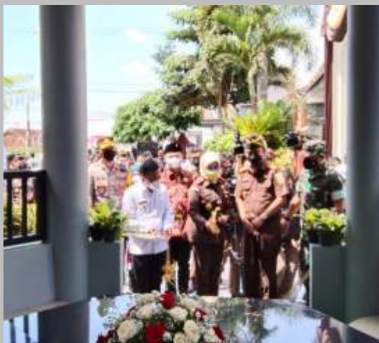
Peresmian Pondok Seduluran seluruh desa/kelurahan Kota Batu oleh Kepala Kejaksaan Tinggi Jawa Timur, Mia Amiati yang secara simbolis dilakukan di Kantor Desa Pandanrejo, Kecamatan Bumiaji, Rabu (23/3/2022).

BATU - Guna mengoptimalkan restorative justice, Kepala Kejaksaan Tinggi Jawa Timur (Kajati) Mia Amiati meresmikan Pondok Seduluran seluruh desa/kelurahan se-Kota Batu yang secara simbolis dilakukan di Kantor Desa Pandanrejo, Kecamatan Bumiaji, Rabu (23/3/2022). Dia berharap dengan adanya pondok