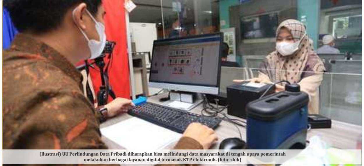
(Ilustrasi) UU Perlindungan Data Pribadi diharapkan bisa melindungi data masyarakat di tengah upaya pemerintah melakukan berbagai layanan digital termasuk KTP elektronik. (foto--dok)

Dasco mengatakan sudah mendapat permintaan dari Kementerian Komunikasi dan Informatika agar pembahasan RUU PDP bisa segera dirampungkan. Ia mengatakan pihaknya sepakat tentang hal itu dan bakal segera melakukan follow up. "Tentunya kami sepakat bahwa UU