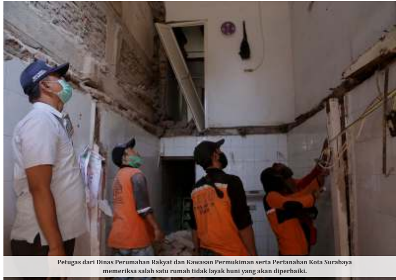
Petugas dari Dinas Perumahan Rakyat dan Kawasan Permukiman serta Pertanahan Kota Surabaya memeriksa salah satu rumah tidak layak huni yang akan diperbaiki.