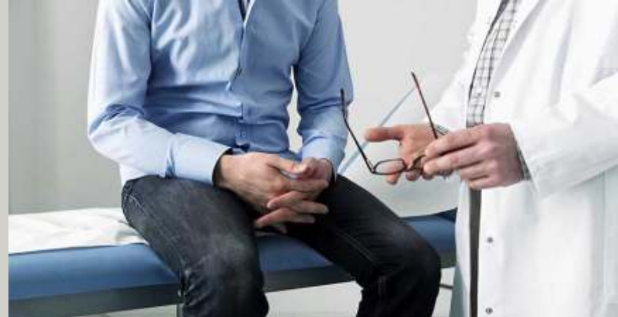
Riset ungkap beberapa suplemen ini naikkan risiko kanker prostat 163%

Dalam penelitian lain yang diterbitkan di BMJ, risiko kanker dengan suplementasi asam folat dianalisis lebih lanjut. Meta-analisis dari enam uji coba terkontrol secara acak melaporkan kejadian kanker prostat untuk pria yang menerima asam folat dibandingkan dengan kontrol.