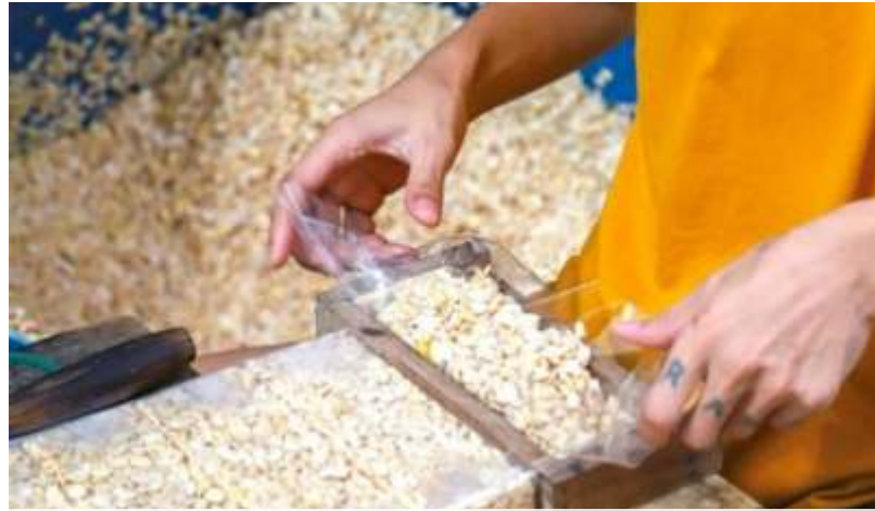
(Ilustrasi) Produsen tempe takut menaikkan harga karena bisa kehilangan pembeli sehingga banyak yang memutuskan mengecilkan ukuran saat kedelai naik harga.

Menteri Pertanian Syahrul Yasin Limpo pun mengakui bahwa kran impor perlu dibuka lebar untuk kedelai. Stok awal kedelai dari tahun