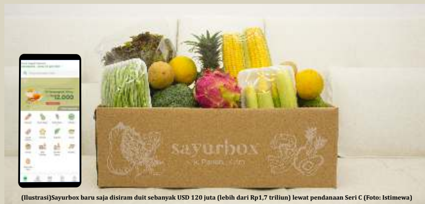
(Ilustrasi) Sayurbox baru saja disiram duit sebanyak USD 120 juta (lebih dari Rp1,7 triliun) lewat pendanaan Seri C

Adapun, daftar paling banyak justru dicatatkan oleh perusahaan rintisan dari India dan Singapura yang masing-masing menyumbang 22 dan 19 perusahaan. Kemudian ada juga Hong Kong yang menyumbang 10 perusahaan rintisan. Padahal, Menurut catatan Startup Ranking,