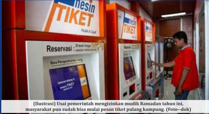
(Ilustrasi) Usai pemerintah mengizinkan mudik Ramadan tahun ini, masyarakat pun sudah bisa mulai pesan tiket pulang kampung.

Lebih lanjut, dia mengatakan, pemerintah akan mempersiapkan prasarana dan sarana dengan maksimal. Tentu disertai dengan penegakkan protokol kesehatan. Budi Karya pun memastikan juga akan merilis surat edaran sebagai tindak lanjut SE dari Satgas Covid-19 terkait persyaratan PPDN. Hal itu diharapkan bisa menjadi rujukan para pemangku kepentingan. "Ini berlaku untuk di darat, laut dan udara, juga kereta api di masa mudik," ujar Budi Karya.