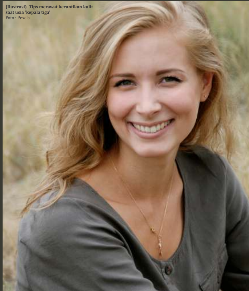
(Ilustrasi) Tips merawat kecantikan kulit saat usia 'kepala tiga'

Tidur dengan make up dapat menyumbat pori-pori, dan dapat menyebabkan munculnya jerawat atau bahkan kerutan. Oleh karena itu jangan lupa menghapus riasan apa pun di wajah sebelum tidur. Dengan membersihkan make up dapat membantu kulit bernapas, dan mencegah kotoran atau kotoran lain merembes ke dalamnya. (berbagai sumber/dya)