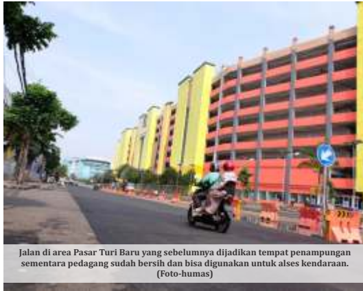
Jalan di area Pasar Turi Baru yang sebelumnya dijadikan tempat penampungan sementara pedagang sudah bersih dan bisa digunakan untuk alsas kendaraan.