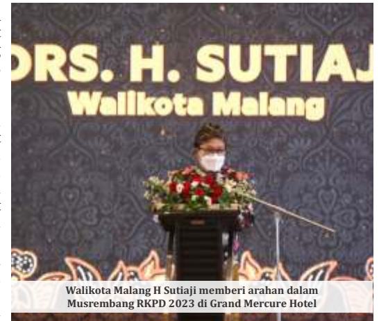
Walikota Malang H. Sutiaji memberi arahan dalam Musrembang RKKPD 2023 di Grand Mercure Hotel

Terkait inovasi daerah, Pemkot Malang juga menerima penghargaan Top Inovasi Pelayanan Publik Tahun 2021 yang berhasil disabet melalui