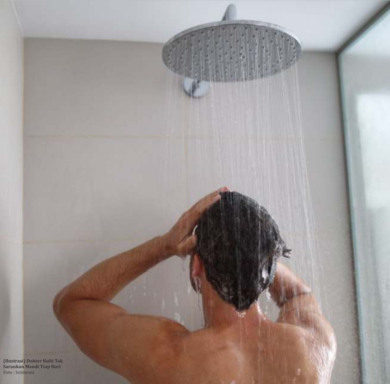
(Ilustrasi) Dokter Kulit Tak Sarankan Mandi Tiap Hari

Menurut pernyataan American Academy of Pediatrics, bayi tidak