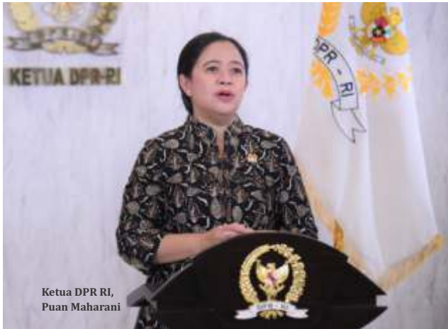
Ketua DPR RI, Puan Maharani

praktik-praktik penipuan dengan modus investasi digital," ujarnya di Jakarta, dikutip Kamis (7/4).