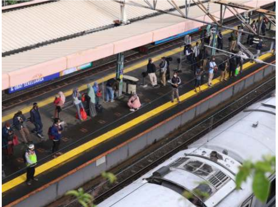
(Ilustrasi) Makin longgarnya aturan pembatasan akibat pandemi Covid-19 harus dibarengi dengan disiplin protokol kesehatan secara ketat karena makin banyak varian baru ditemukan.

Saat ini, sambung Dicky, Indonesia sudah baik dengan masalah imunitas. Namun aspek cakupan vaksinasi Covid-19 harus dikejar secara keseluruhan. Terutama cakupan vaksinasi Covid-19 dua dosis dan