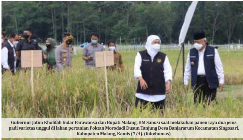
Gubernur Jatim Khofifah Indar Parawansa dan Bupati Malang, HM Sanusi saat melakukan panen raya dua jenis padi varietas unggul di lahan pertanian Poktan Morodadi Dusun Tanjung Desa Banjararum Kecamatan Singosari, Kabupaten Malang, Kamis (7/4).

"Berbeda dengan Padi Inbrida Varietas Inpari 32 yang memiliki keunggulan dengan rata-rata produksi 11,9 ton/hektar. Padi inbrida