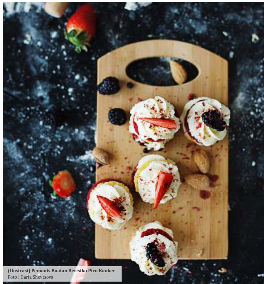
(Ilustrasi) Pemanis Buatan Berisiko Picu Kanker

Hampir mirip seperti xylitol, erythritol merupakan gula alkohol