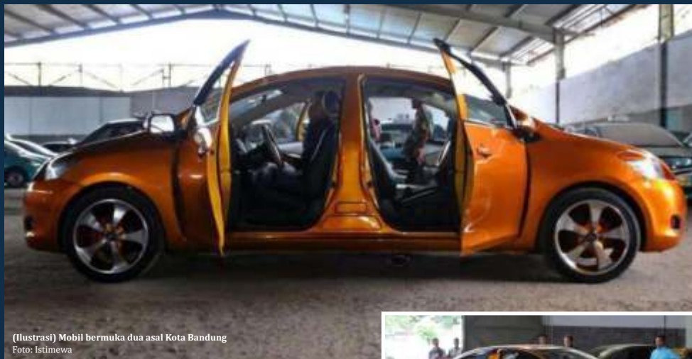
(Ilustrasi) Mobil bermuka dua asal Kota Bandung

Dari segi mesin, mobil ini memiliki dua mesin terpisah. Bahkan, dengan dua kemudi yang berbeda. Meski memiliki dua stir, mobil ini dapat dikemudikan oleh satu orang saja. Selain itu, dari segi tenaga pun bertambah menjadi 3.000 cc. "Karena