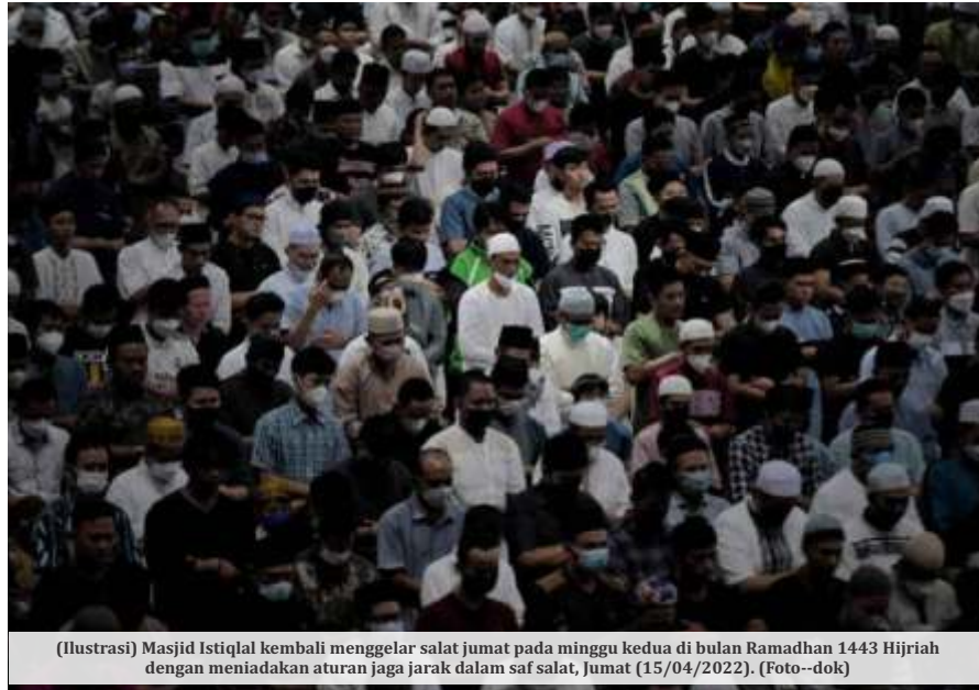
(Ilustrasi) Masjid Istiqlal kembali menggelar salat jumat pada minggu kedua di bulan Ramadhan 1443 Hijriah dengan meniadakan aturan jaga jarak dalam saf salat, Jumat (15/04/2022).

Selain itu kata Wiku, beberapa jenis percampuran baru varian Omicron dengan varian lain yang ditemukan di beberapa negara dan masih dalam proses penelitian belum ditemukan di Indonesia. Kondisi kasus yang semakin melandai dan cakupan vaksinasi yang semakin meningkat. "Namun perlu diingat