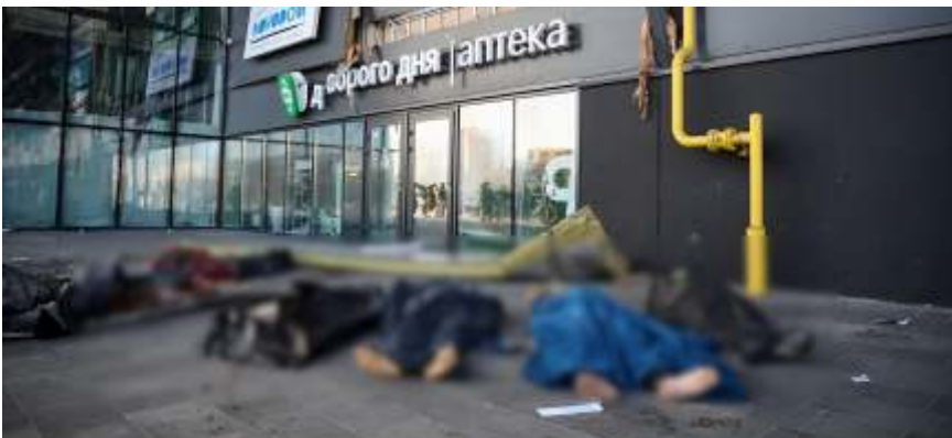
Salah satu pusat perbelanjaan di Ukraina dibom yang memicu kematian warga.

WASHINGTON D.C – Perekonomian dunia masih kacau akibat perang Rusia dan Ukraina yang hingga kini belum ada tanda-tanda penyelesaian. Ini tampak dari keputusan Dana Moneter Internasional (IMF) dan Bank Dunia memangkas proyeksi atas pertumbuhan ekonomi global. Bahkan untuk 2023 mendatang, IMF memproyeksikan ekonomi dunia akan mendekati resesi.