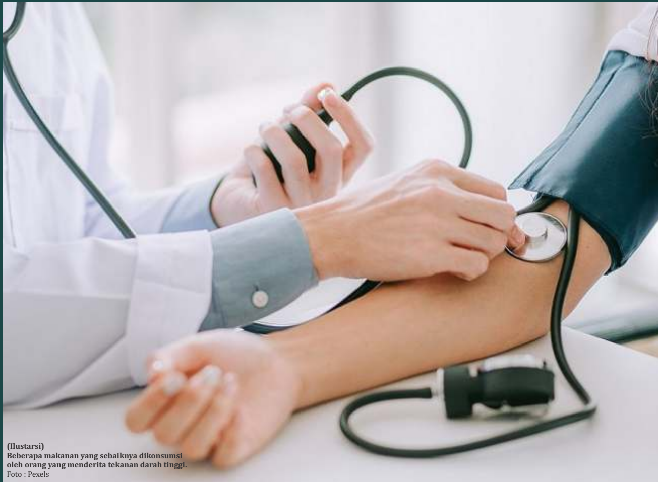
(Ilustrasi) Beberapa makanan yang sebaiknya dikonsumsi oleh orang yang menderita tekanan darah tinggi.

Modifikasi pola makan diperlukan untuk mengendalikan tekanan darah. Apa yang Anda konsumsi akan turut menentukan tekanan darah. Berikut adalah beberapa makanan yang sebaiknya dikonsumsi oleh orang yang menderita tekanan darah tinggi.