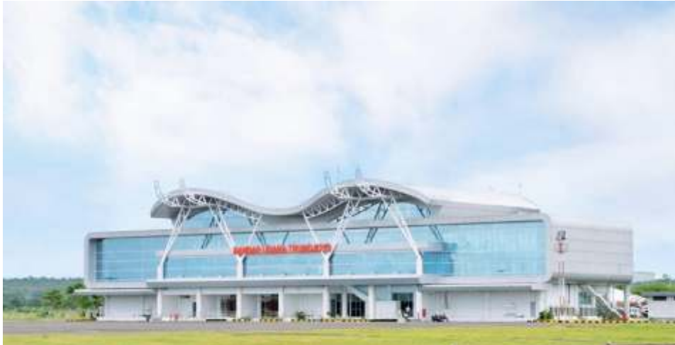
Bandara Trunojoyo di Kabupaten Sumenep, Madura, Jatim akan memudahkan akses dan mobilitas ke Pulau Garam tersebut serta tentunya memicu pertumbuhan ekonomi.

JAKARTA - Menteri Perhubungan (Menhub) Budi Karya Sumadi mengatakan kehadiran Bandara Trunojoyo akan meningkatkan pertumbuhan ekonomi di Madura dan pulau sekitarnya. Bandara yang terletak di Kabupaten Sumenep, Madura, Jawa Timur, tersebut akan diresmikan Presiden Joko Widodo pada Rabu (20/4) hari ini.