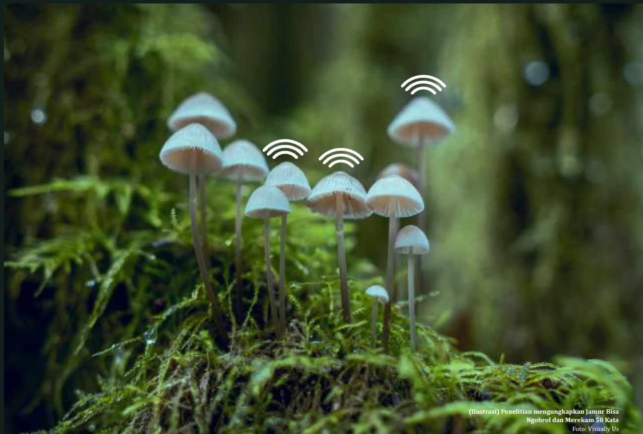
(Ilustrasi) Penelitian mengungkapkan Jamur Bisa Ngobrol dan Merekam 50 Kata

Untuk meneliti apakah jamur benar-benar bisa berinteraksi satu sama lain, peneliti menggunakan empat jenis jamur berbeda. Seperti jamur enoki, split gill, ghost dan caterpillar fungi. Penelitian yang sudah