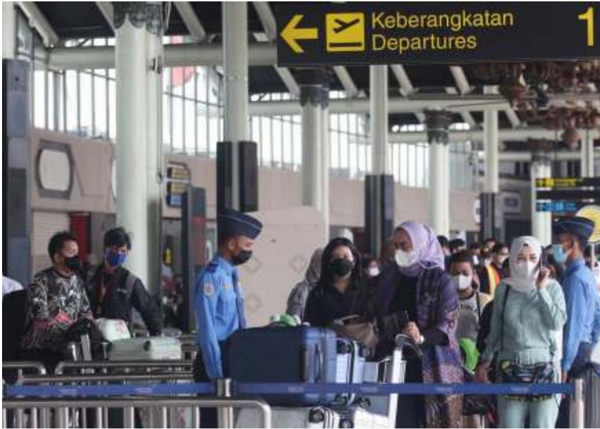
(Ilustrasi) Jelang momen mudik lebaran 2022, maskapai penerbangan diizinkan menaikkan harga tiket akibat kenaikan harga avtur. (foto-dok)

JAKARTA-Kementerian Perhubungan (Kemenhub) merestui maskapai penerbangan menaikkan harga tiket pesawat, menyusul adanya kenaikan harga minyak dan avtur dunia. Maskapai diizinkan melakukan penyesuaian biaya atau fuel surcharge pada angkutan udara penumpang dalam negeri. Warga yang berencana mudik menggunakan transportasi udara pun tampaknya harus bersiap merogok kocek lebih dalam.