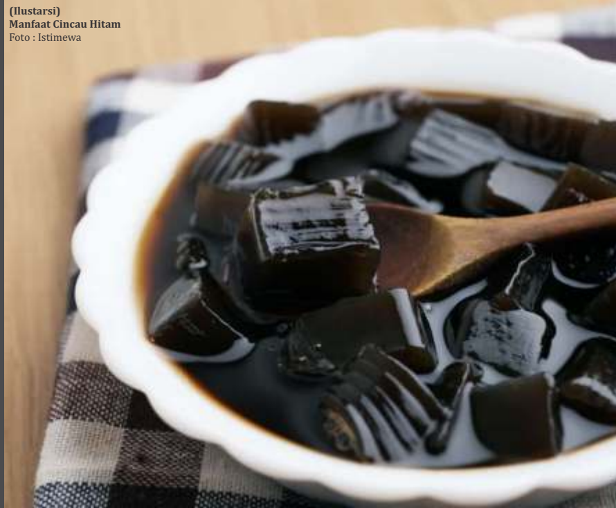
(Ilustrasi) Manfaat Cincau Hitam

Penelitian lain yang diterbitkan di Procedia Chemistry , meneliti secara khusus mengenai manfaat dari cincau hitam nih, Bunda. Nah, berdasarkan penelitian tersebut, cincau hitam mengandung flavonoid yang dapat