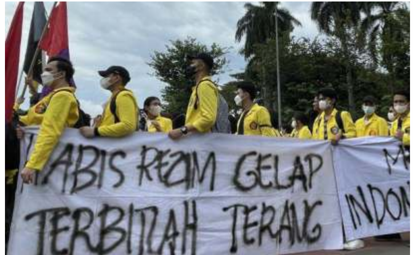
Sejumlah mahasiswa dari berbagai perguruan tinggi berdemo di Patung Kuda Arjuna Wijaya, Jakarta Pusat, Kamis (21/4/2022).

Terpisah, Menteri Perdagangan (Mendag) Muhammad Lutfi buka