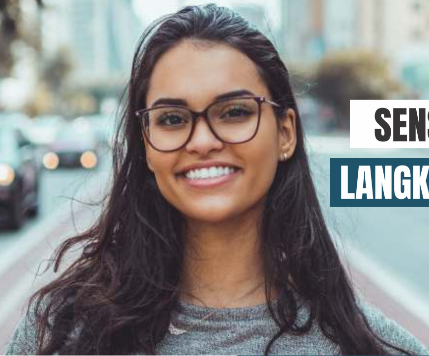
(Ilustrasi) Cara yang bisa dilakukan untuk merawat kulit sensitif dengan benar.