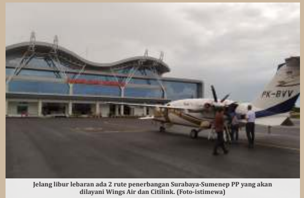
Jelang libur lebaran ada 2 rute penerbangan Surabaya-Sumenep PP yang akan dilayani Wings Air dan Citilink.

Bandara Trunojoyo juga telah dilengkapi dengan standar keselamatan yang mumpuni dan juga digunakan oleh beberapa sekolah penerbangan. Saat ini Bandara Trunojoyo melayani penerbangan perintis rute Sumenep-Bawean PP dan Sumenep-Pagerungan PP. Selain itu, Bandara Trunojoyo juga melayani penerbangan komersial dengan rute Sumenep-Banyuwangi PP.