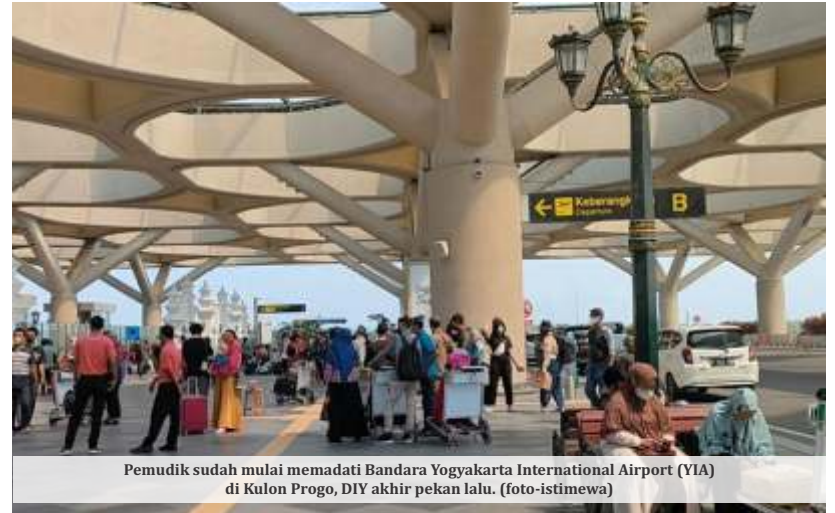
Pemudik sudah mulai memadati Bandara Yogyakarta International Airport (YIA) di Kulon Progo, DIY akhir pekan lalu. (foto-istimewa)

Menurut dia, ketentuan ini juga berlaku di negara-negara lainnya, salah satunya adalah Filipina. Dikutip