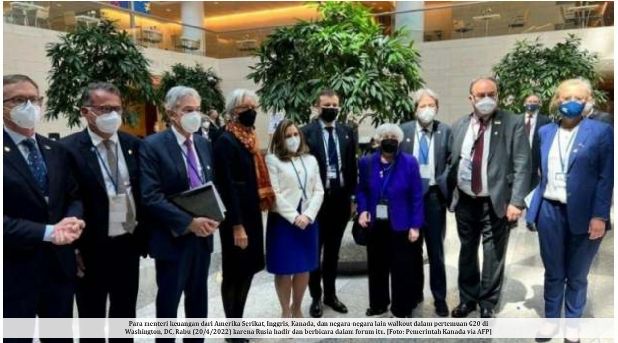
Para menteri keuangan dari Amerika Serikat, Inggris, Kanada, dan negara-negara lain walkout dalam pertemuan G20 di Washington, DC, Rabu (20/4/2022) karena Rusia hadir dan berbicara dalam forum itu.

Untuk diketahui, pejabat tinggi keuangan dari AS, Inggris, dan Kanada serentak keluar dari pertemuan saat perwakilan Rusia berbicara di forum