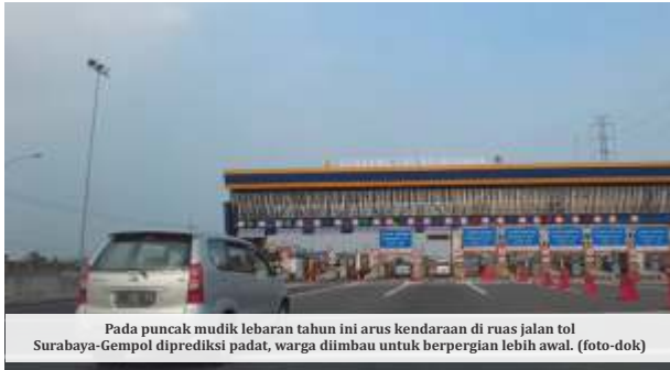
Pada puncak mudik lebaran tahun ini arus kendaraan di ruas jalan tol Surabaya-Gempol diprediksi padat, warga diimbau untuk berpergian lebih awal.

SURABAYA - Diprediksi sebanyak 268.140 kendaraan akan melintasi Tol Surabaya-Gempol pada puncak arus mudik Lebaran 29 April mendatang. Rekrayasa lalu lintas pun disiapkan untuk mengantisipasi kepadatan.