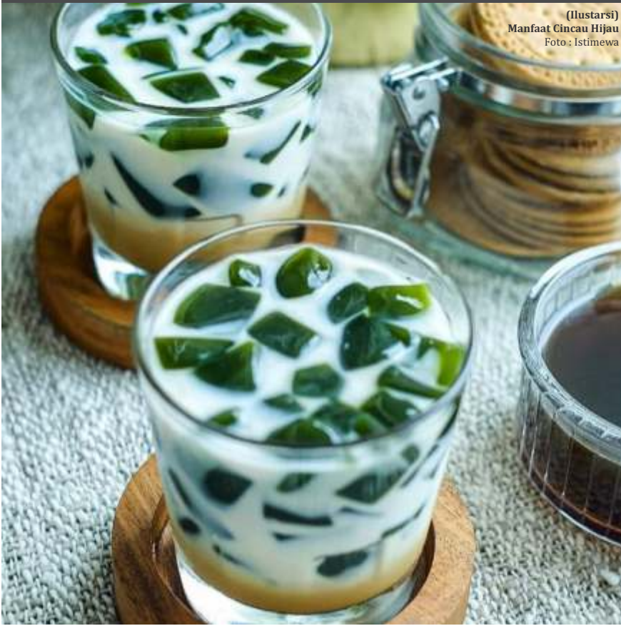
(Ilustrasi) Manfaat Cincau Hijau

Karena kaya akan antioksidan ini, cincau hitam telah terbukti dapat melindungi sel beta di pankreas lho Bunda, yaitu sel yang memproduksi insulin. Selain itu, juga dapat membantu mengontrol gula darah dan mengurangi risiko diabetes tipe 2, serta dapat membantu menurunkan kadar kolesterol darah. (berbagai sumber/dya)