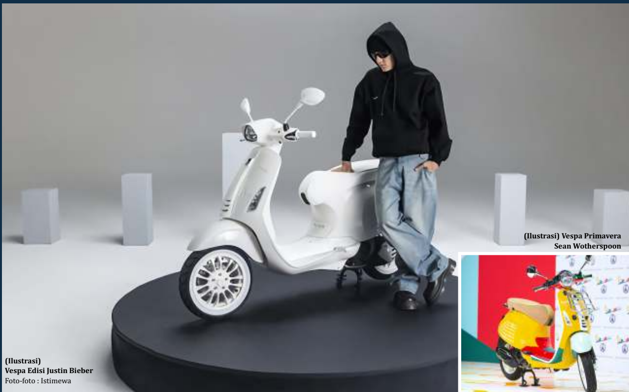
(Ilustrasi) Vespa Edisi Justin Bieber

"Pertama kali saya mengendarai Vespa adalah saat di Eropa, mungkin London atau Paris. Saya ingat saat itu saya melihat Vespa dan berkata 'Saya ingin mengendarai salah satu skuter itu'. Saya punya kenangan indah waktu