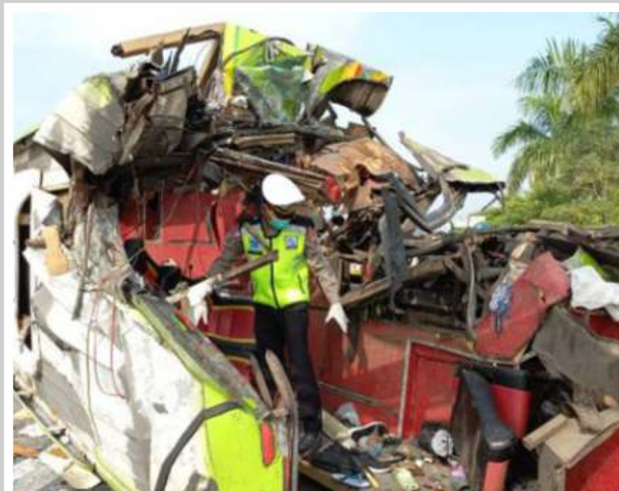
Bus pariwisata bernopol S-7322-UW tampak ringsek usai menabrak tiang papan pemberitahuan di bahu jalan, Tol Surabaya-Mojokerto, KM 712.400/A, Senin (16/5/2022).

Dan terjadi lagi, kecelakaan maut di jalan bebas hambatan. Kejadian berlangsung di Tol Surabaya-Mojokerto (Sumo), Kilometer 712+400 jalur A arah Surabaya, Jawa Timur pada Senin (16/5) sekira pukul pukul 06.20 WIB Bus pariwisata bernomor polisi S 7322 UW itu menabrak tiang variable message sign (VMS). Hingga berita ini diturunkan, sebanyak 14 orang dinyatakan meninggal. Pengemudi atau sopirnya pun berpotensi jadi tersangka karena menyebabkan kecelakaan hingga meninggal dunia. Tentu masih segar diingatan, Tubagus Joddy, sopir dalam kecelakaan tunggal yang menewaskan Vanessa Angel dan suaminya divonis 5 tahun penjara. Bak menjadi cerita yang berulang, data terakhir PT Jasa Marga mencatat, sebanyak 44% kecelakaan yang terjadi di jalan tol sepanjang 2021 adalah kecelakaan tunggal. Dari angka tersebut, sebagian besar yaitu 81% disebabkan oleh faktor pengemudi. Kalau lelah, melipir istirahat adalah pilihan bijak.