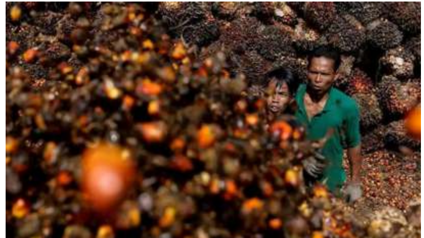
Petani sawit mengaku rugi akibat larangan ekspor hingga mereka berencana melakukan demo serta mengancam tidak bisa melakukan regenerasi tanaman. (Foto-dok)

Menurut Sahat, berdasarkan pantauan pihaknya, distribusi minyak goreng curah ke berbagai pelosok daerah ini banyak hilang di perjalanan. Padahal, kata Sahat, jika melihat data Sistem Informasi Minyak