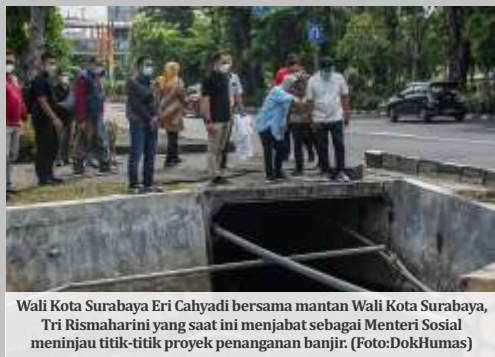
Wali Kota Surabaya Eri Cahyadi bersama mantan Wali Kota Surabaya, Tri Rismaharini yang saat ini menjabat sebagai Menteri Sosial meninjau titik-titik proyek penanganan banjir.

SURABAYA- Wali Kota Surabaya Eri Cahyadi melakukan pengecekan rencana pekerjaan penanganan banjir di kawasan Jalan Ahmad Yani sisi barat, Senin (16/5). Pengecekan dilakukan untuk memastikan lelang yang sudah mulai dilaksanakan, titik lokasinya sesuai dengan kondisi di lapangan.