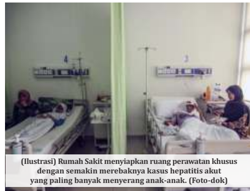
(Ilustrasi) Rumah Sakit menyiapkan ruang perawatan khusus dengan semakin merebaknya kasus hepatitis akut yang paling banyak menyerang anak-anak.

vaksin. Baru belakangan dapat vaksin itu pun di atas 6 tahun itu belum banyak yang mendapat dua dosis, ketika hadir varian yang lebih cepat Omicron dan sebagainya, mereka menjadi korban," beber Dicky.