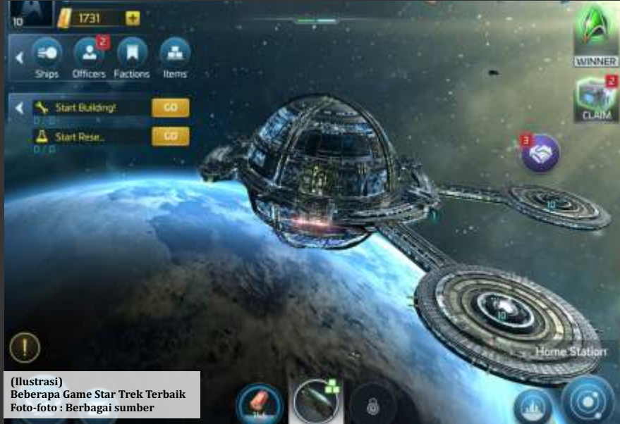
(Ilustrasi) Beberapa Game Star Trek Terbaik

Tujuan utamanya adalah untuk mempertahankan Enterprise dari