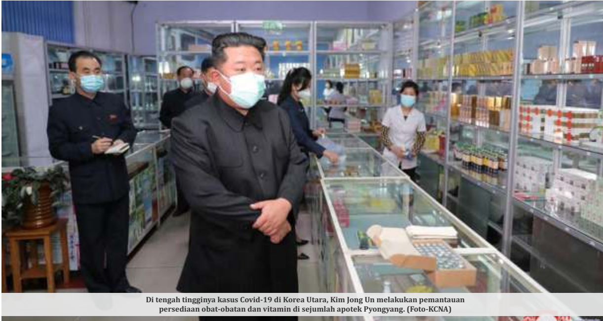
Di tengah tingginya kasus Covid-19 di Korea Utara, Kim Jong Un melakukan pemantauan persediaan obat-obatan dan vitamin di sejumlah apotek Pyongyang.

PYONGYANG - Ledakan kasus Covid-19 yang terjadi pertama kalinya di Korea Utara (Korut) jelang akhir pekan lalu membuat negara tersebut meningkatkan kewaspadaannya. Para ahli khawatir virus tersebut dapat mengganggu stabilitas negara dengan cepat. Pasalnya, saat ini persediaan obat-obatan sangat terbatas dan Korut belum memiliki program vaksinasi.