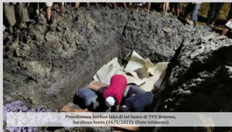
Pemakaman korban laka di tol Sumo di TPU Benowo, Surabaya Senin (16/5/2022).