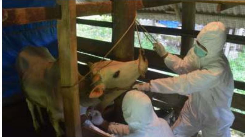
(Ilustrasi) Tim dokter hewan memeriksa ternak sapi yang terindikasi penyakit mulut dan kuku.