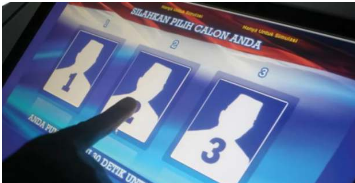
Rapat konsinyering antara pemerintah, DPR dan penyelenggara akhir pekan lalu sepakat tidak menggunakan e-voting pada Pemilu 2024.

II DPR RI ini menambahkan, jika dana Pemilu 2024 di bawah Rp 50 triliun, maka pemerintah pusat dan pemerintah daerah harus sharing anggaran. Seperti, mengeluarkan anggaran untuk protokol kesehatan, kebutuhan gudang untuk kotak suara. Sementara KPU fokus pada penyelenggaraan elektoral pemilu. "Tapi untuk protokol kesehatan dan lain-lain itu diserahkan ke pemerintah pusat dan pemerintah daerah untuk menyiapkan," ucapnya.