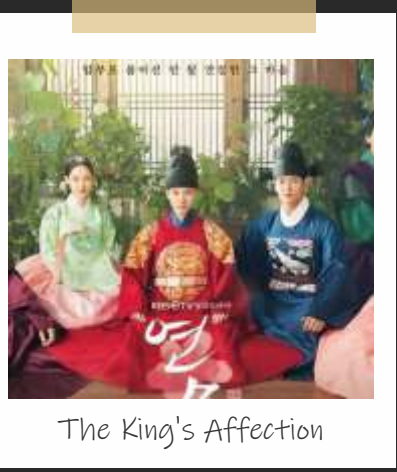
The King's Affection

Sinopsis 'Hello, My Twenties!' sendiri mengisahkan tentang lima orang gadis muda yang tinggal di sebuah rumah kontrakan yang sama. Mereka punya sifat dan kesibukan yang berbeda satu sama lainnya. Menariknya, meskipun punya perbedaan mereka merasa terhubung satu sama lain untuk saling menguatkan dalam menghadapi peliknya kehidupan. (berbagai sumber/dya)