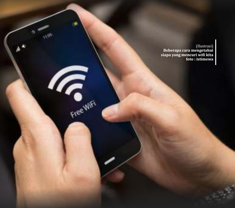
(Ilustrasi) Beberapa cara mengetahui siapa yang mencuri wifi kita

Selanjutnya, matikan semua alat yang terhubung ke router Anda.