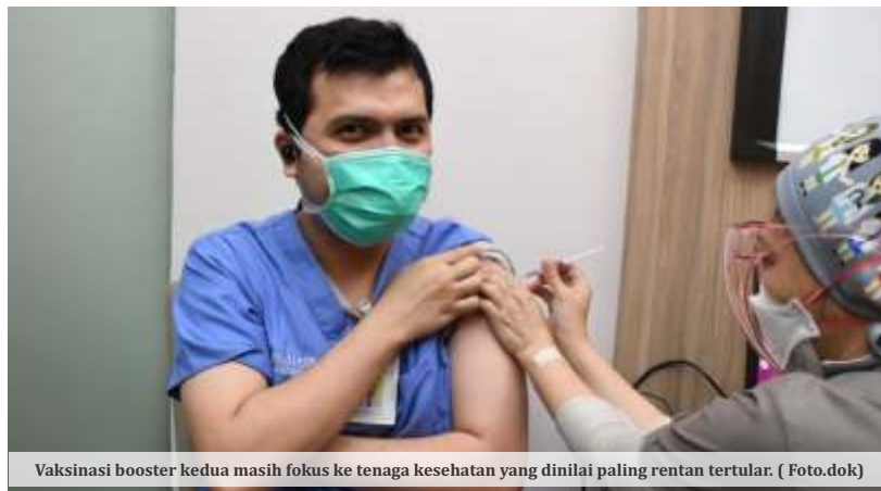
Vaksinasi booster kedua masih fokus ke tenaga kesehatan yang dinilai paling rentan tertular. (Foto.dok)

"Pemberian booster kedua bagi tenaga kesehatan perlu dilakukan