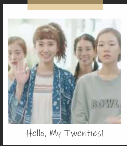
Hello, My Twenties!