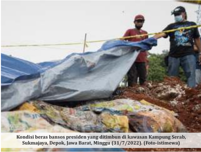
Kondisi beras bansos presiden yang ditimbun di kawasan Kampung Serab, Sukmajaya, Depok, Jawa Barat, Minggu (31/7/2022).

DEPOK -Warga Sukmajaya, Kota Depok, Jawa Barat menemukan puluhan karung beras bantuan presiden (banpres) untuk masyarakat terdampak Covid-19 terkubur di sebuah lapangan. Tumpukan sembako itu dibongkar warga setempat yang juga sebagai ahli waris tanah lapangan. Dia mengaku pertama kali mendapat informasi pemendam dari pegawai perusahaan pengiriman JNE yang lokasinya berada persis dekat lapangan.