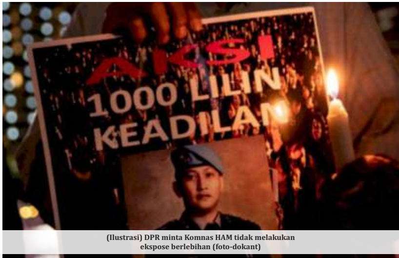
(Ilustrasi) DPR minta Komnas HAM tidak melakukan ekspose berlebihan

JAKARTA-Hingga 23 hari dari kematian Brigadir J atau Brigadir Nopryansah Yosua Hutabarat, kemelut yang melingkupinya belum juga terkuak. Terbaru, Mabes Polri membenarkan penarikan Bharada Richard Eliezer alias Bharada E--penembak Brigadir J yang dikatakan melakukan pembelaan diri-- untuk bertugas di Markas Komando Brigadir Mobil (Mako Brimob). Bharada E adalah terduga yang menembak Brigadir J hingga tewas di rumah mantan Kadiv Propam Irjen Ferdy Sambo.