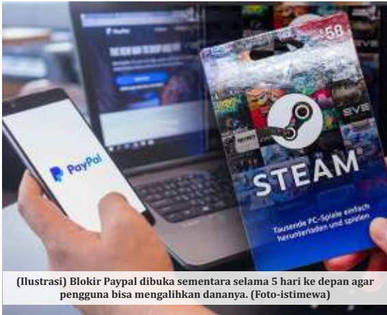
(Ilustrasi) Blokir Paypal dibuka sementara selama 5 hari ke depan agar pengguna bisa mengalihkan dananya.

JAKARTA -Media asing Channel News Asia menyoroti tentang aturan pendaftaran Penyelenggara Sistem Elektronik (PSE). Tak hanya itu, beberapa tim esports dunia yaitu Team Secret, Boom Esports, hingga Entity ikut memprotes melalui akun Twitter masing-masing. Meski demikian tampaknya pemerintah memilih bergeming.