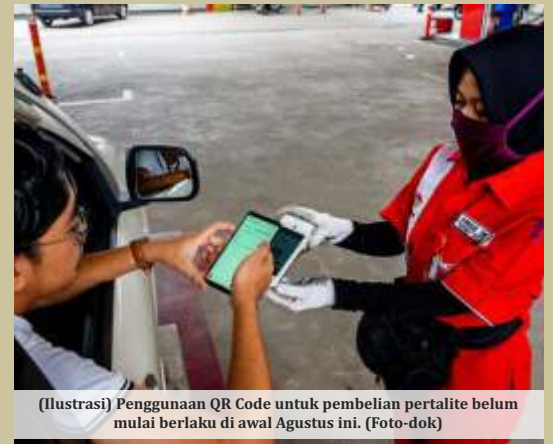
(Ilustrasi) Penggunaan QR Code untuk pembelian pertalite belum mulai berlaku di awal Agustus ini. (Foto-dok)

Dengan ini, kuota BBM Subsidi semakin menipis di mana Solar tersisa 6,6 juta KL dan Pertalite sebanyak 8,8 juta KL. Sebelumnya, pada akhir Juni yang lalu, Irto melihat dari tren konsumsi BBM Subsidi jika tidak dilakukan pengaturan akan ada potensi over quota. Diproyeksikan realisasi 2022 untuk pertalite bisa mencapai 28 juta KL, padahal kuota Pertalite di sepanjang tahun ini