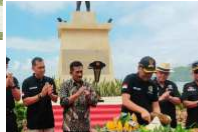
Pemotongan tumpeng oleh Wakil Bupati Tulungagung, Gatut Sunu Wibowo, saat Grand Opening Wisata Pantai Midodaren, Tulungagung, Kamis (28/7/2022).

Selain itu, terdapat patung Gajah Mada untuk mengingatkannya pada sumpahnya yang terkenal dengan Sumpah Palapa, manifestasi kebesaran kerajaan Majapahit kuno dan patung Midodari. Tidak hanya itu, jelasnya, nantinya juga akan dibangun