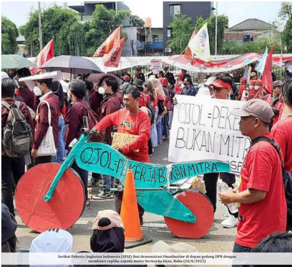
Serikat Pekerja Angkutan Indonesia (SPAI) ikut demonstrasi Omnibuslaw di depan gedung DPR dengan membawa replika sepeda motor berwarna hijau, Rabu (10/8/2022)

Ketua Komisi V DPR RI, Lasarus pun meminta perusahaan aplikasi ojek online atau ojol memperhatikan kesejahteraan para driver yang merupakan mitra mereka. Ini menyusul adanya penyesuaian tarif baru yang mengalami kenaikan.