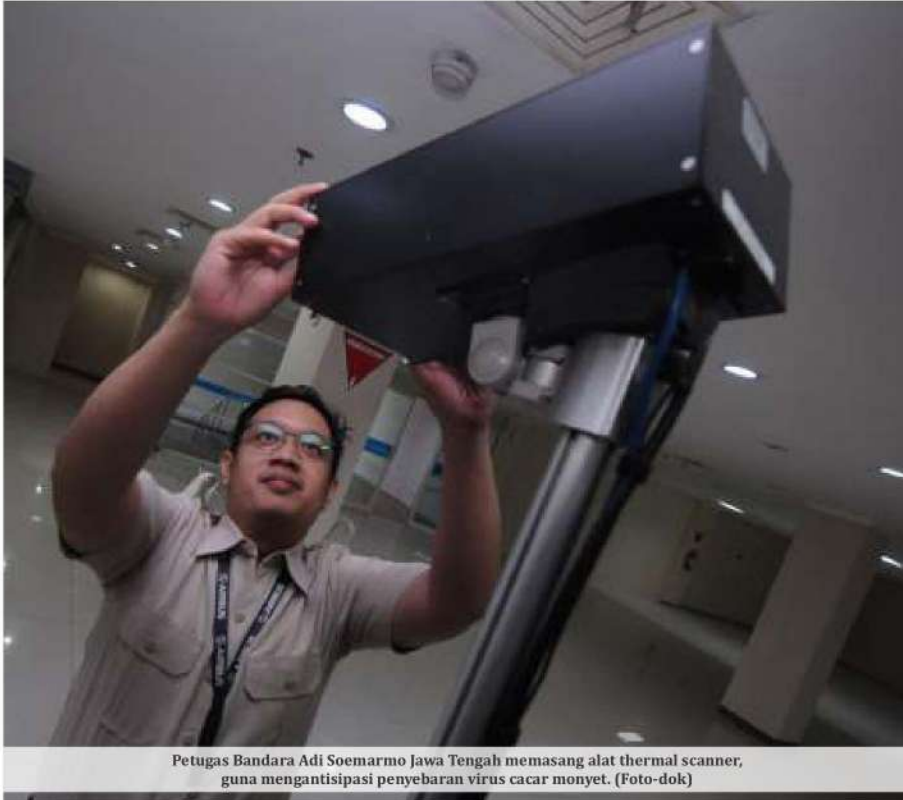
Petugas Bandara Adi Soemarmo Jawa Tengah memasang alat thermal scanner, guna mengantisipasi penyebaran virus cacar monyet.