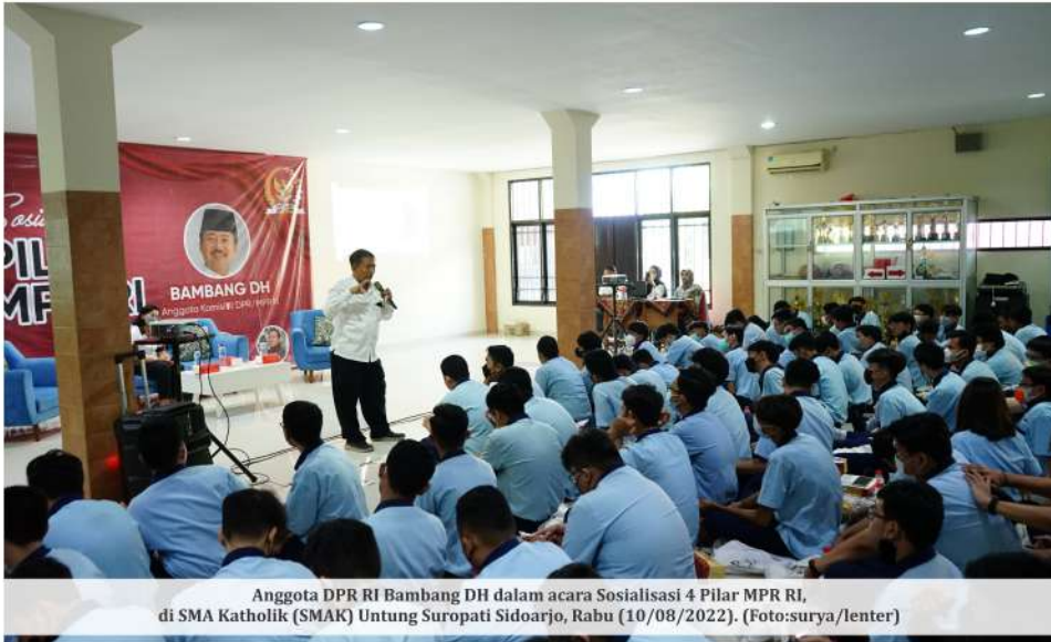
Anggota DPR RI Bambang DH dalam acara Sosialisasi 4 Pilar MPR RI, di SMA Katholik (SMAK) Untung Suropati Sidoarjo, Rabu (10/08/2022).

SIDOARJO - Generasi muda ternyata memiliki banyak ide hingga kecemasan terkait masa depan bangsa. Hal ini tampak dari antusiasme siswa-siswi SMA Katholik (SMAK) Untung Suropati Sidoarjo saat 'menghujani' anggota DPR RI Bambang DH dengan berbagai pertanyaan dalam acara Sosialisasi 4 Pilar MPR RI, Rabu (10/8).