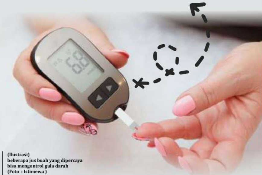
(Ilustrasi) beberapa jus buah yang dipercaya bisa mengontrol gula darah

Hasil penelitian yang diterbitkan dalam Journal of American Medical Association menyatakan minum jus tomat selama tiga minggu memberi-