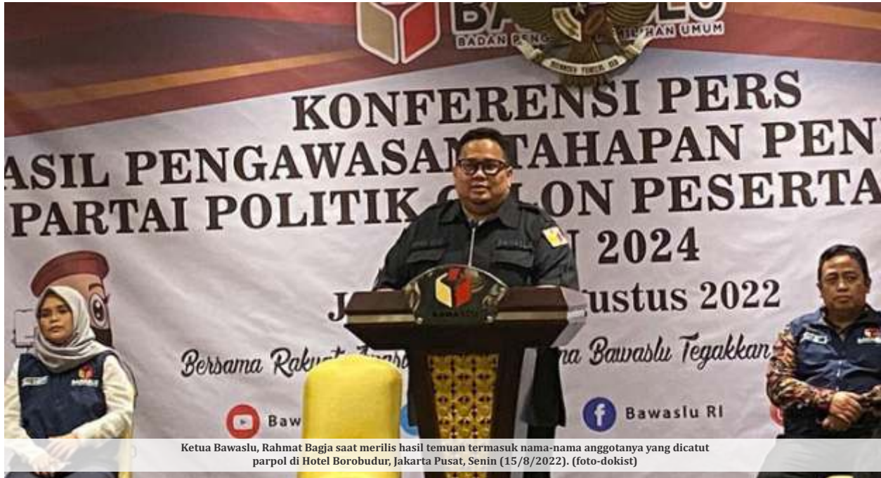
Ketua Bawaslu, Rahmat Bagja saat merilis hasil temuan termasuk nama-nama anggotanya yang dicatut parpol di Hotel Borobudur, Jakarta Pusat, Senin (15/8/2022).

JAKARTA - Masa pendaftaran partai politik (parpol) Pemilu 2024 sudah ditutup. Meski demikian, KPU masih memeriksa berkas kelengkapan dokumen partai politik yang dinyatakan belum lengkap. "Saat ini tim pemeriksa dokumen sedang terus memeriksa kelengkapan dokumen pendaftaran parpol," ujar Ketua Divisi Bidang Teknis KPU, Idham Holik dalam keterangannya, Senin (15/8/2022).