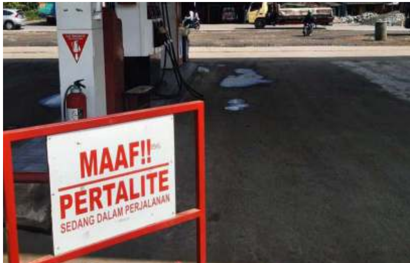
Makin banyak SPBU yang memasang tanda bila stok pertalite habis meski pemerintah mengatakan pasokan masih terkendali. (foto-dokant)

JAKARTA — Badan Pasokan masih terkendali. (foto-dokant)turnya. (Banggar) Dewan Perwakilan Rakyat (DPR) berkeras menahan kuota bahan bakar minyak (BBM) bersubsidi meski pemerintah telah meminta pelonggaran tambahan kuota sejak April 2022. Para wakil rakyat meminta pemerintah untuk menaikkan harga sejumlah komoditas energi menyusul posisi fiskal yang terhimpit hingga paruh kedua tahun ini.