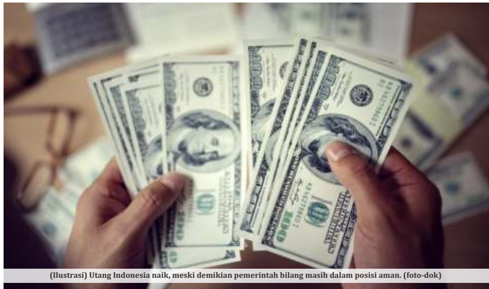
(Ilustrasi) Utang Indonesia naik, meski demikian pemerintah bilang masih dalam posisi aman.

JAKARTA - Kementerian Keuangan mencatat posisi utang pemerintah per akhir Juli 2022 sebesar Rp 7.163,12 triliun dengan rasio 37,91% terhadap produk domestik bruto (PDB). Angka itu naik dari posisi bulan sebelumnya yang senilai Rp 7.123,62 triliun.