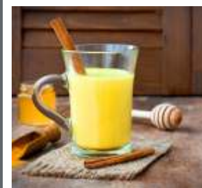
Susu Campur Kunyit