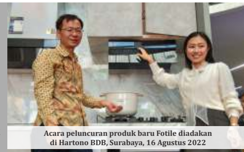
Acara peluncuran produk baru Fotile diadakan di Hartono BDB, Surabaya, 16 Agustus 2022

Fotile Built-in Combi Oven memiliki area pemanasan yang besar dan daya pemanasan yang tinggi. Sistem suhu tiga dimensi dapat mewujudkan pemanasan tiga dimensi di tiga sisi sehingga suhu lebih merata. Alat ini juga memiliki desain cincin pengumpul panas khusus dan desain pengukusan cepat, yang dapat memanaskan makanan secara penuh dan efisien, tidak peduli berapa banyak air yang digunakan. "Bake" atau "Memanggang" juga merupakan