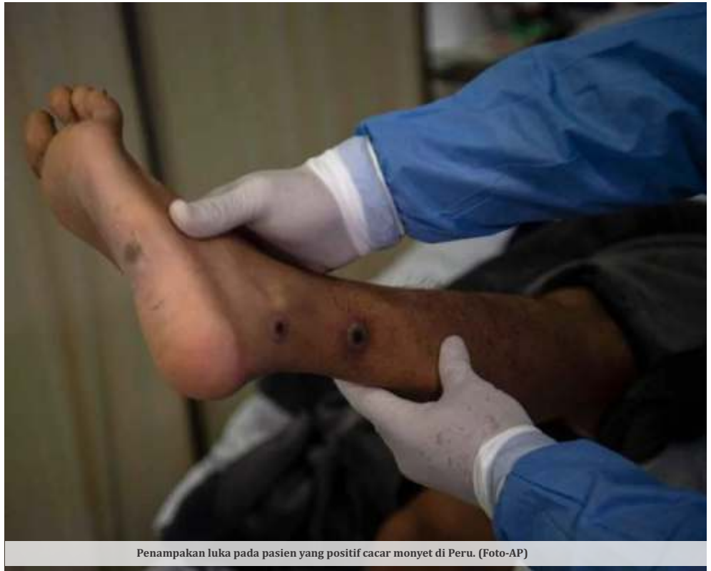
Penampakan luka pada pasien yang positif cacar monyet di Peru.

"Karena kasus cacar monyet ini adalah kasus yang menular yang memerlukan kontak tracing kepada orang-orang yang pernah kontak erat