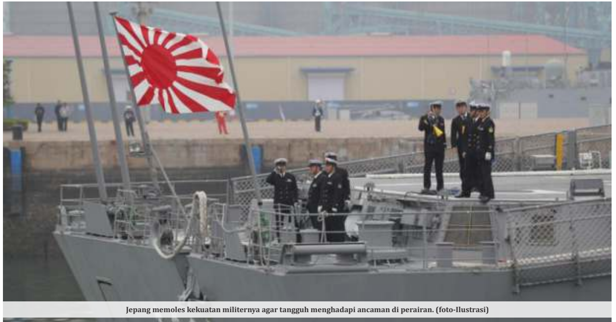
Jepang memoles kekuatannya agar tangguh menghadapi ancaman di perairan. (foto-Ilustrasi)

Komando Teater Timur Tentara Pembebas Rakyat (PLA) mengatakan