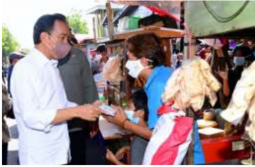
Presiden Jokowi saat memberikan bantuan kepada salah satu pedagang kaki lima, dalam kunjungannya ke Surabaya, Minggu (21/8/2022).

SURABAYA -Presiden RI Joko Widodo (Jokowi) menyampaikan jika capaian vaksinasi di Indonesia sudah mencapai 432 juta dosis. Hal tersebut disampaikannya saat mengunjungi Surabaya pada Minggu (21/8)..