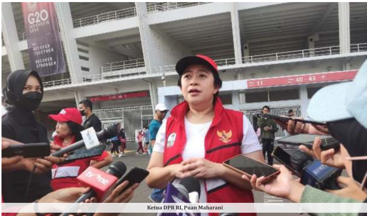
Ketua DPR RI, Puan Maharani

Dia berharap pemerintah dapat mengalokasikan surplus APBN itu untuk menambal beban pada subsidi energi tahun ini. "Pemerintah juga bisa secara paralel pangkas belanja infrastruktur, belanja pengadaan barang jasa di Pemda dan pemerintah