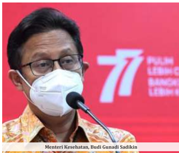
Menteri Kesehatan, Budi Gunadi Sadikin

JAKARTA -Kementerian Kesehatan (Kemenkes) menemukan pasien positif cacar Monyet yang masuk ke Indonesia. Pasien tersebut merupakan WNI berjenis kelamin pria dan berusia 27 tahun. Diketahui, pasien tersebut mengalami keluhan kesehatan ringan beberapa hari setelah kembali ke Indonesia pada tanggal 8 Agustus 2022 lalu. Sementara itu, Dinas Kesehatan (Dinkes) DKI Jakarta mengatakan ada tiga orang yang kontak erat dengan pasien tersebut.