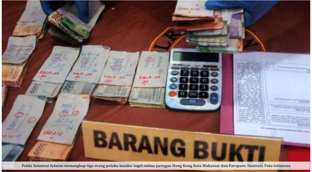
Polda Sulawesi Selatan menangkap tiga orang pelaku bandar togel online jaringan Hong Kong Kota Makassar dan Parepare. Ilustrasi.

Menkominfo Johnny G. Plate memastikan, pemerintah terus bekerja dalam membersihkan ruang