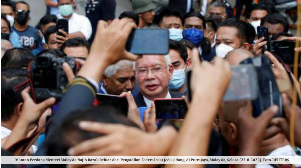
Mantan Perdana Menteri Malaysia Najib Razak keluar dari Pengadilan Federal saat jeda sidang, di Putrajaya, Malaysia, Selasa (23-8-2022).

PUTRAJAYA- Eks-Perdana Menteri (PM) Malaysia, Najib Razak, resmi dijebloskan ke bui pada Selasa (23/8), terkait kasus korupsi 1 Malaysia Berhad (1MDB) yang membelitnya. Mahkamah Agung Malaysia tetap mengukuhkan hukuman 12 tahun penjara kepada pria 69 tahun tersebut.