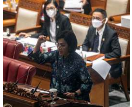
Menteri Keuangan Sri Mulyani berpidato dalam rapat paripurna DPR di kompleks Parlemen, Senayan, Jakarta, Selasa (23/8/2022).

Presiden Joko Widodo akhirnya juga buka suara soal rencana kenaikan Bahan Bakar Minyak (BBM). Jokowi mengatakan, kenaikan BBM menyangkut hajat orang banyak sehingga harus diputuskan hati-hati. "Ini menyangkut hajat hidup