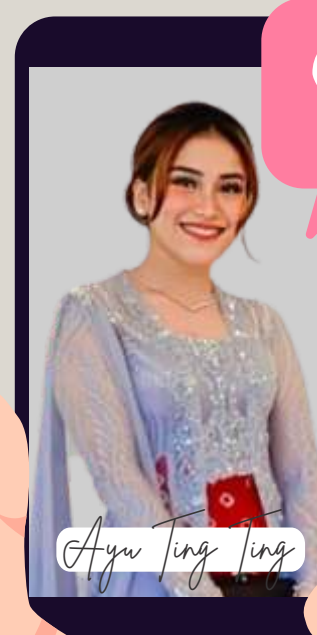
Ayu Ting Ting