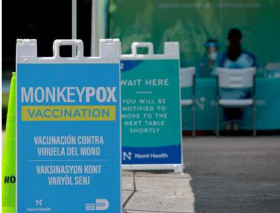
Amerika Serikat menjadi negara dengan jumlah infeksi cacar monyet terbanyak. Pemerintah Joe Biden pun mulai gencar melakukan vaksinasi seperti tampak di Miami, Florida pekan ini.

JAKARTA-Dinas Kesehatan (Dinkes) Provinsi Daerah Khusus Ibukota (DKI) Jakarta mengungkapkan bahwa pasien kasus pertama terkonfirmasi cacar monyet (clade) di Indonesia sedang melakukan isolasi mandiri (isoman) di rumah di Jakarta. Jangka waktu yang dibutuhkan antara 21-28 hari hingga luka kulitnya sembuh dan muncul lapisan kulit baru.