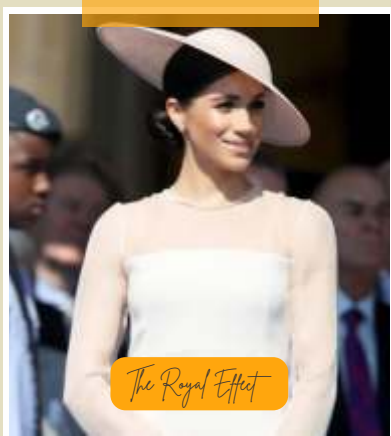
The Royal Effect

Di tahun 2011 hingga 2015, flower crown menjadi aksesoris paling laris digunakan oleh para khalayak umum. Kemunculan flower crown tersebut, dimulai ketika beberapa selebriti ternama menggunakan flower crown sebagai aksesoris untuk mempercantik penampilan mereka. Sebelumnya flower crown lebih sering terlihat pada pesta pernikahan. Namun, berkat penampilan memukau Lana Del Rey dan juga Vanessa Hudgens di Coachella pada saat itu, menjadikan permintaan flower crown meningkat, dan menjadikan trend fashion selama beberapa waktu. Kental dengan suasana bohemian, flower crown menjadi atribut yang paling banyak digunakan ketika berhubungan dengan festival fesyen. (ist,ins/dya)