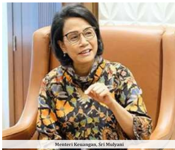
Menteri Keuangan, Sri Mulyani

JAKARTA- Pemerintah menilai reformasi di bidang pensiun menjadi sangat penting untuk segera dilakukan. Sebab dana pensiunan hingga saat ini mencapai Rp2.800 triliun terdiri dari pemerintah pusat sebesar Rp900 triliun dan pemerintah daerah sebesar Rp1.900 triliun.