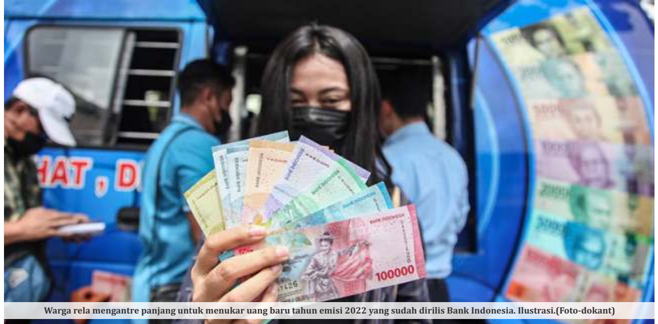
Warga rela mengantre panjang untuk menukar uang baru tahun emisi 2022 yang sudah dirilis Bank Indonesia. Ilustrasi.

Sebagai gambaran, redenominasi adalah penyederhanaan dan penyetaraan nilai Rupiah. Dalam kajian Bank Indonesia dijelaskan, redenominasi bukanlah sanering atau pemotongan daya beli masyarakat