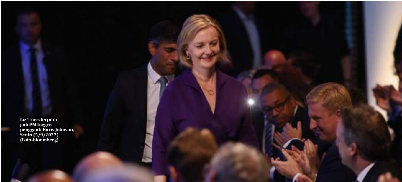
Liz Truss terpilih jadi PM Inggris pengganti Boris Johnson, Senin (5/9/2022).

Ukraina pada bulan Februari ia mengambil sikap tegas, bersikeras semua pasukan Vladimir Putin harus diusir dari negara itu.