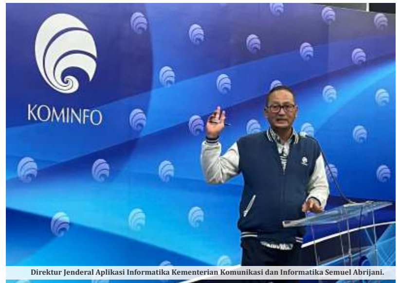
Direktur Jenderal Aplikasi Informatika Kementerian Komunikasi dan Informatika Semuel Abrijani.

Alfons menduga, kebocoran data 1,3 miliar nomor HP beserta nomor KTP itu disebabkan karena pihak pengelola data registrasi kartu SIM Prabayar, entah itu pihak dari operator seluler, pihak Kominfo, atau instansi pemerintah lainnya, tidak mengamankan data dengan baik. "Sehingga datanya bocor. Nah, dari insiden ini yang paling dirugikan adalah masyarakat. Kalau memang masyarakat sudah menjadi korban