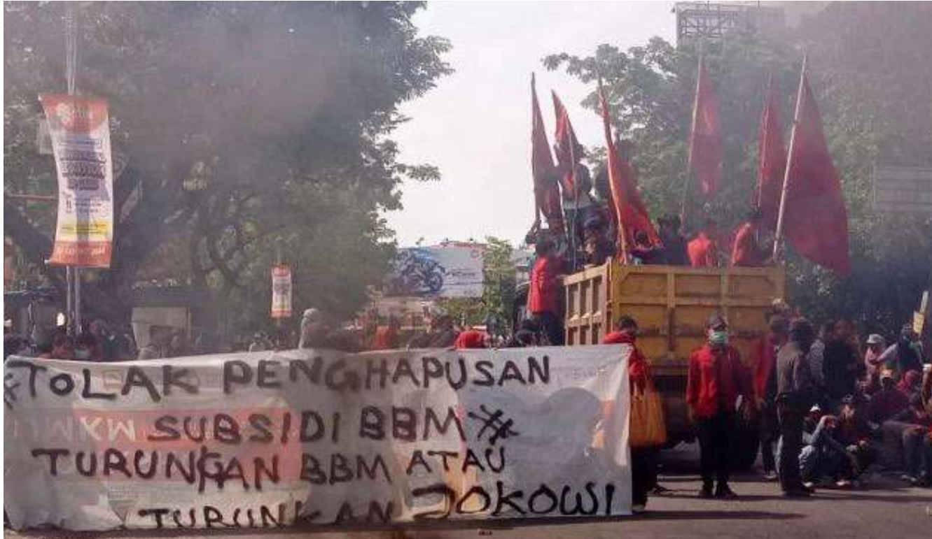
Unjuk rasa menolak kenaikan harga BBM disuarakan Ikatan Mahasiswa Muhammadiyah (IMM) di depan kampus Universitas Muhammadiyah, Jl Sultan Alauddin, Makassar, Senin (5/9/2022) Siang.

JAKARTA- Kenaikan harga Bahan Bakar Minyak (BBM) subsidi dan Pertamina tak serta merta membuat keuangan negara sehat. Buktinya, anggaran subsidi energi diproyeksi tetap membengkak dari Rp 502,4 triliun di tahun ini.