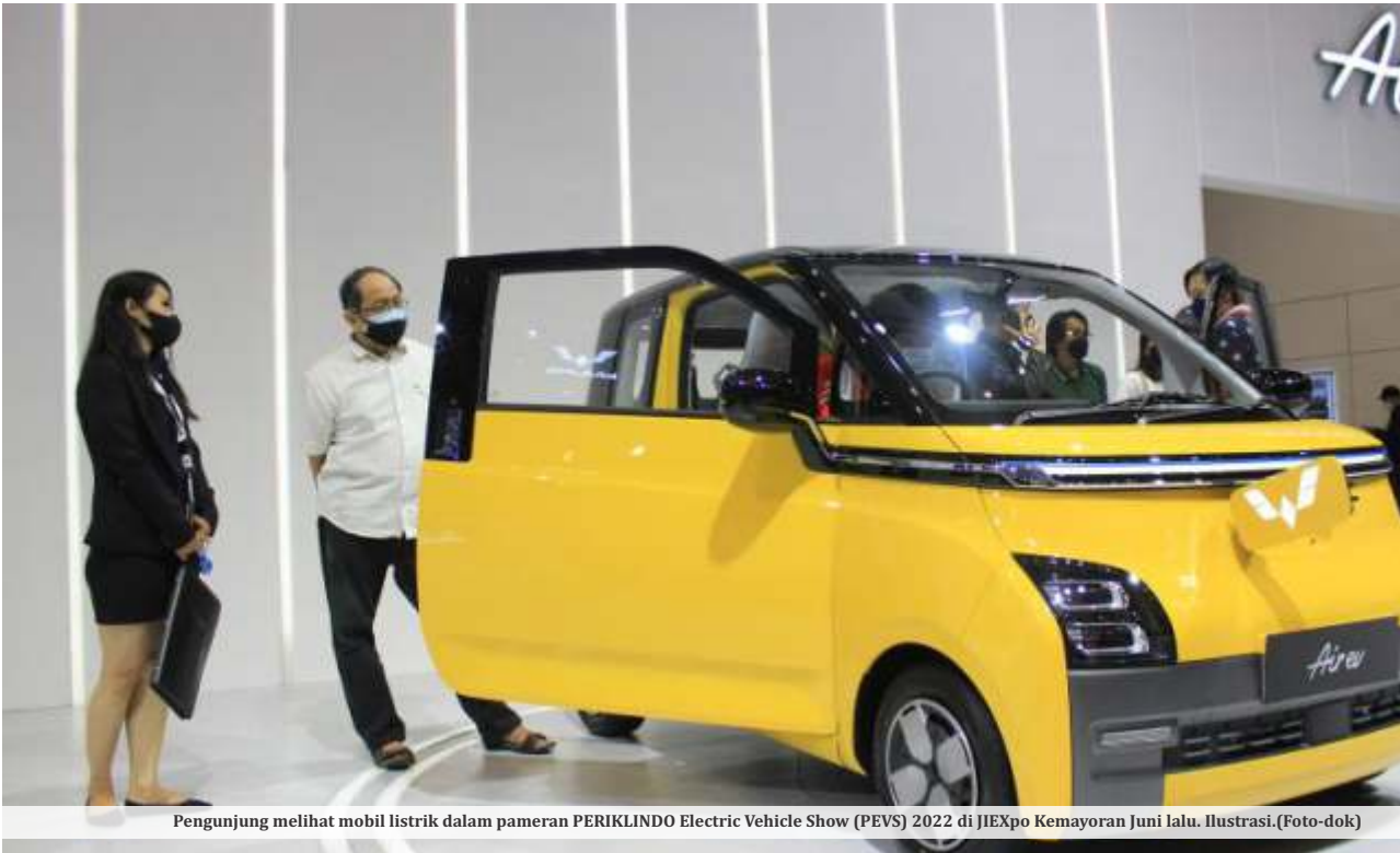
Pengunjung melihat mobil listrik dalam pameran PERIKLINDO Electric Vehicle Show (PEVS) 2022 di JIEXpo Kemayoran Juni lalu. Ilustrasi.

JAKARTA - Meski masih lama yaitu sekitar 28 tahun lagi, namun pemerintah Indonesia sudah mematangkan elektrifikasi di segala bidang, salah satunya industri otomotif. Menurut roadmap atau peta jalan yang dirancang, RI akan 'mengharamkan' penjualan sepeda motor konvensional (bensin) di tahun 2040 dan mobil konvensional (bensin dan diesel) di tahun 2050.