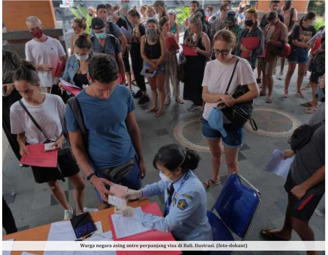
Warga negara asing antre perpanjang visa di Bali. Ilustrasi.

Presiden Joko Widodo (Jokowi) menyentil imigrasi karena masih menggunakan 'gaya lama' dalam