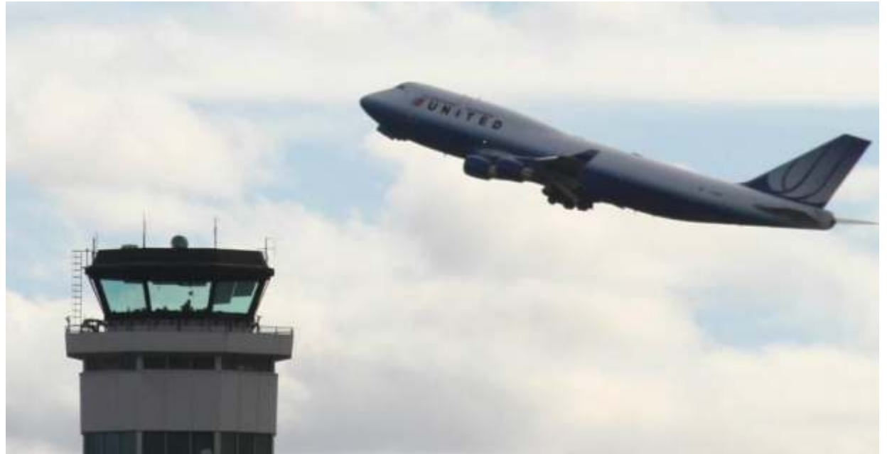
Perpres tentang pengesahan perjanjian Flight Information Region (FIR) Indonesia dan Singapura telah diteken Presiden Jokowi. Ilustrasi.